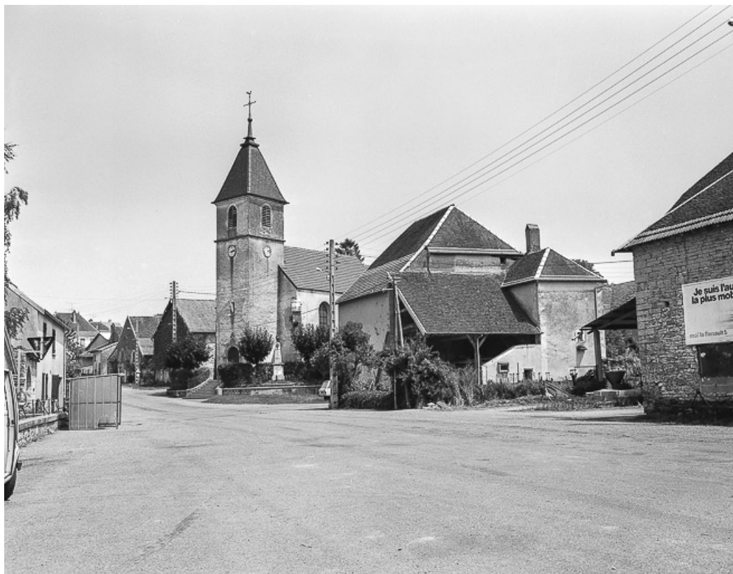
Extérieur : façade antérieure avec tour-clocher dans l'enfilade de la rue. 70, Venère rue de l' Eglise