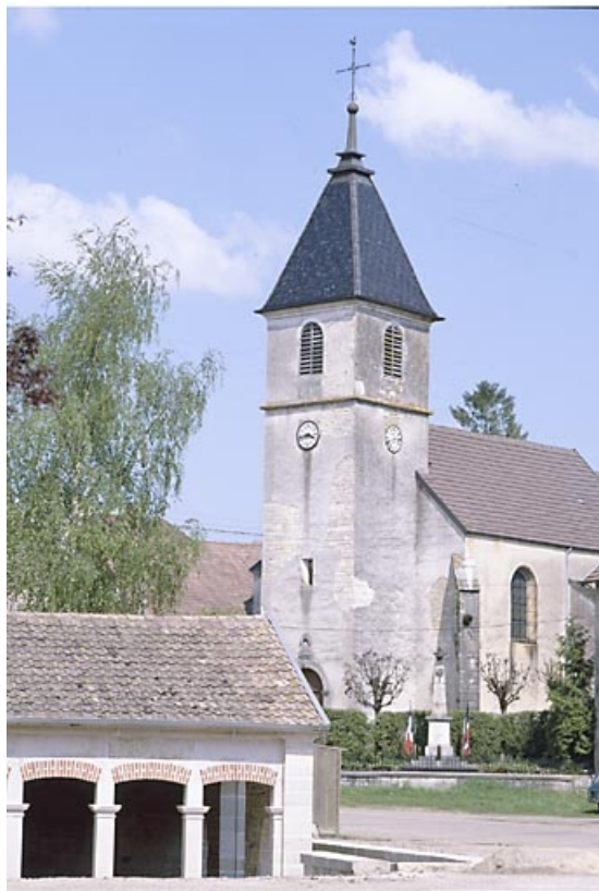
Façade antérieure dans le prolongement du lavoir.