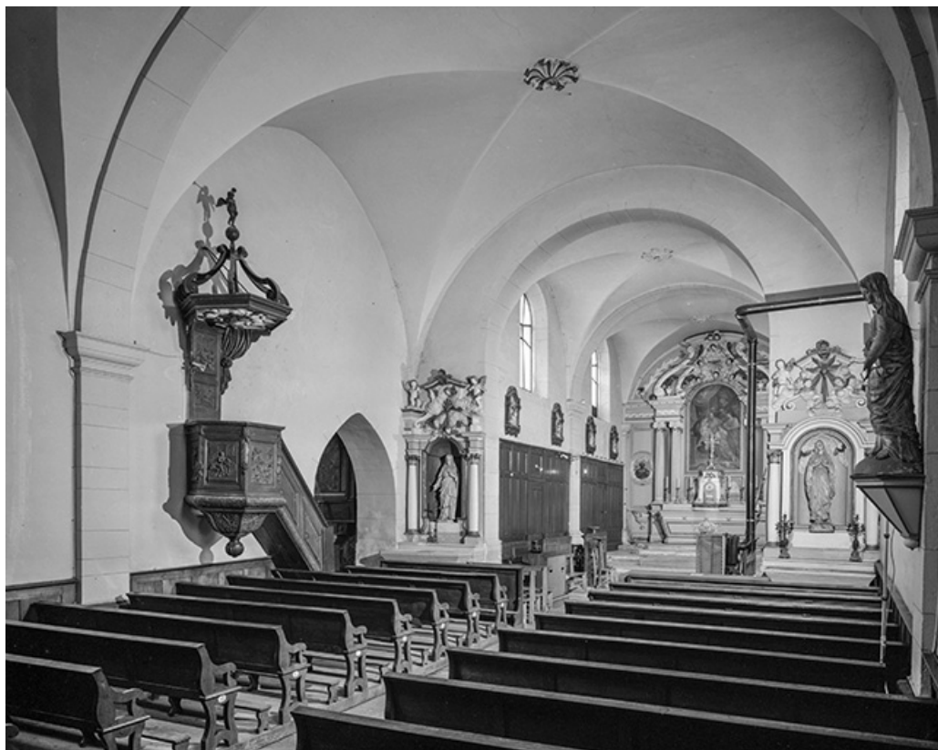
Intérieur : nef et chœur.