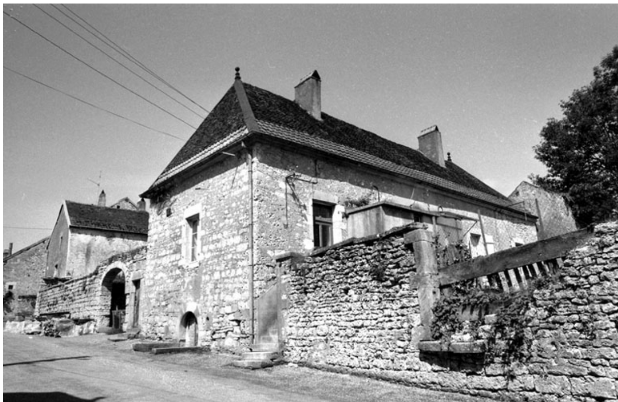
Vue d'ensemble depuis la rue : de trois quarts droit.