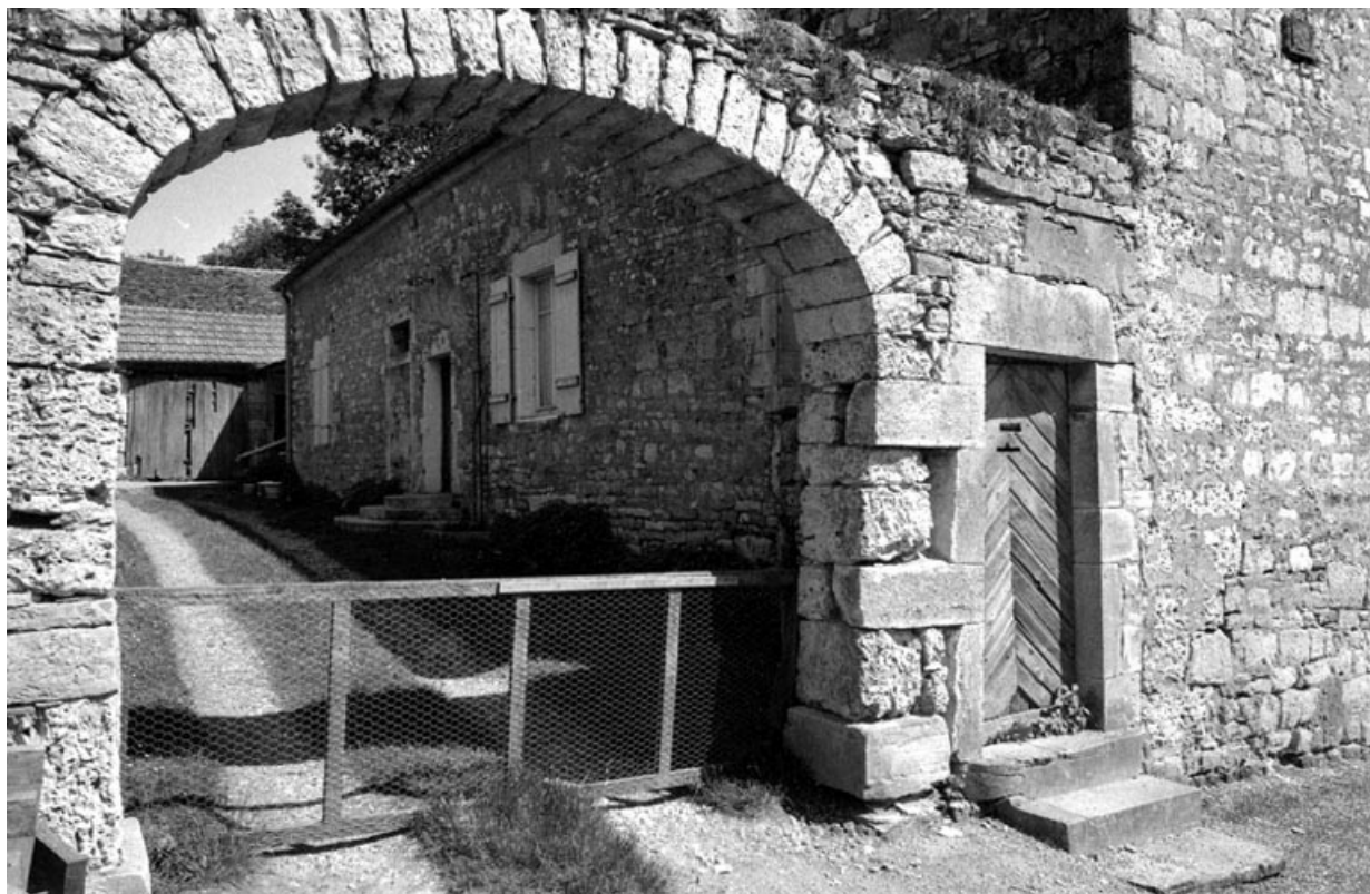
Façade antérieure entrée de la cour.