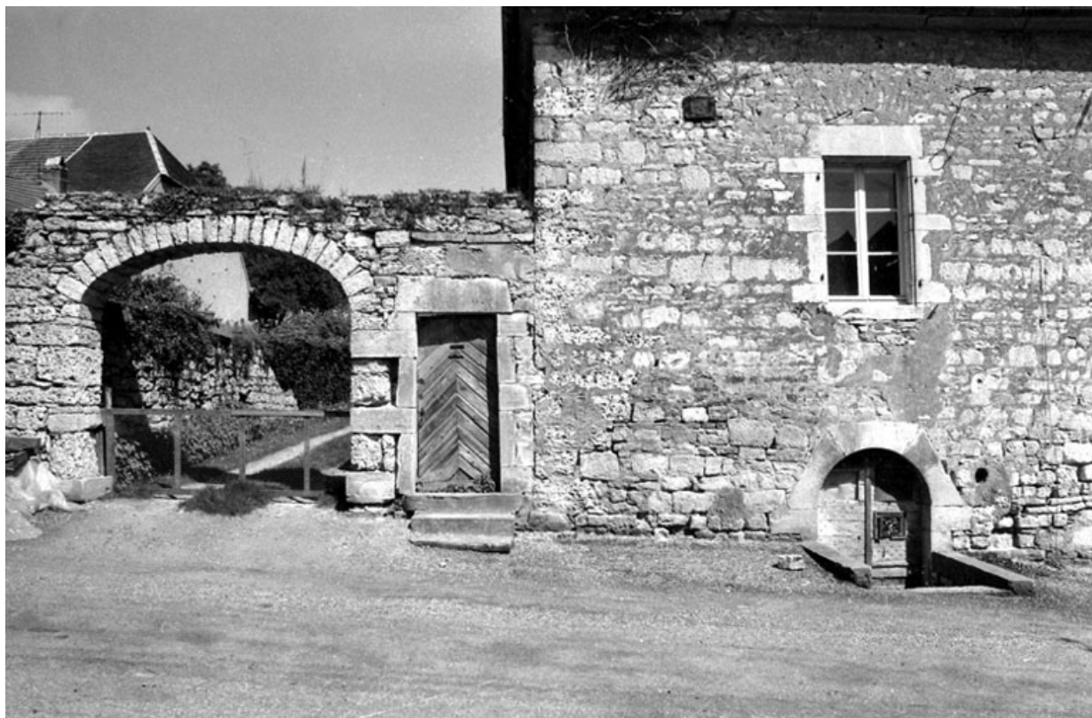
Détail : entrée de la cour.