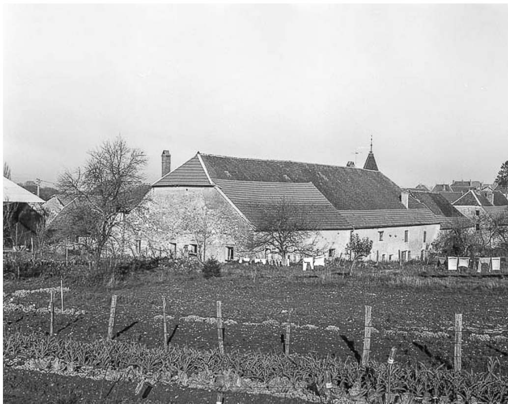
Façade postérieure : vue éloignée