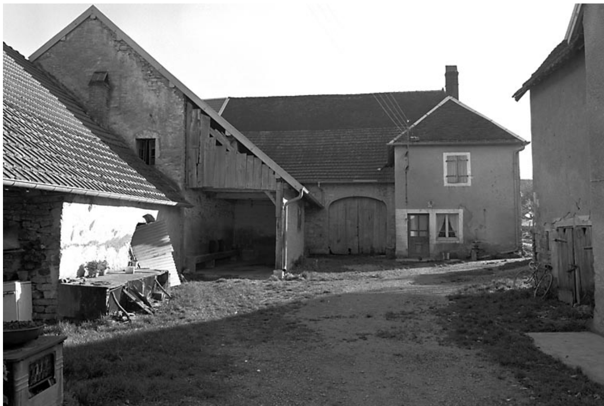
Vue d'ensemble depuis la cour.