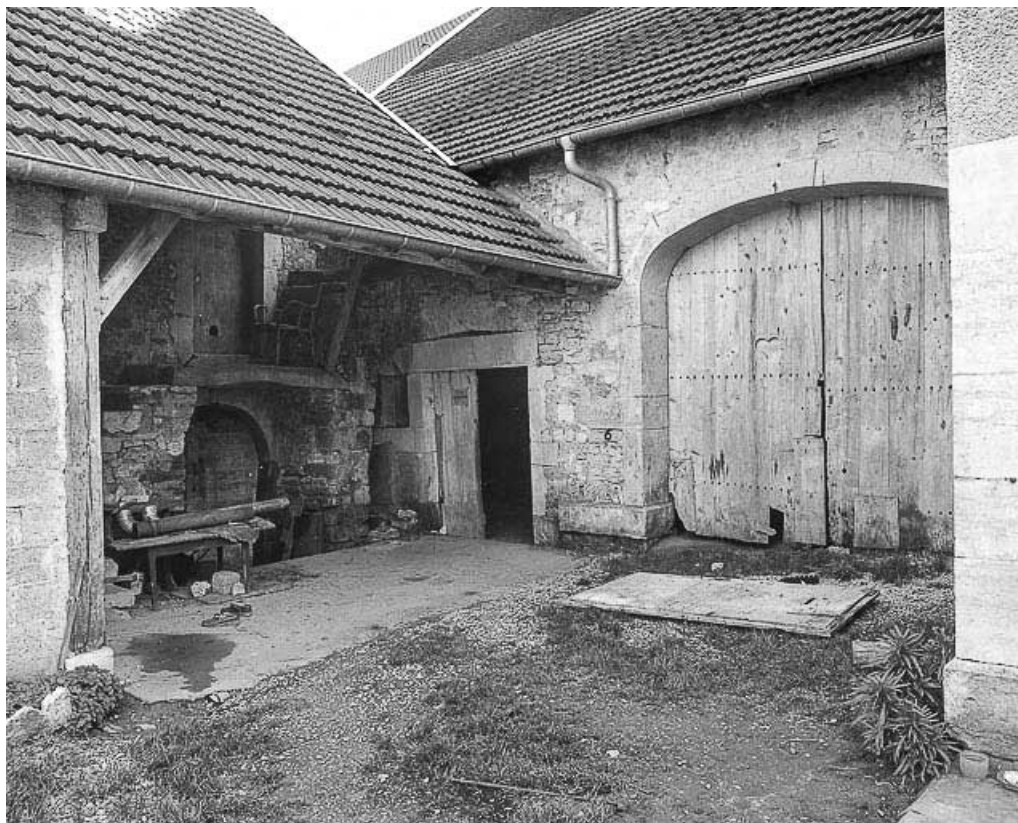
Détail : parties agricoles. 70, Venère route de Valay