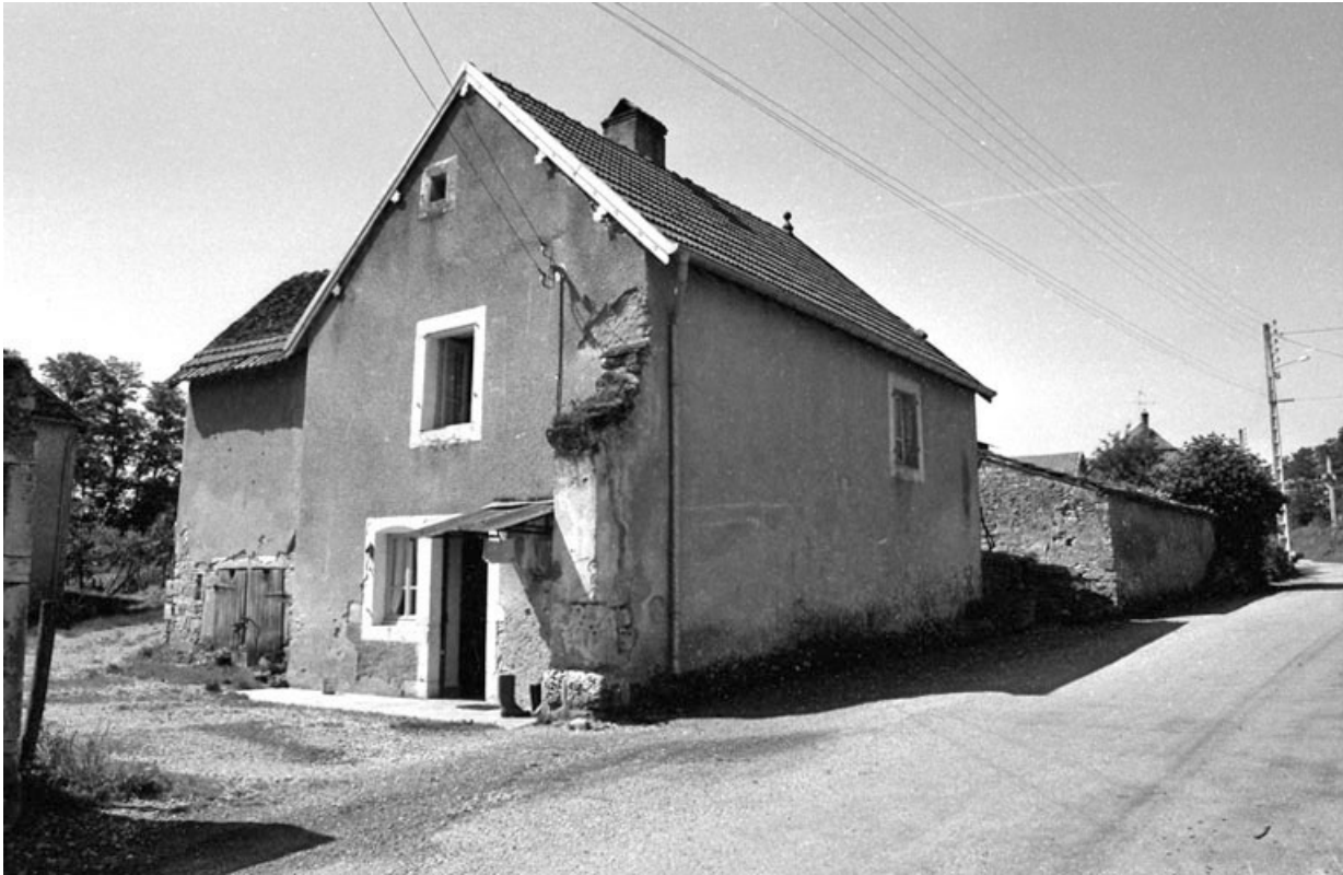
Logement indépendant à l'entrée de la cour.