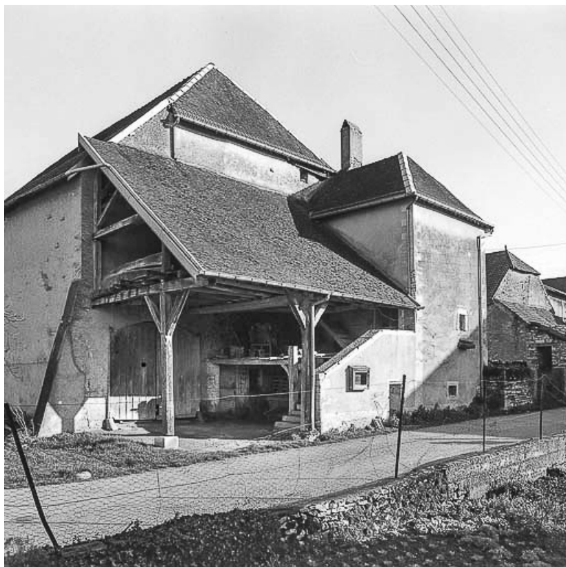
Détail : auvent et escalier extérieurs en 1984.