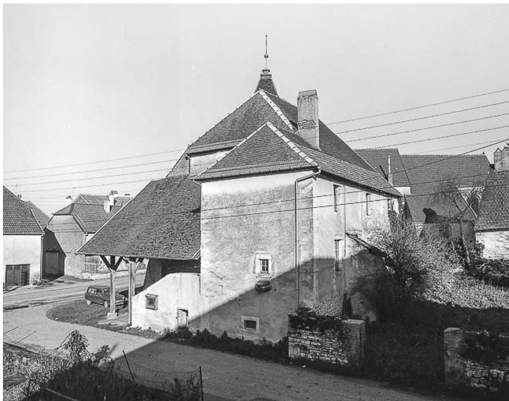
Façades postérieure et latérale droite en 1984.