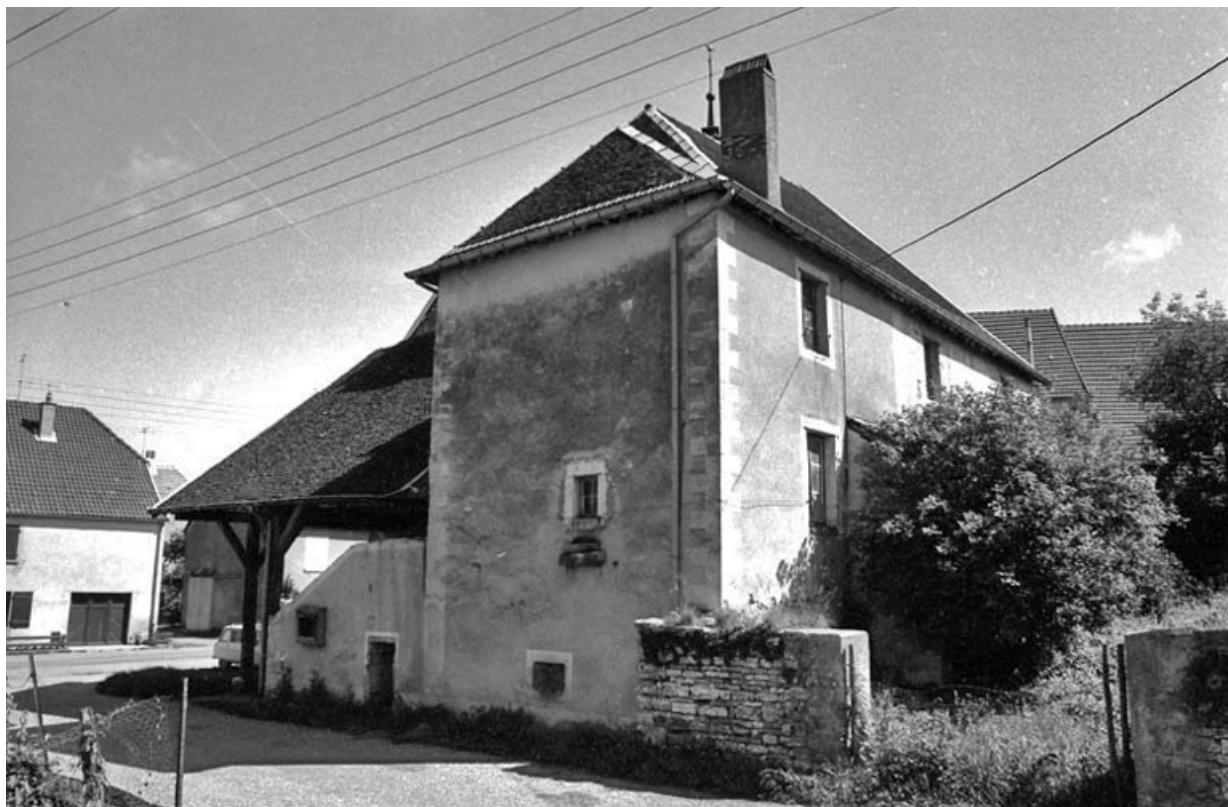
Façade postérieure en 1981.