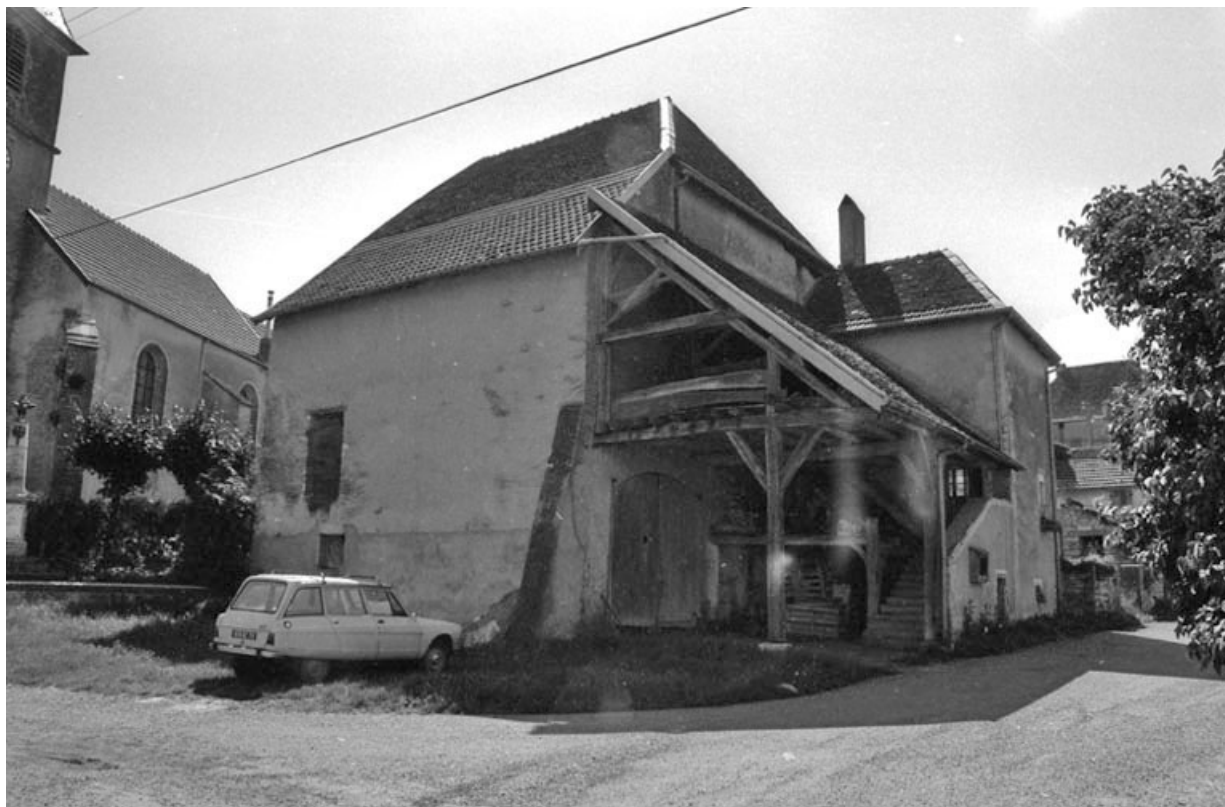
Vue d'ensemble depuis la Grande Rue en 1981.