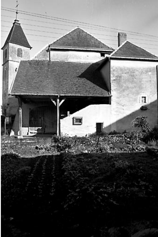
Façade latérale droite en 1984.