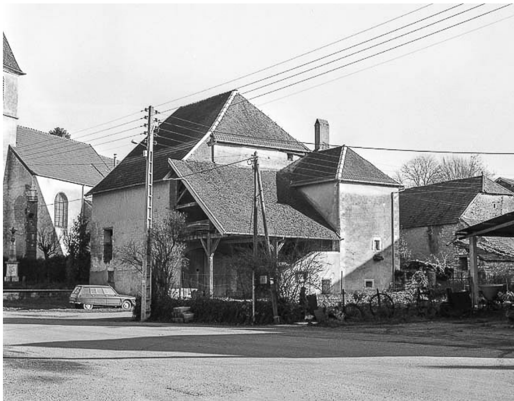
Vue d'ensemble depuis la Grande Rue en 1984.