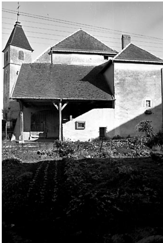
Façade latérale droite en 1984.