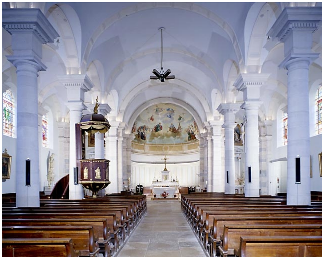
Vue de la nef et du chœur depuis l'entrée.