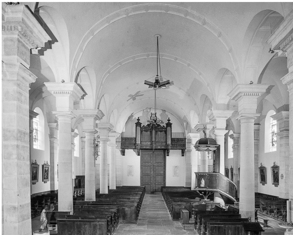
Vue de la nef depuis le chœur.