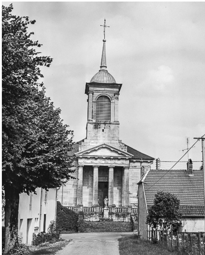
Façade antérieure et clocher.