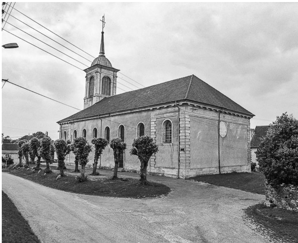
Façade postérieure et latérale droite.