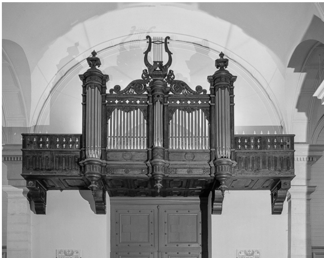
Orgue fictif au-dessus de l'entrée de la nef.