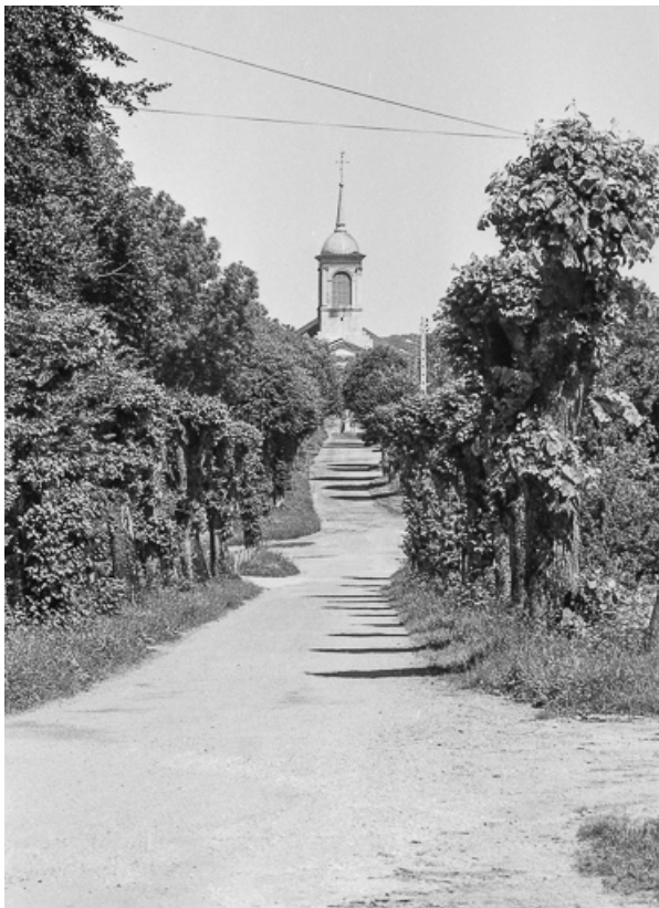
Vue depuis le chemin de la gare. 70, Valay rue du Général de Gaulle