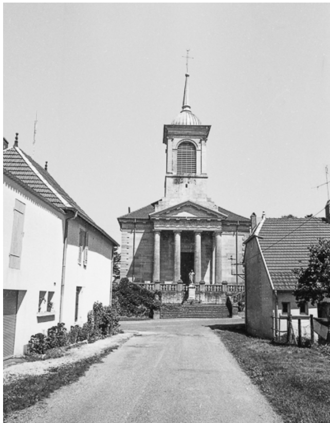
Façade antérieure vue de face.