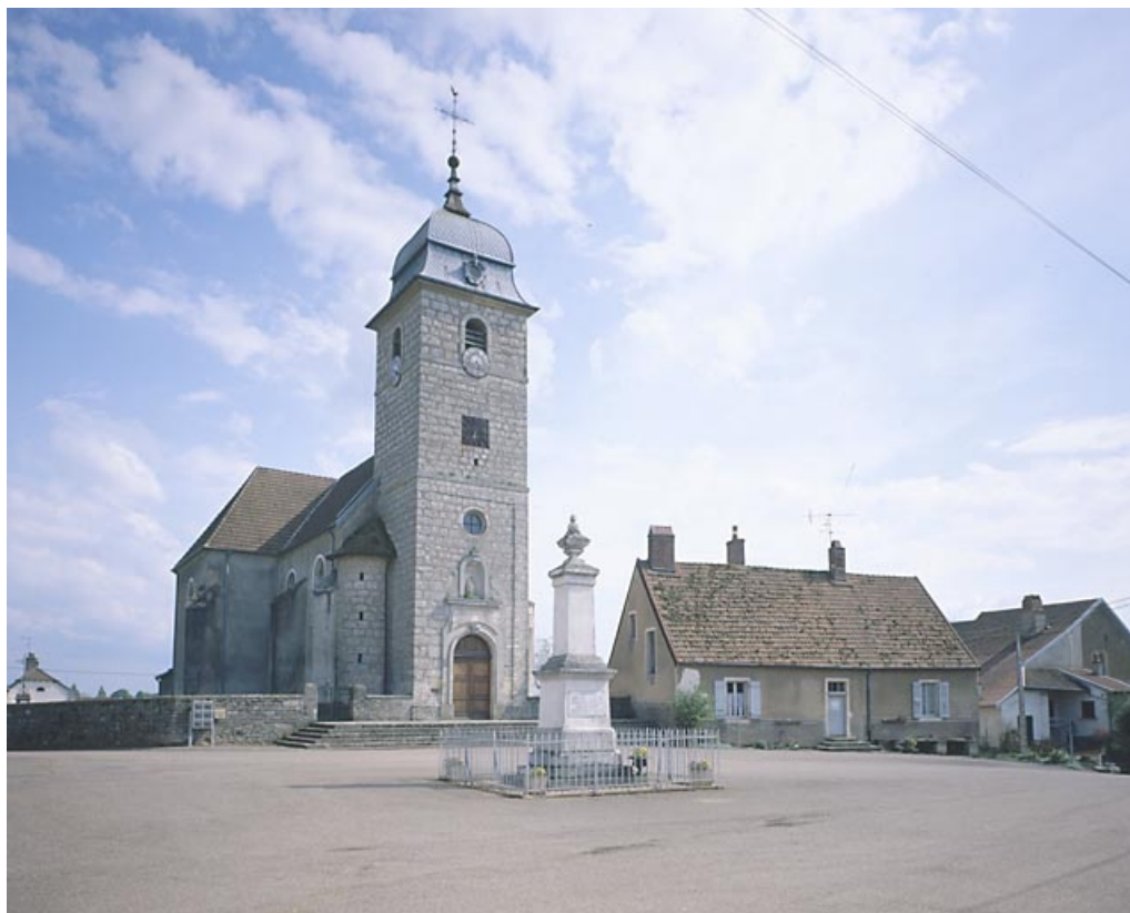
Vue d'ensemble depuis la place.