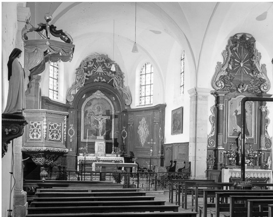
Choeur et bras du transept droit.