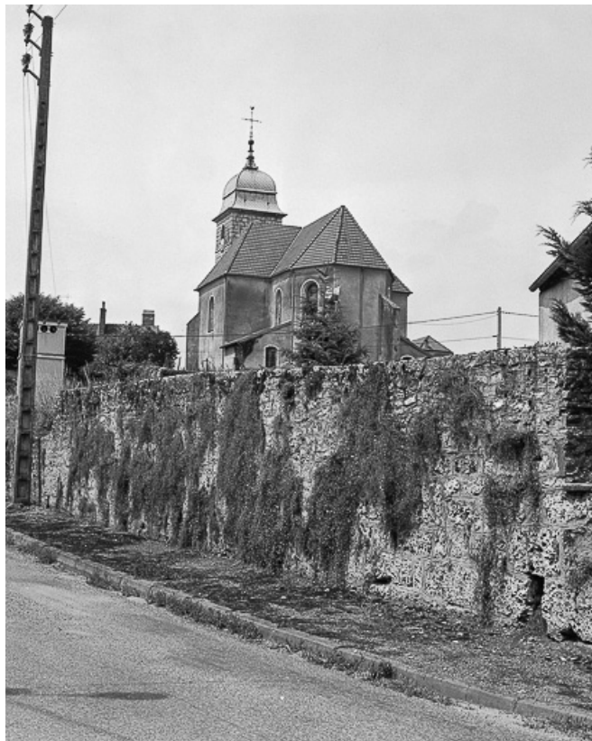
Chevet et façade latérale droite.