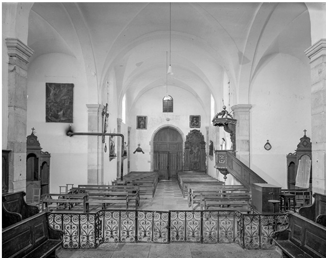
Nef et bras du transept depuis le chœur.