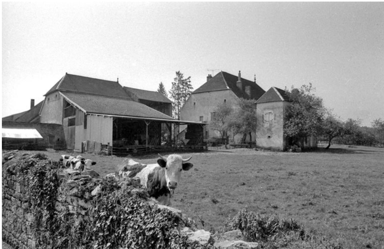
Vue d'ensemble depuis la rue des Baraques.