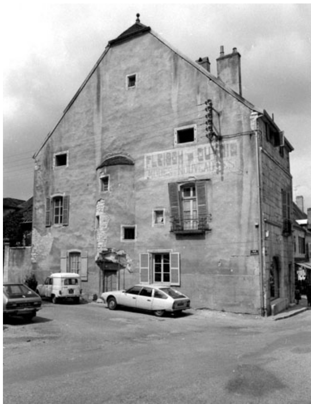
Façade donnant sur la place des Promenades.