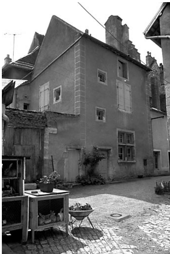
Habitation sur cour située à l'arrière du n° 29. 70, Pesmes Grande Rue à l'arrière du n° 29