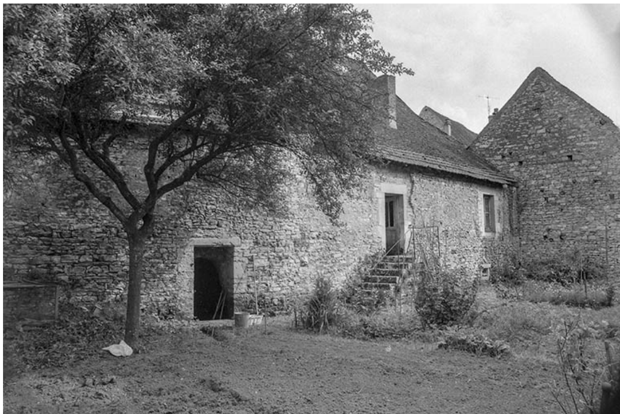
Dépendance au fond du jardin.