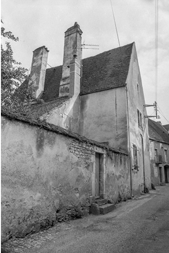
Vue de trois quarts gauche depuis la rue.