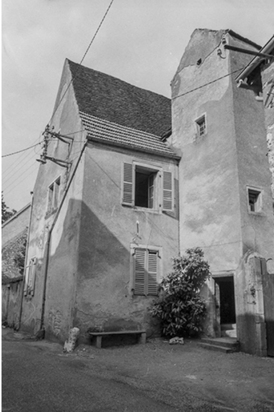
Vue de trois quarts droit depuis la rue. 70, Pesmes