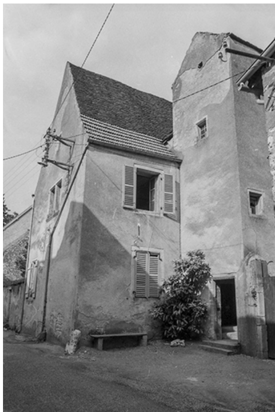
Vue de trois quarts droit depuis la rue. 70, Pesmes