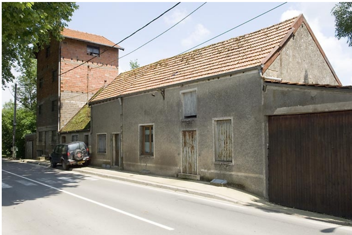
Atelier de fabrication et logement. 70, Pesmes route de Dole