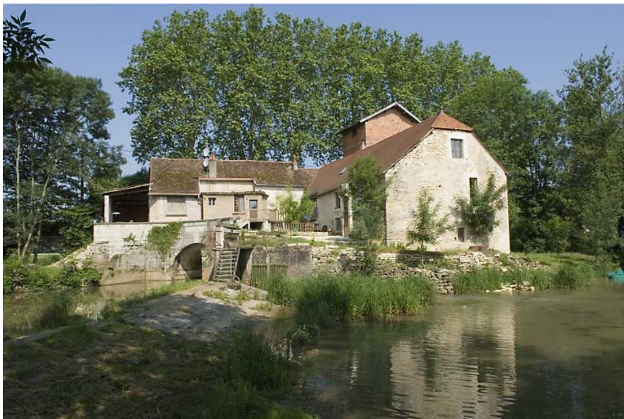
Vue d'ensemble depuis le barrage.