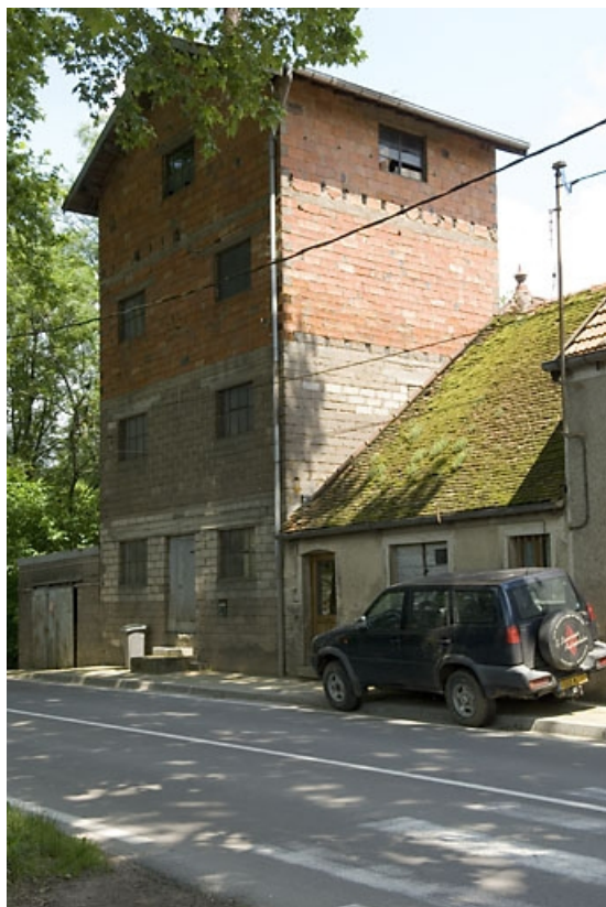
Atelier de fabrication (céréales secondaires). 70, Pesmes route de Dole