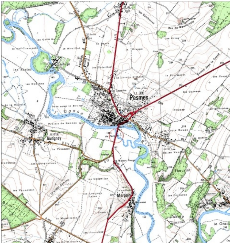
Carte de localisation. Carte topographique au 1:25000, I.G.N., Gendrey, 3223 E. SCAN 25, Licence n°2008CISE29-68. 70, Pesmes route de Dole