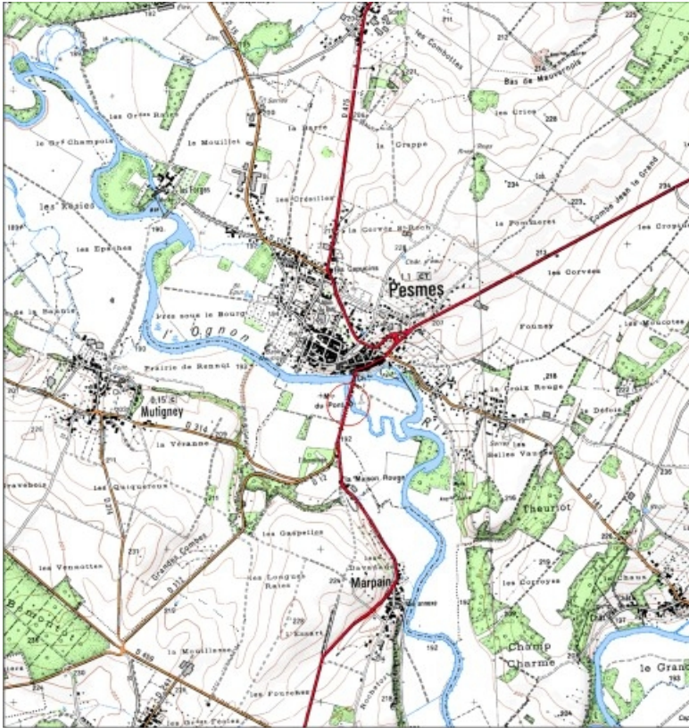
Carte de localisation. Carte topographique au 1:25000, I.G.N., Gendrey, 3223 E. SCAN 25, Licence n°2008CISE29-68. 70, Pesmes route de Dole