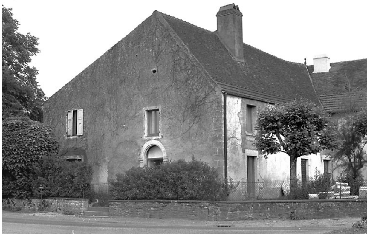
Façade sur rue.