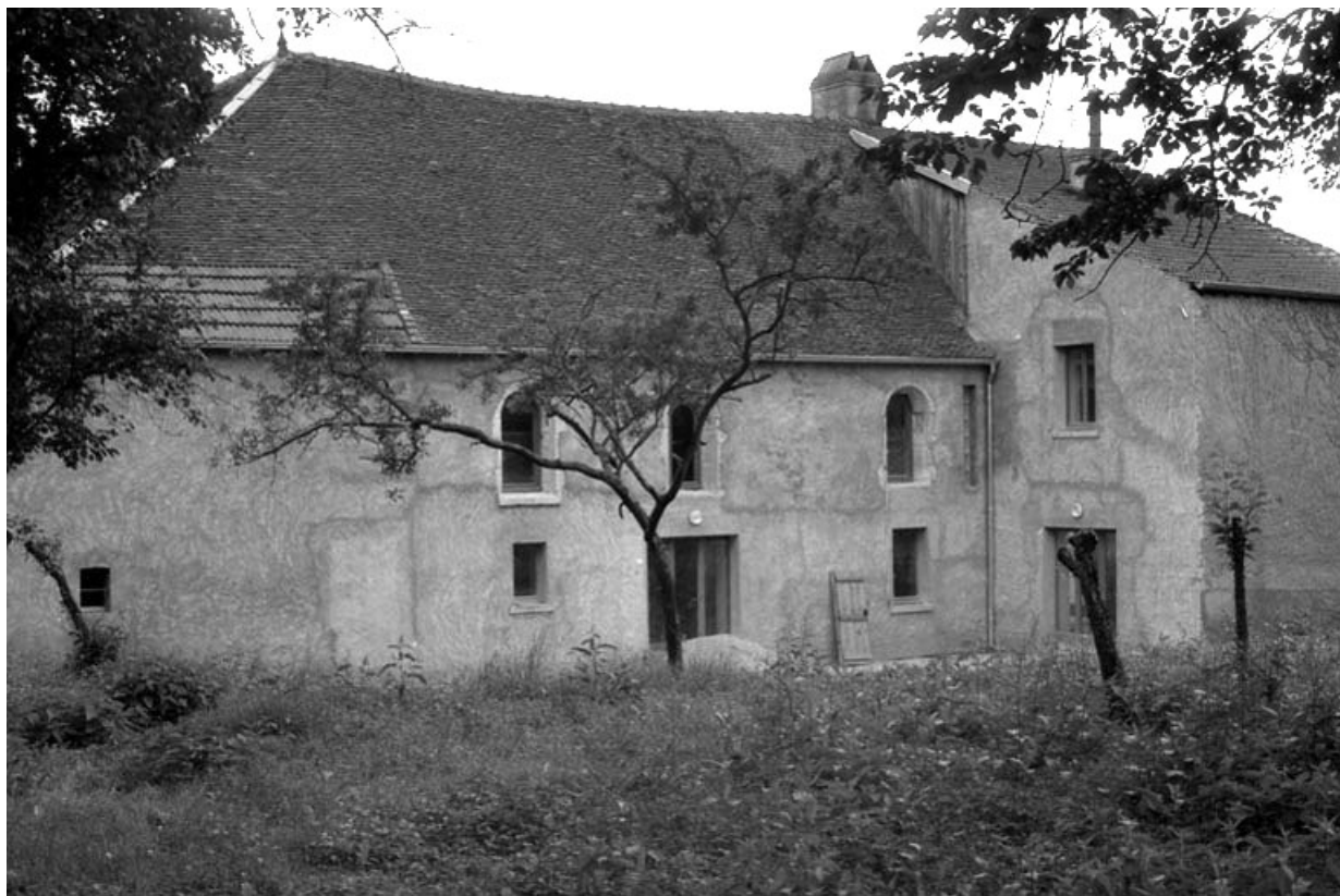
Façade latérale gauche.