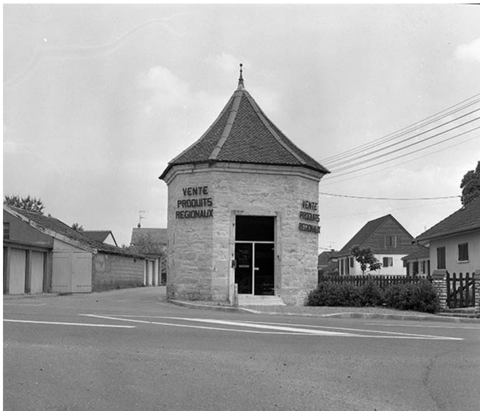
Tourelle gauche à l'entrée de l'ancien jardin du château.