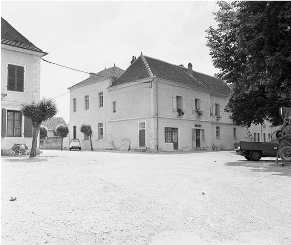
Bâtiment droit à l'entrée de l'ancienne cour d'honneur actuellement école 70, Pesmes place des Promenades