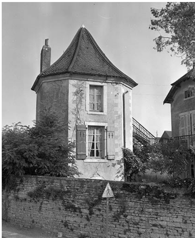
Tourelle droite à l'entrée de l'ancien jardin du château.