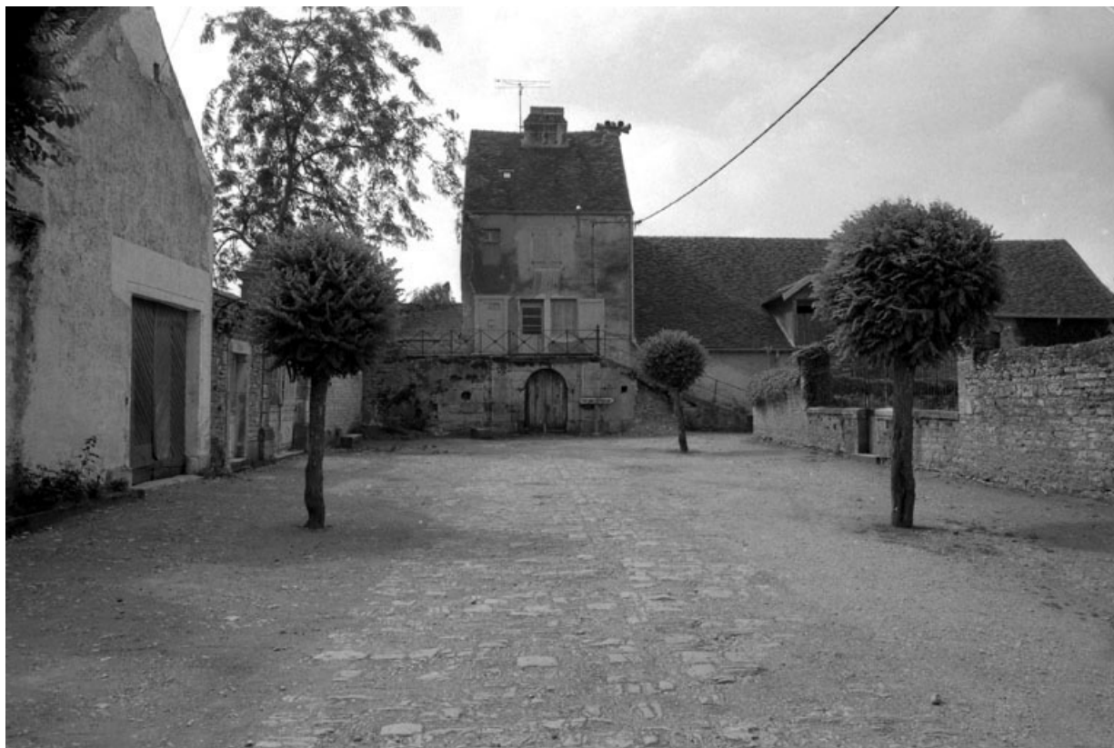
Partie centrale du château depuis la place des promenades.