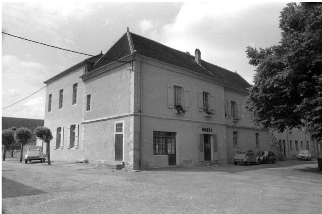
Vue du pavillon droit, actuellement école.