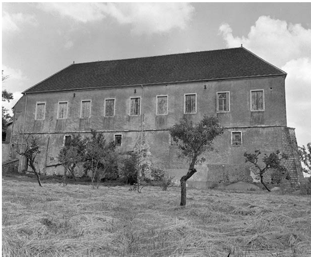
Les communs : façades postérieures.