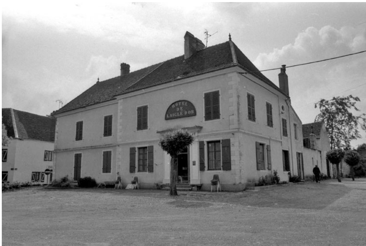
Bâtiment gauche à l'entrée de l'ancienne cour d'honneur actuellement hôtel. 70, Pesmes place des Promenades