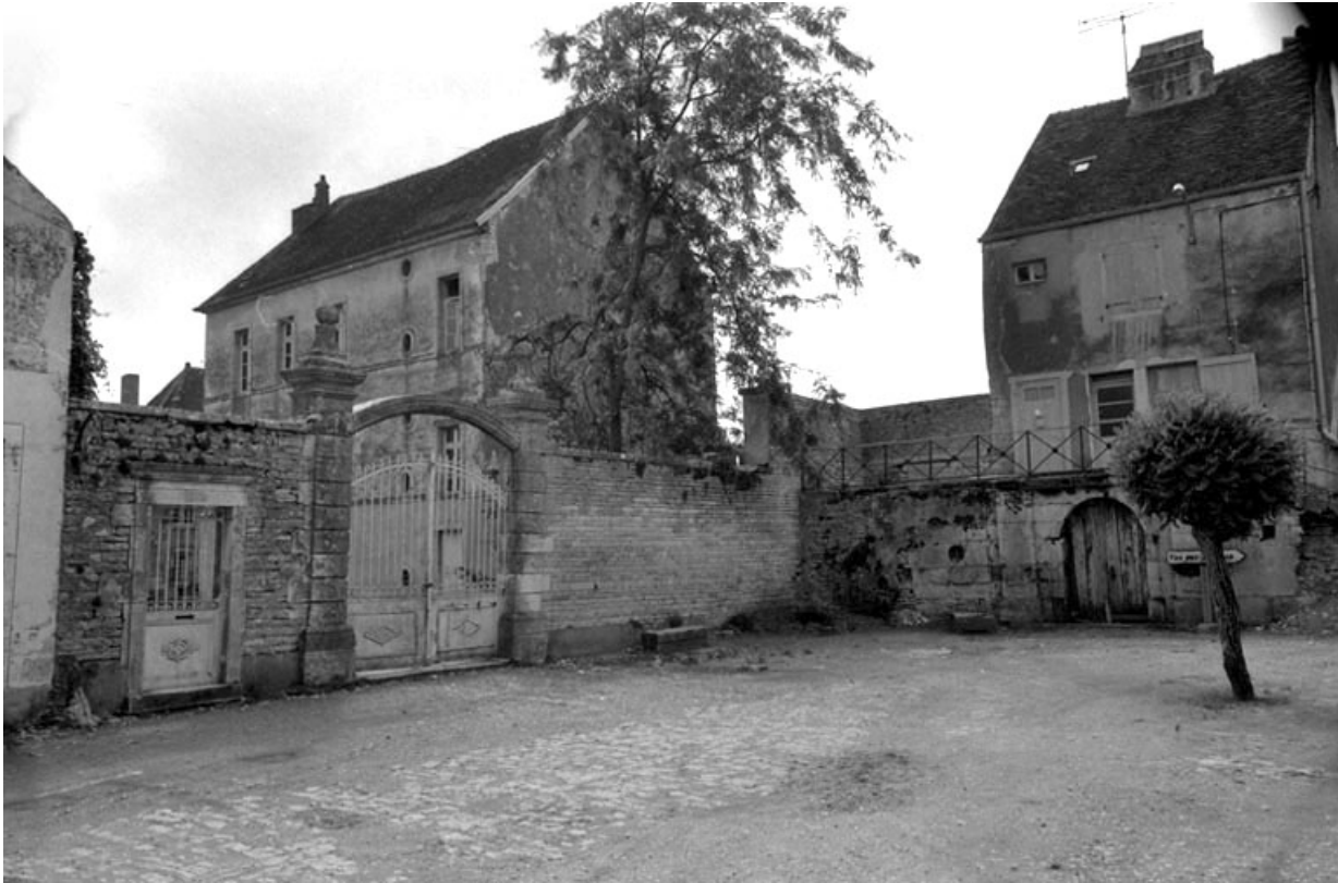
Partie gauche du château, côté place des promenades.