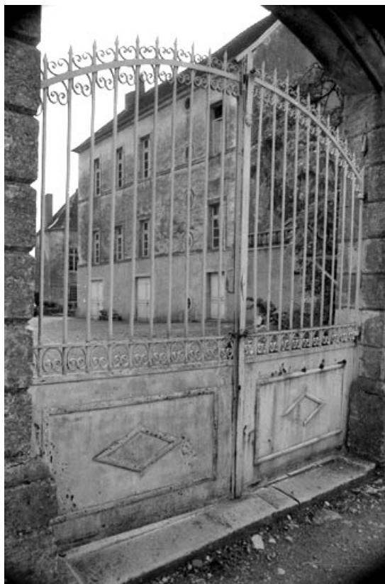
Vue depuis le portail.