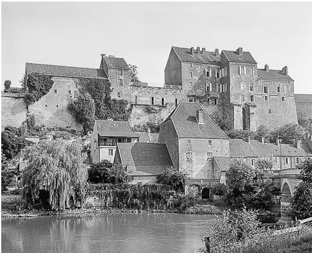
Parties centrale et gauche du château depuis l'Ognon.