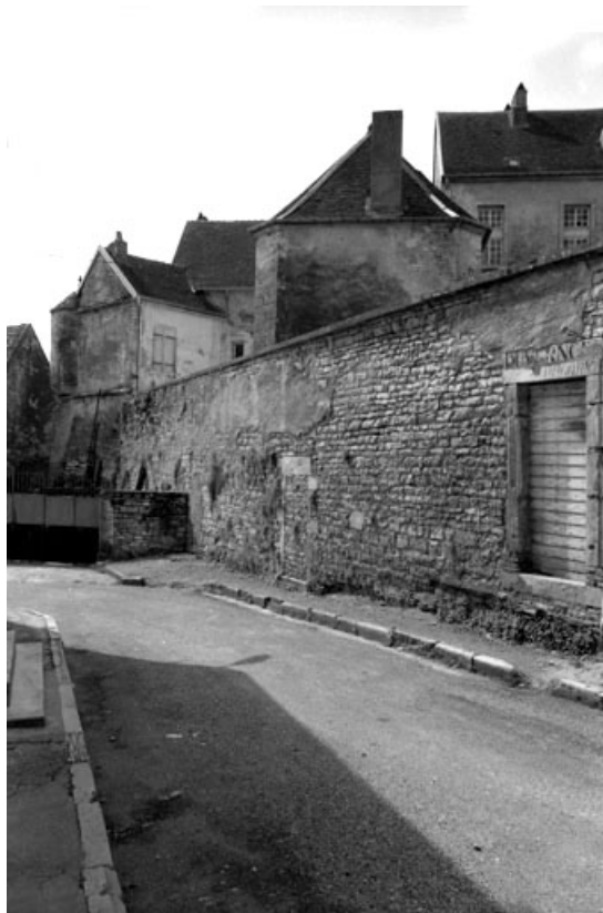
Vue du château depuis la rue du Donjon.