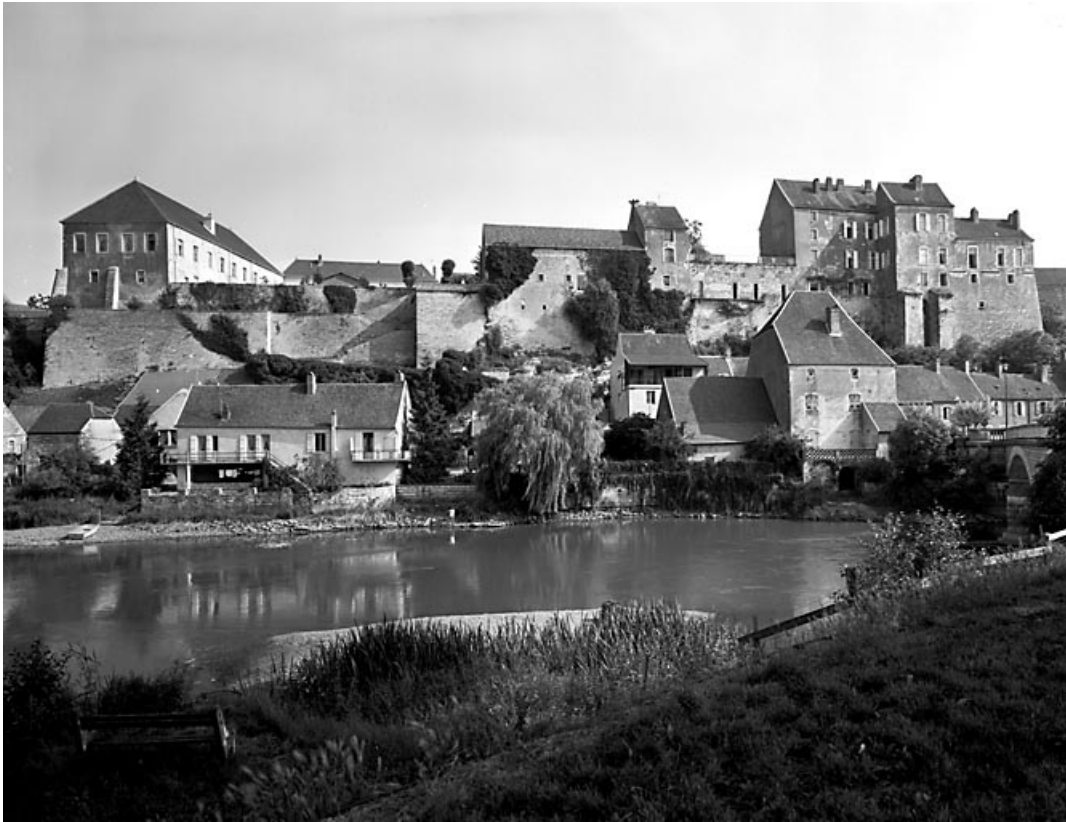
Vue du château depuis l'Ognon.