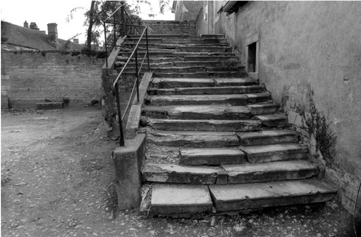
Reste du perron de la partie centrale du château. 70, Pesmes place des Promenades