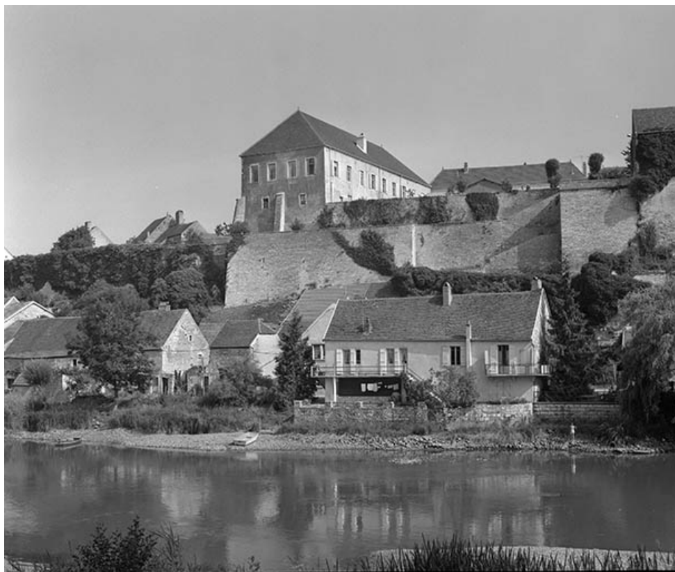
Partie droite du château-fort donnant sur l'Ognon.