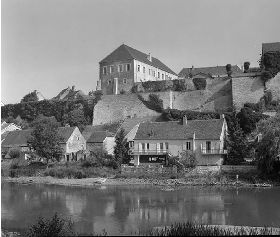
Partie droite du château-fort donnant sur l'Ognon.