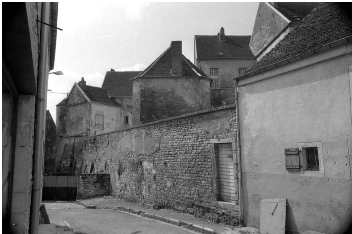
Vue du château depuis la ruelle du donjon.