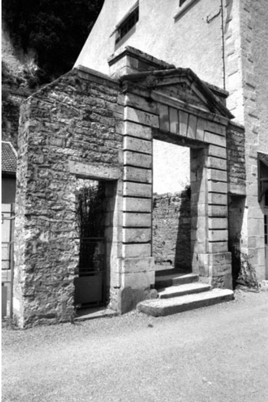
Sortie rue de la Roche.