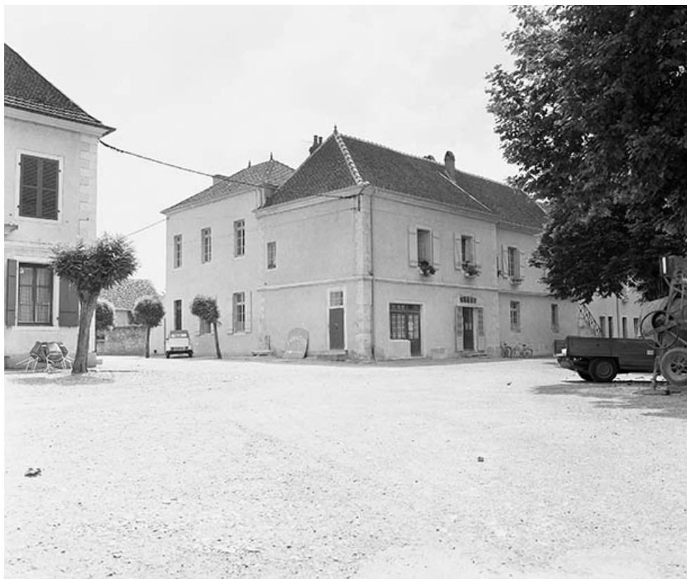
Bâtiment droit à l'entrée de l'ancienne cour d'honneur actuellement école 70, Pesmes place des Promenades