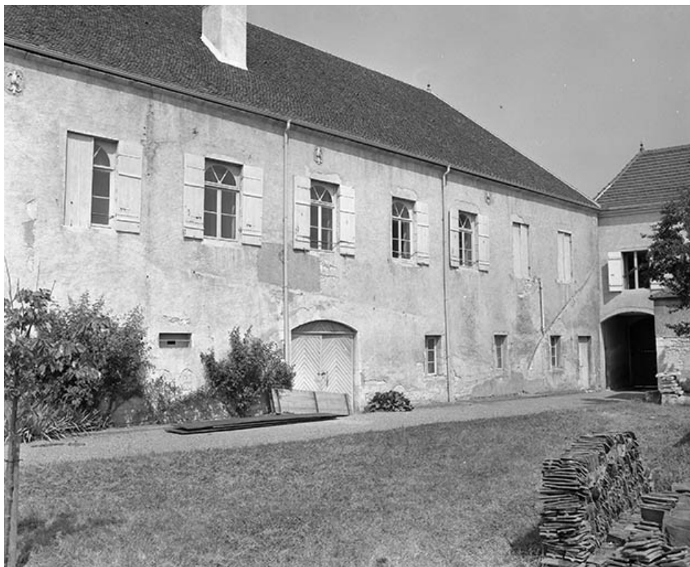
Les communs : façades antérieures.