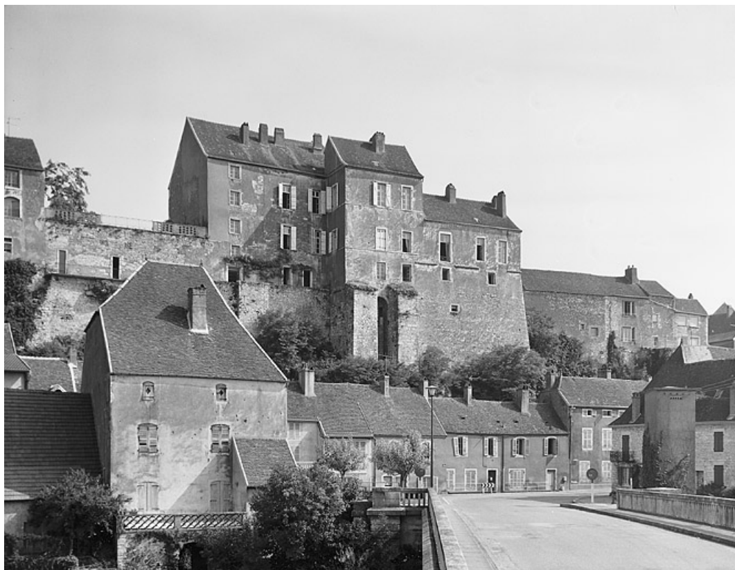
Partie gauche du château depuis l'Ognon.