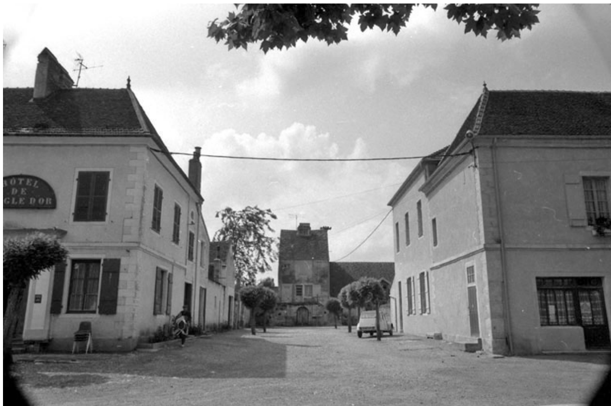
Bâtiments droit et gauche à l'entrée de l'ancienne cour d'honneur.