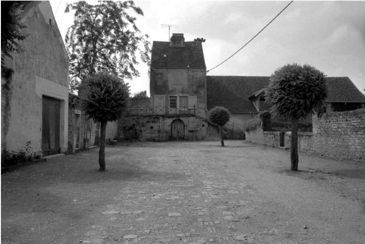
Partie centrale du château depuis la place des promenades.