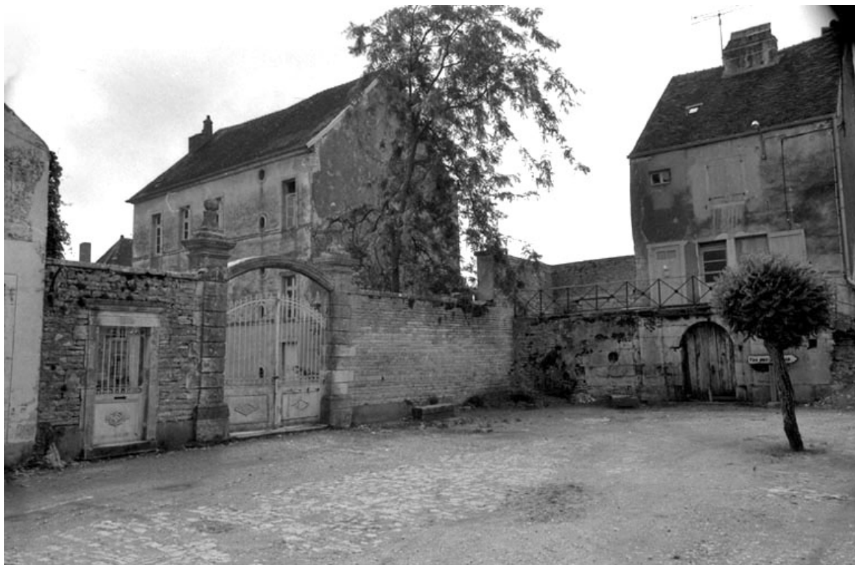
Partie gauche du château, côté place des promenades.