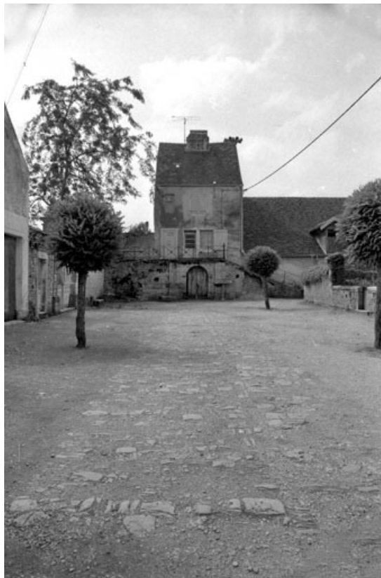
Partie centrale du château vue depuis la place des Promenades