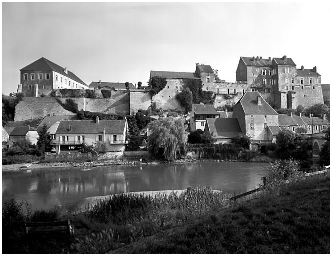
Vue du château depuis l'Ognon.