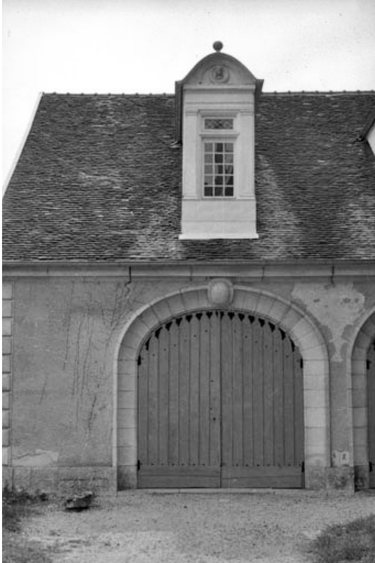
Les remises : détail d'une porte.