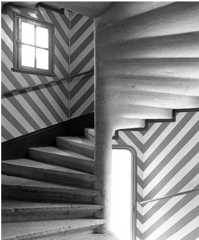
Intérieur : détail de la tour d'escalier. 70, Malans rue des Châteaux