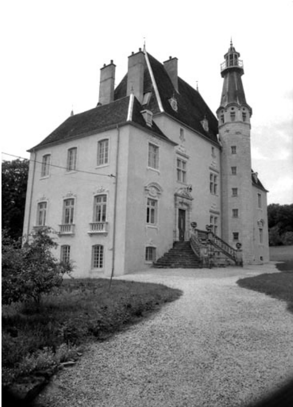
Vue d'ensemble depuis le portail d'entrée.