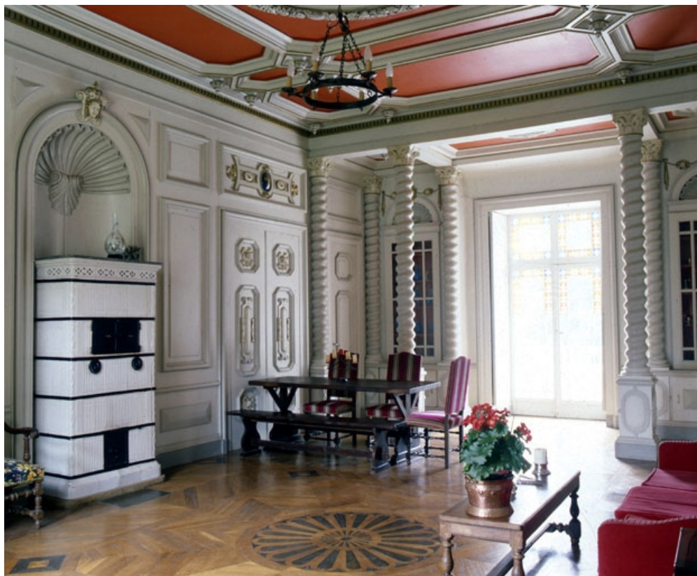
Intérieur : le hall.