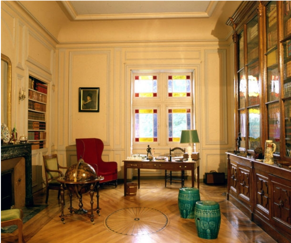
Intérieur : la bibliothèque.