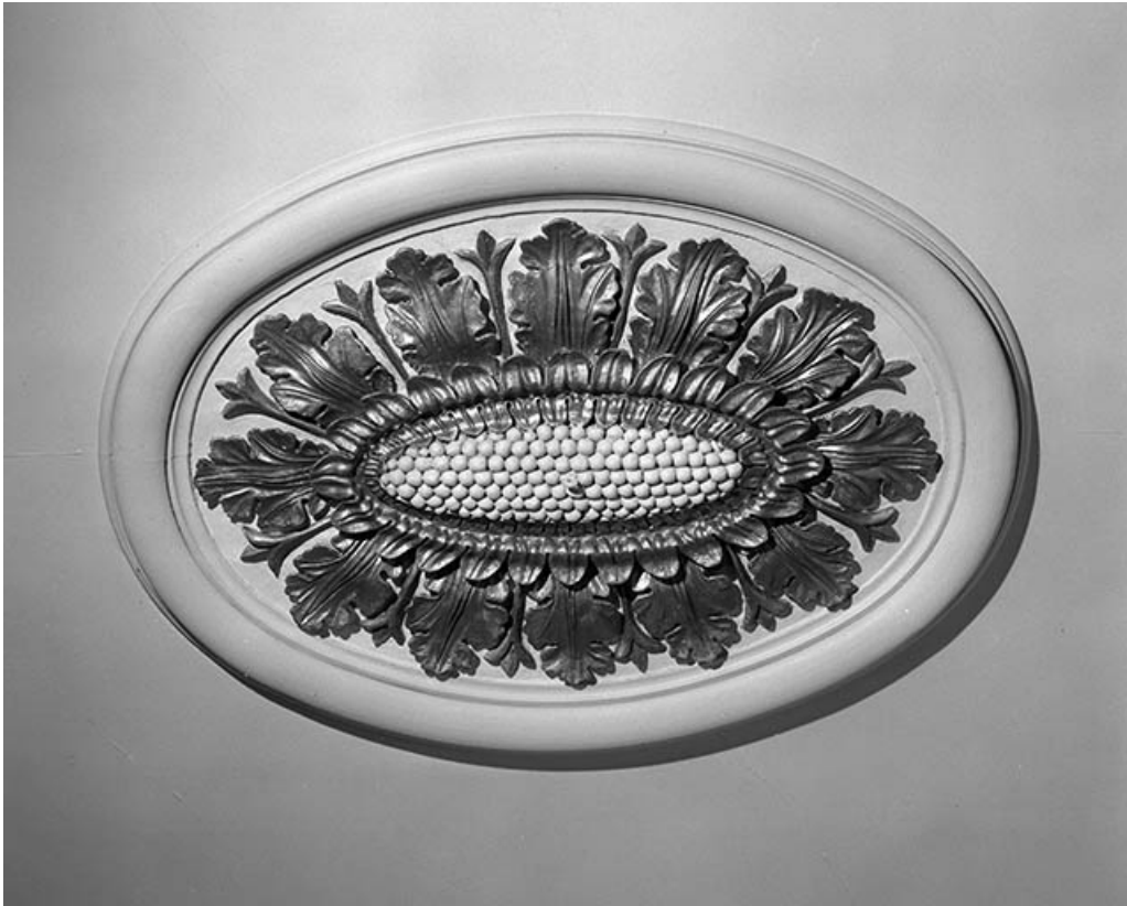
Intérieur : détail du plafond de la bibliothèque.