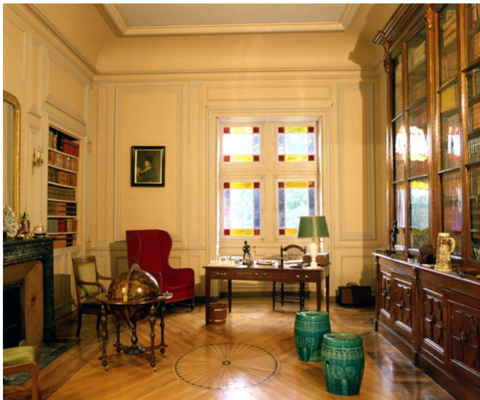
Intérieur : la bibliothèque.