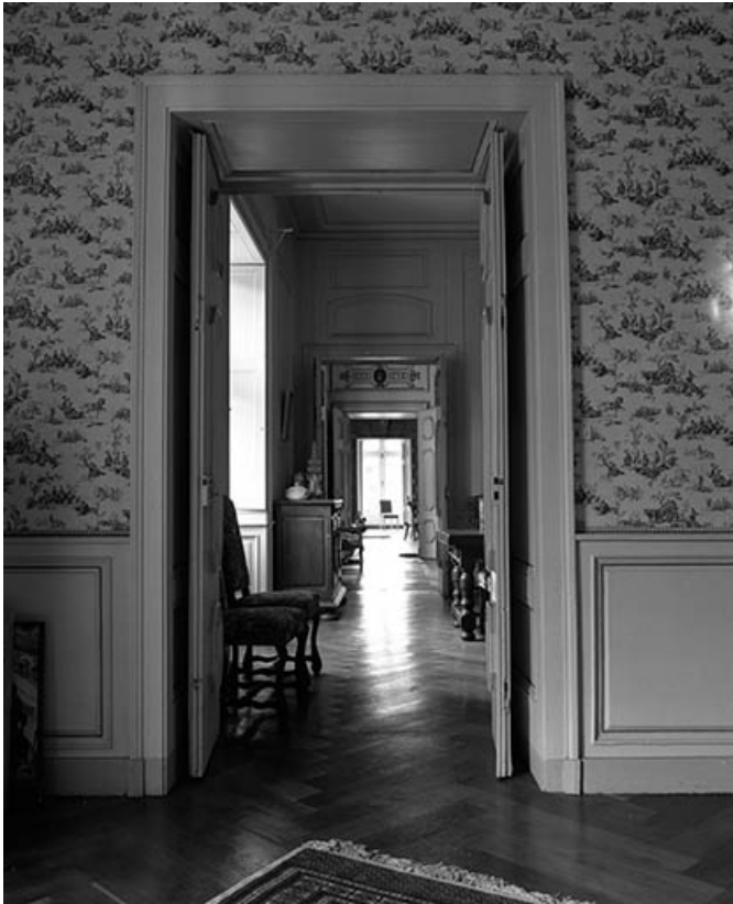
Intérieur : le couloir de la salle à manger du salon. 70, Malans rue des Châteaux