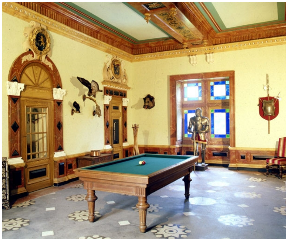
Intérieur : la salle d'armes.