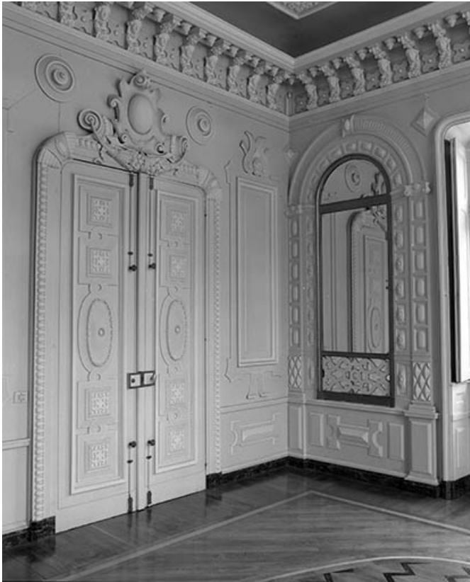
Intérieur : détail de la porte du salon. 70, Malans rue des Châteaux