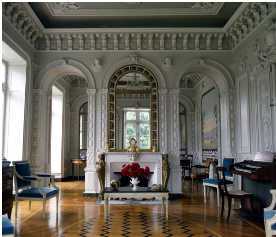
Intérieur : le salon.