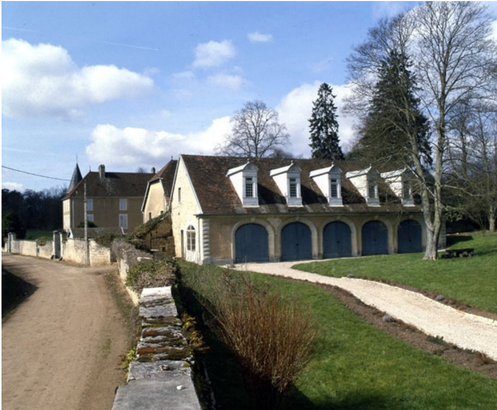
Les écuries vues depuis la rue.