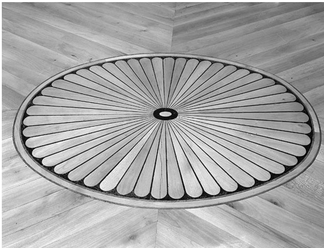
Intérieur : détail du plancher de la bibliothèque.