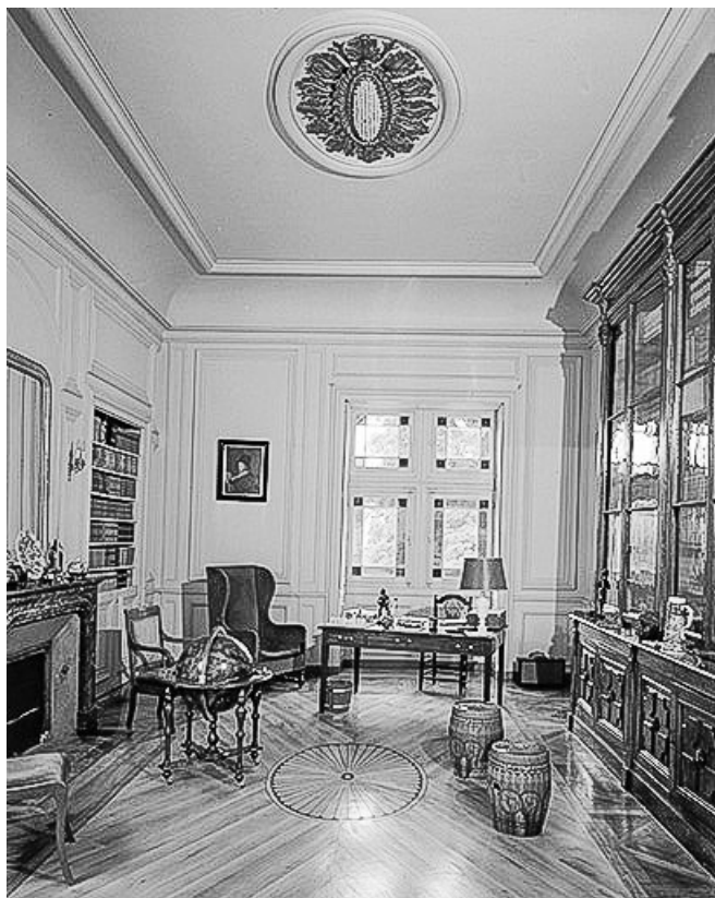
Intérieur : la bibliothèque.