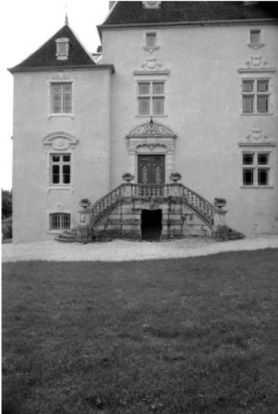
Détail : le perron sur façade antérieure.