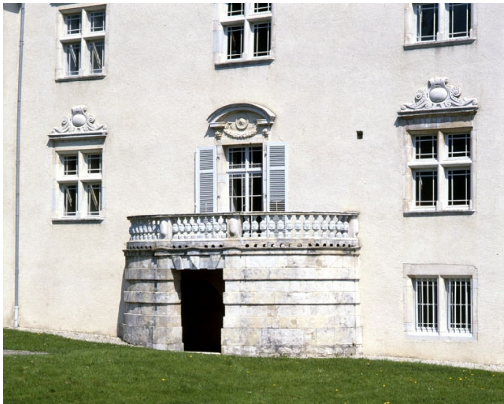
Détail : balcon façade postérieure.