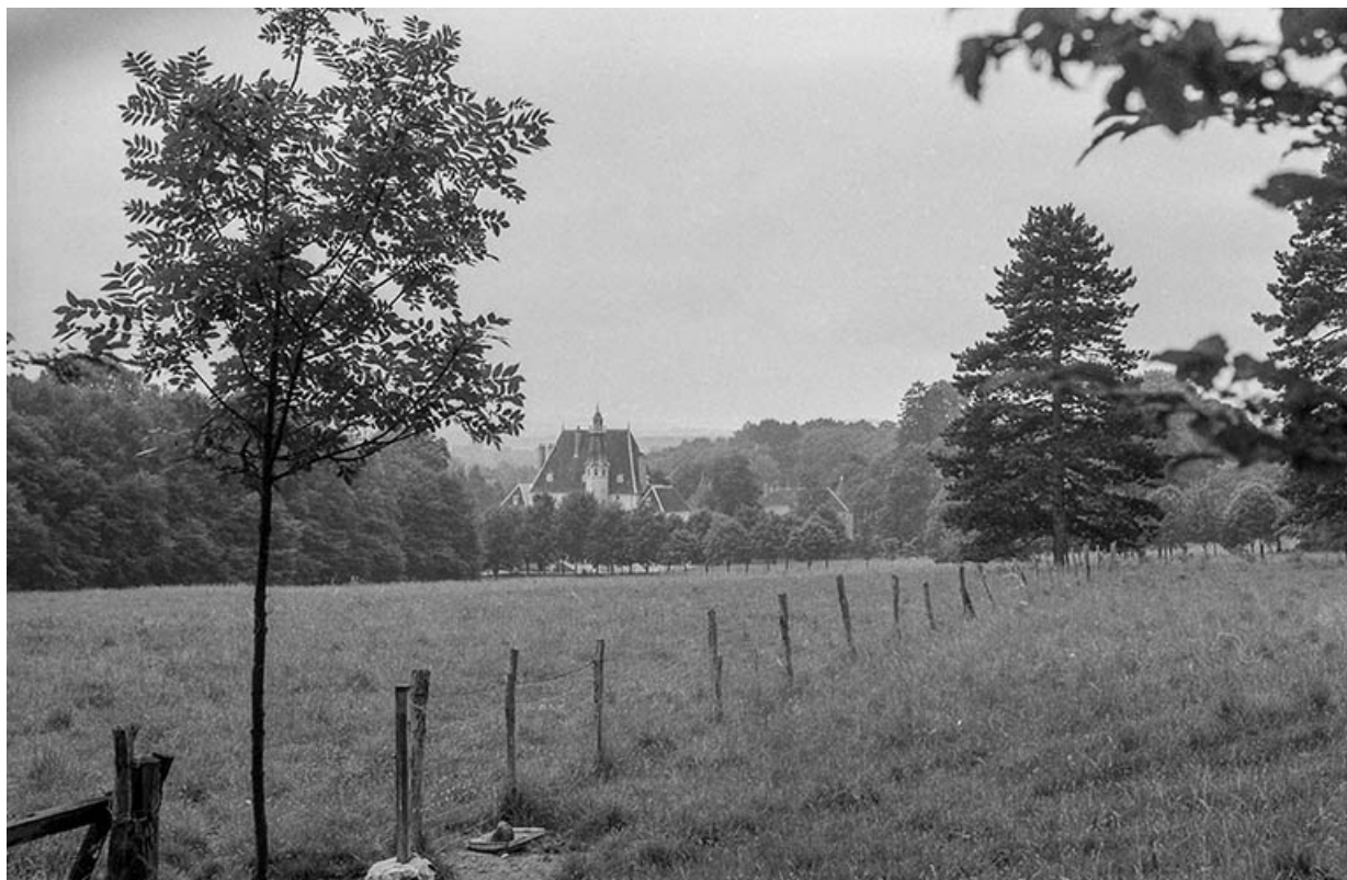
Vue depuis la route de Pesmes.