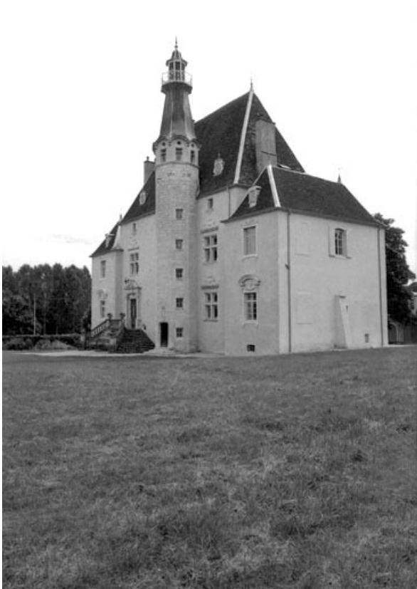
La façade antérieure depuis le parc.