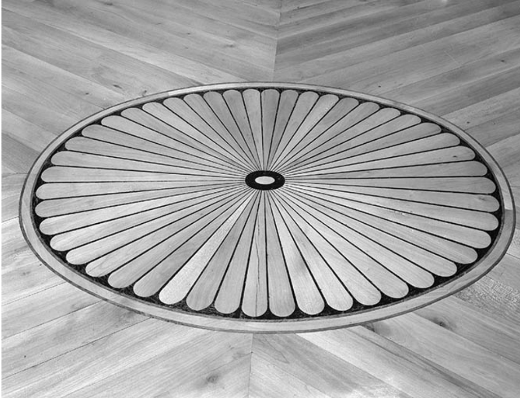
Intérieur : détail du plancher de la bibliothèque. 70, Malans rue des Châteaux