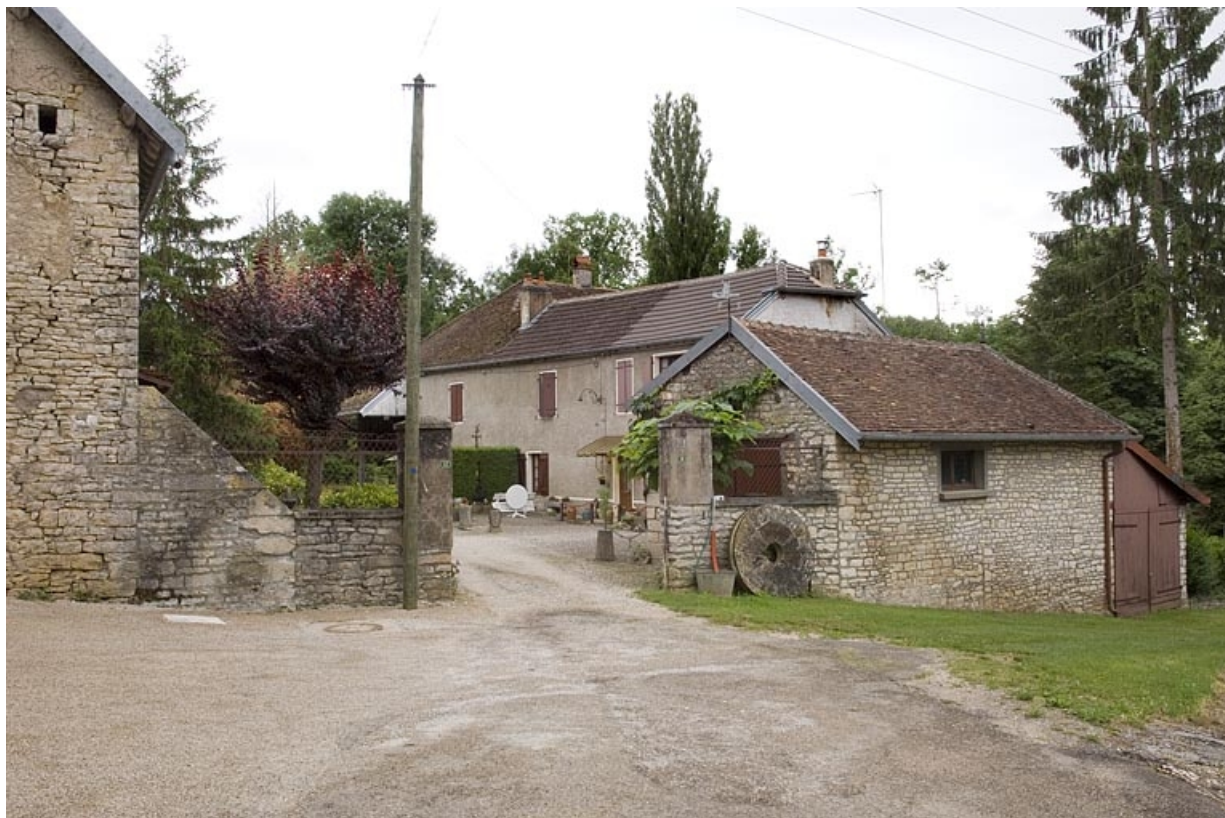
Vue d'ensemble depuis la rue.