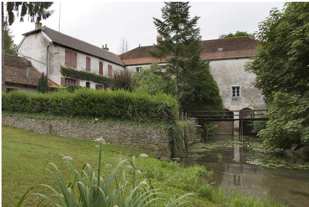
Vue d'ensemble depuis le bief, en aval.