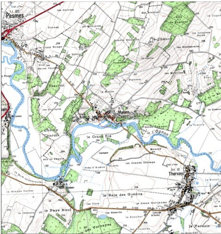
Carte de localisation. Carte topographique au 1:25000, I.G.N., Gendrey, 3223 E. 70, Malans, 10 rue du Moulin