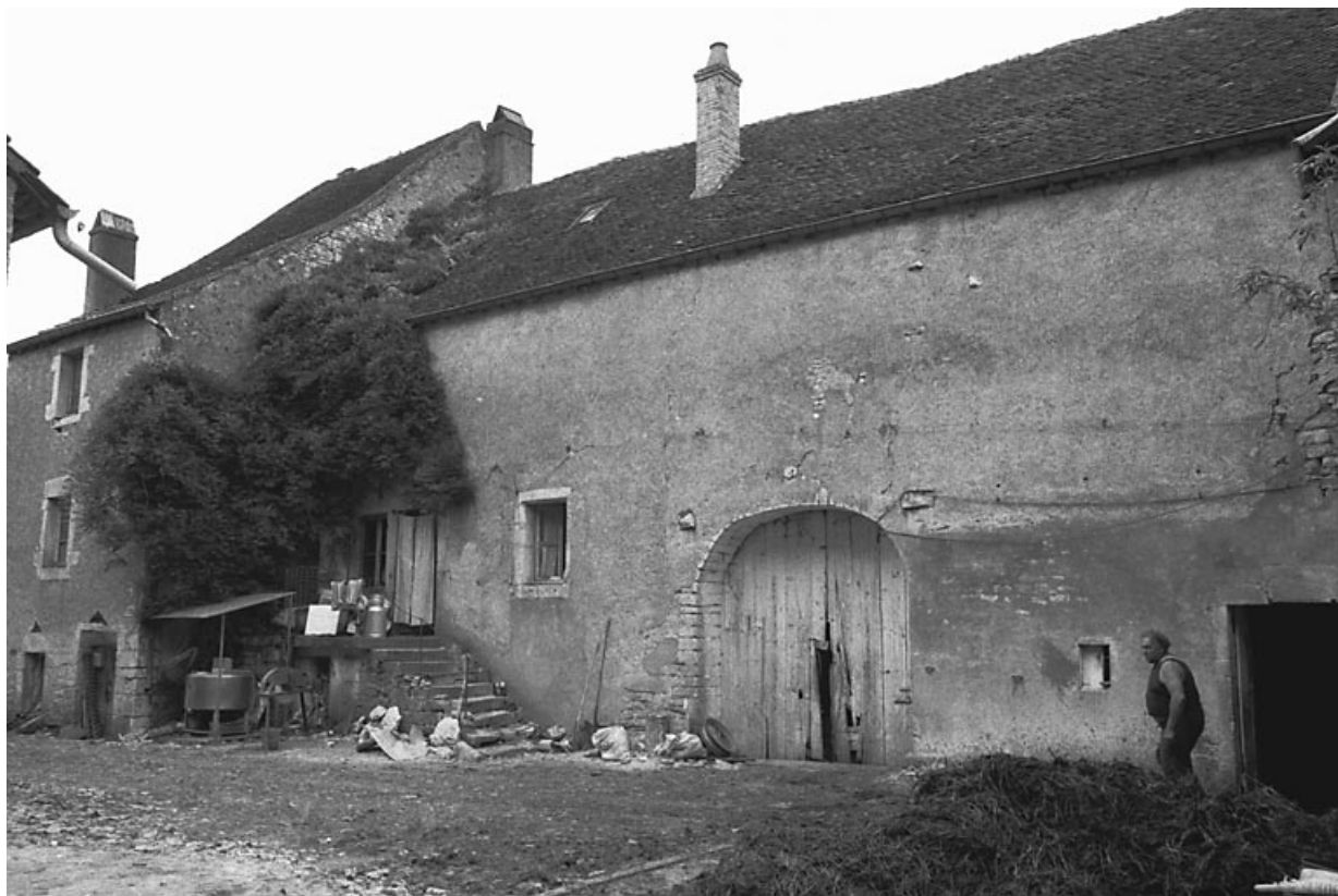
Vue des parties agricoles.