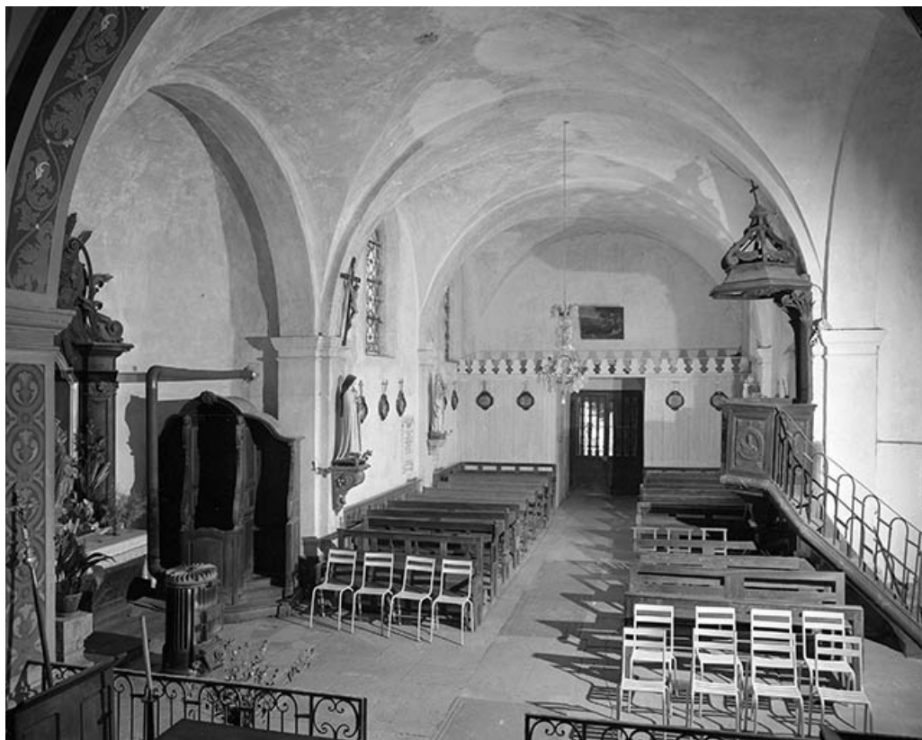
Intérieur : nef et transept vus depuis le chœur.