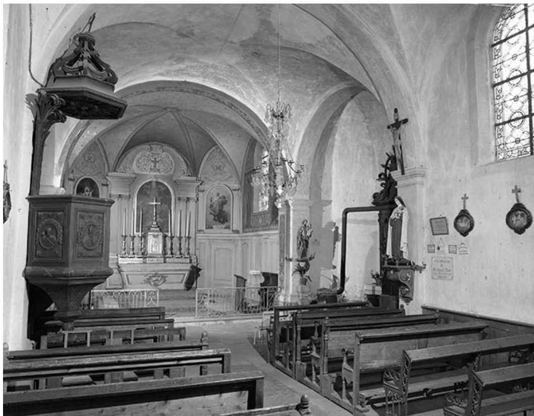
Intérieur : chœur vu depuis la nef.