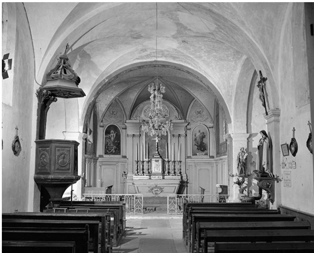
Intérieur : nef et choeur vus depuis l'entrée.