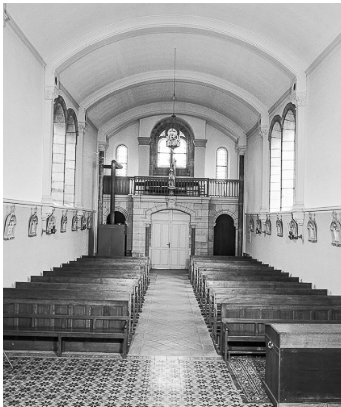
Nef vue depuis le chœur.