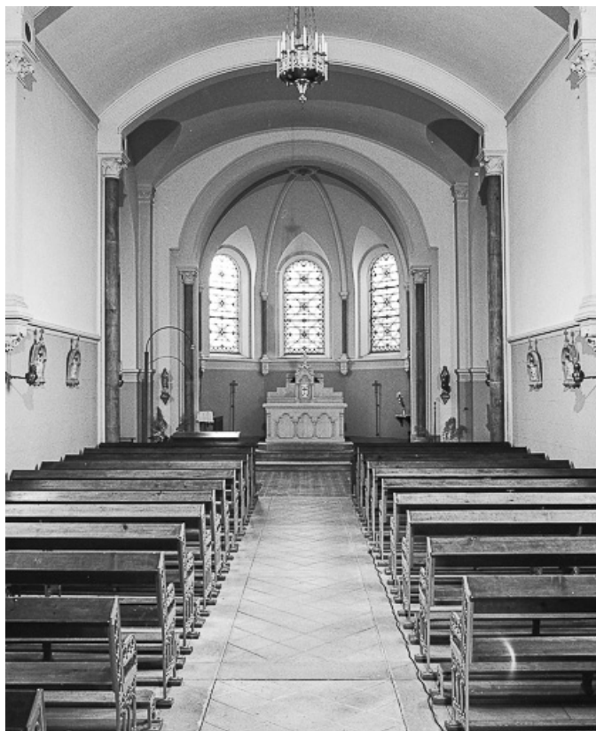
Nef et chœur vus depuis l'entrée.