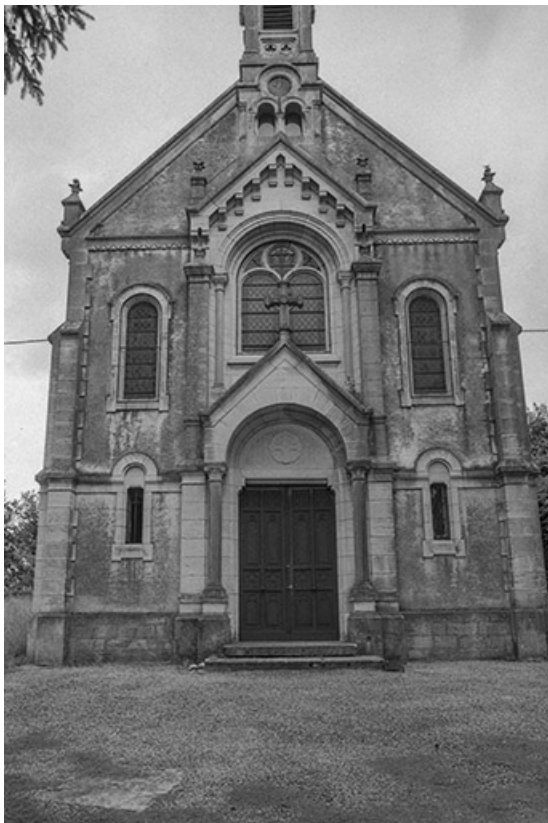
Façade antérieure : vue rapprochée.