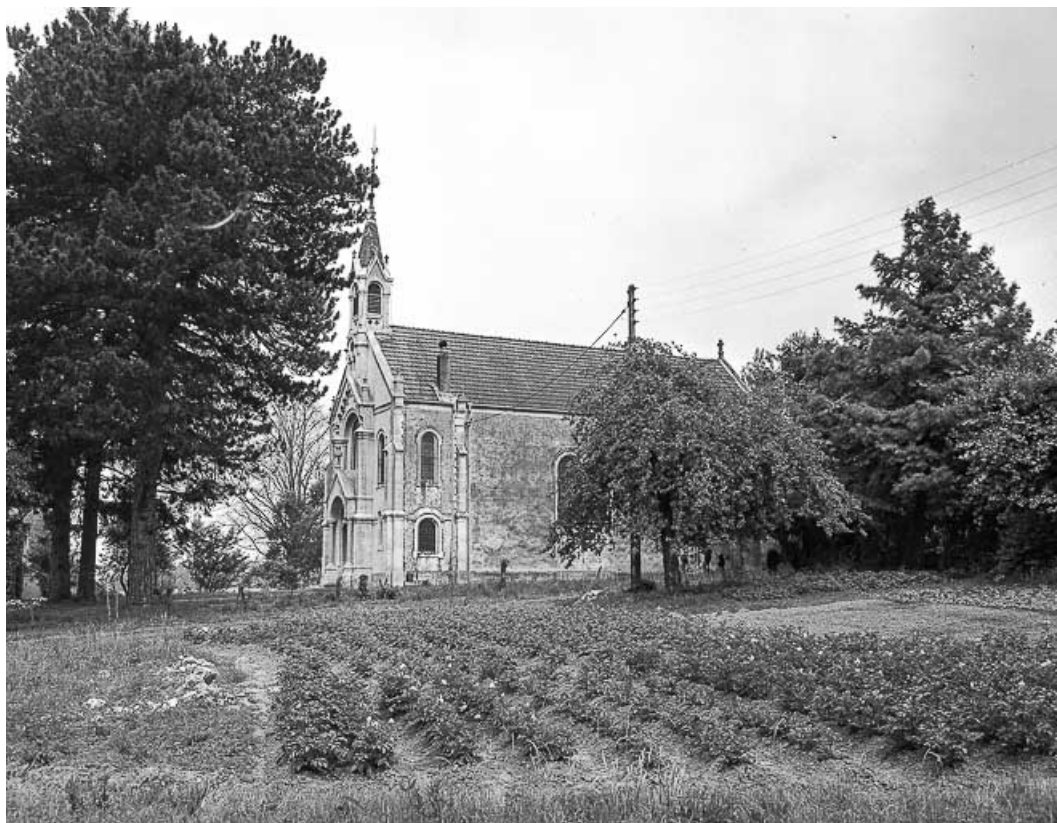
Vue de trois quarts droit.