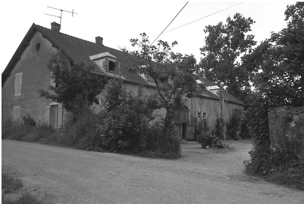
Vue de trois quarts gauche de l'habitation.

70, La Grande-Résie, lieudit : les Baraques