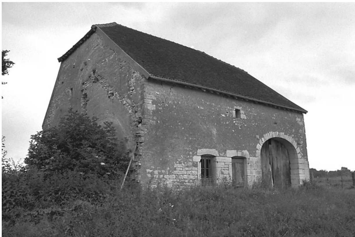
Vue d'ensemble de trois quarts gauche.

70, La Grande-Résie route d' Aubigny, lieudit : les Baraques