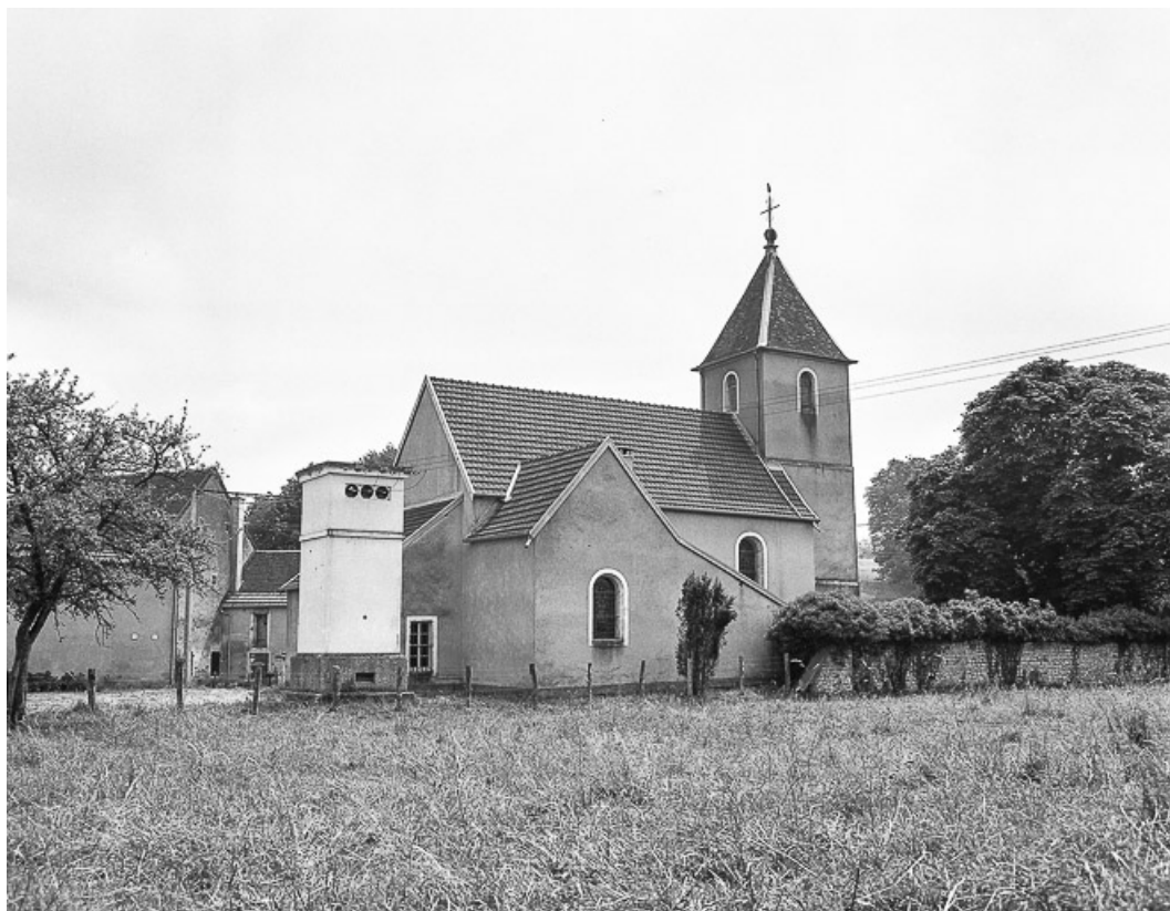
Façade latérale gauche. 70, Chevigny