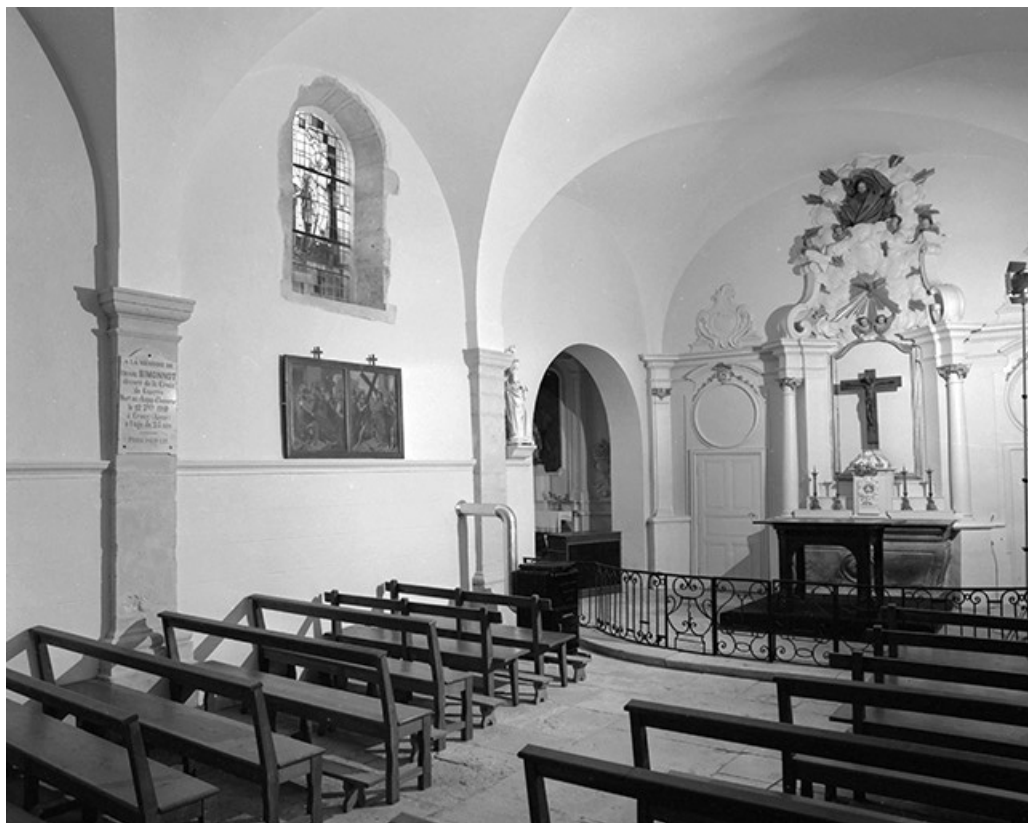
Nef et chœur vus depuis l'entrée.