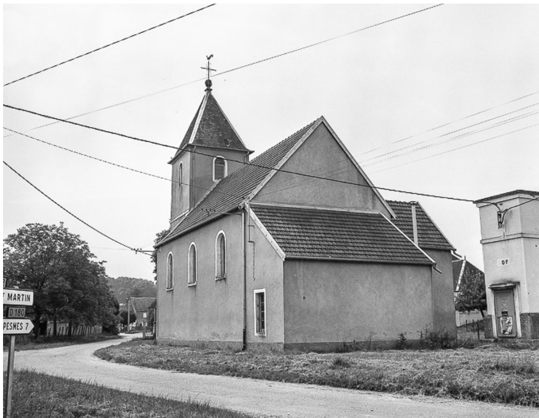
Façade postérieure et latérale droite. 70, Chevigny