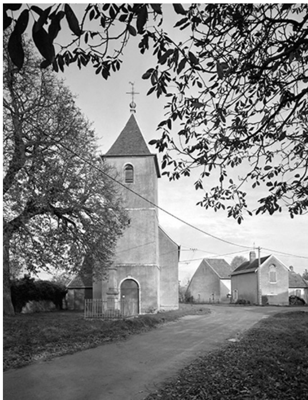
Vue de la façade antérieure avec la tour clocher. 70, Chevigny