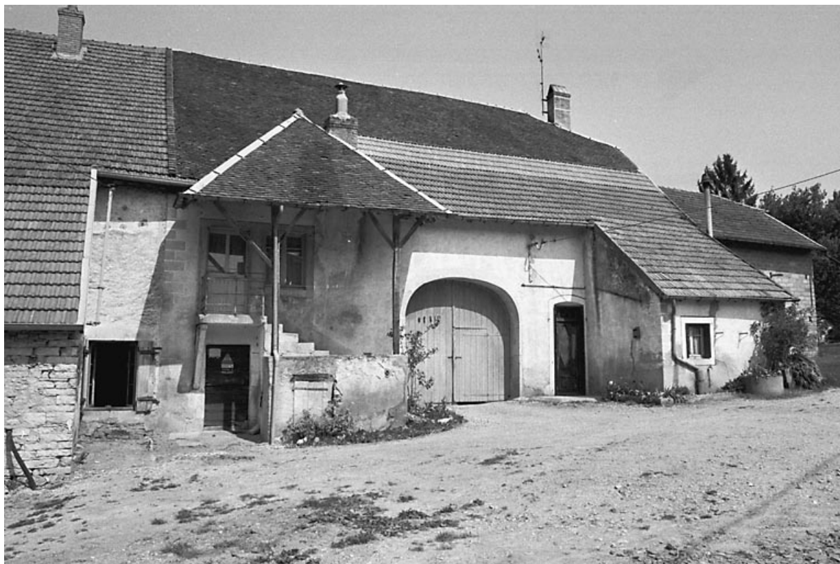
Façade antérieure : vue rapprochée. 70, Chevigny