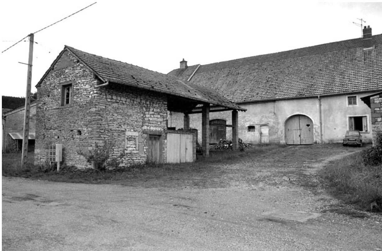
Ferme cadastrée 1941 A6 808, située rue de la Fontaine : vue de la remise et de la partie droite. 70, Chevigny