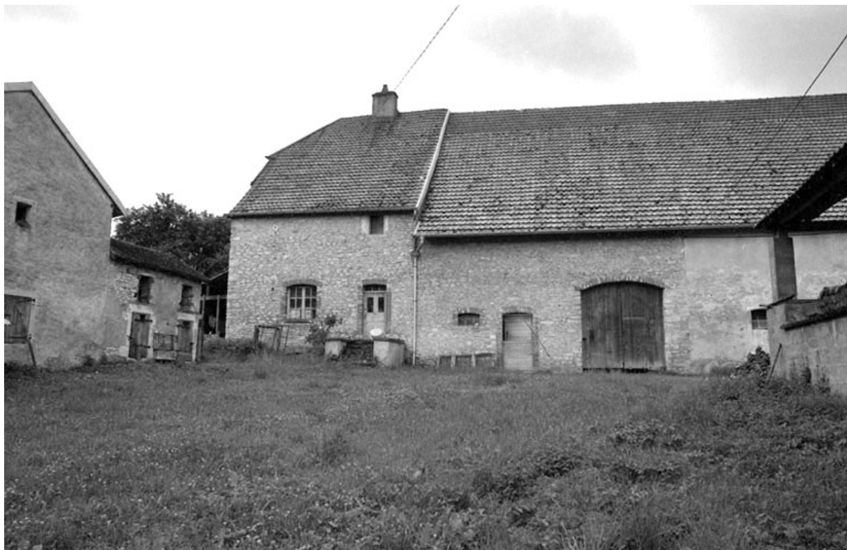
Ferme cadastrée 1941 A6 808, située rue de la Fontaine : vue de la partie gauche. 70, Chevigny