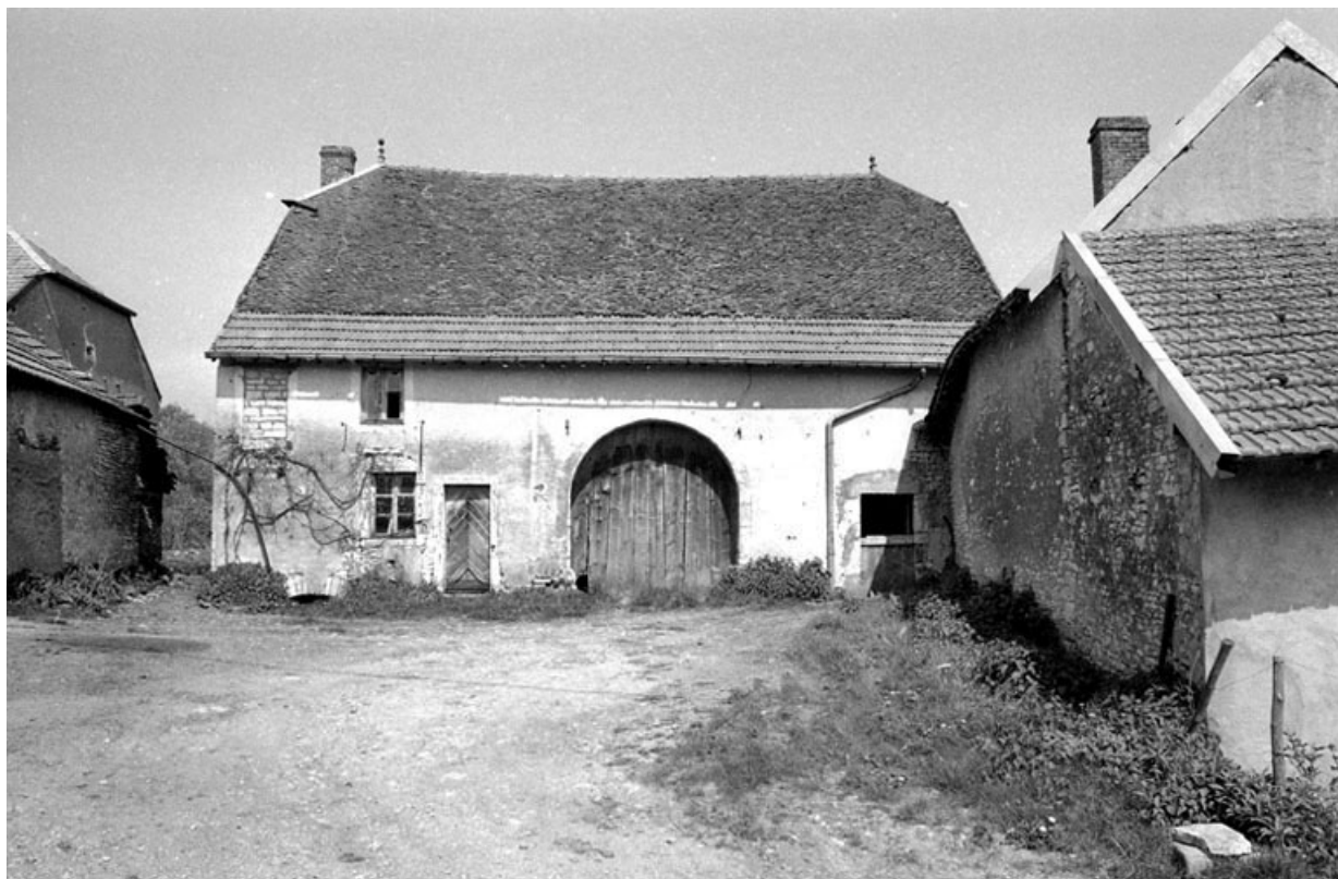
Ferme cadastrée 1941 A6 750, située rue Vierge de Chevigny : vue du bâtiment situé à droite. 70, Chevigny