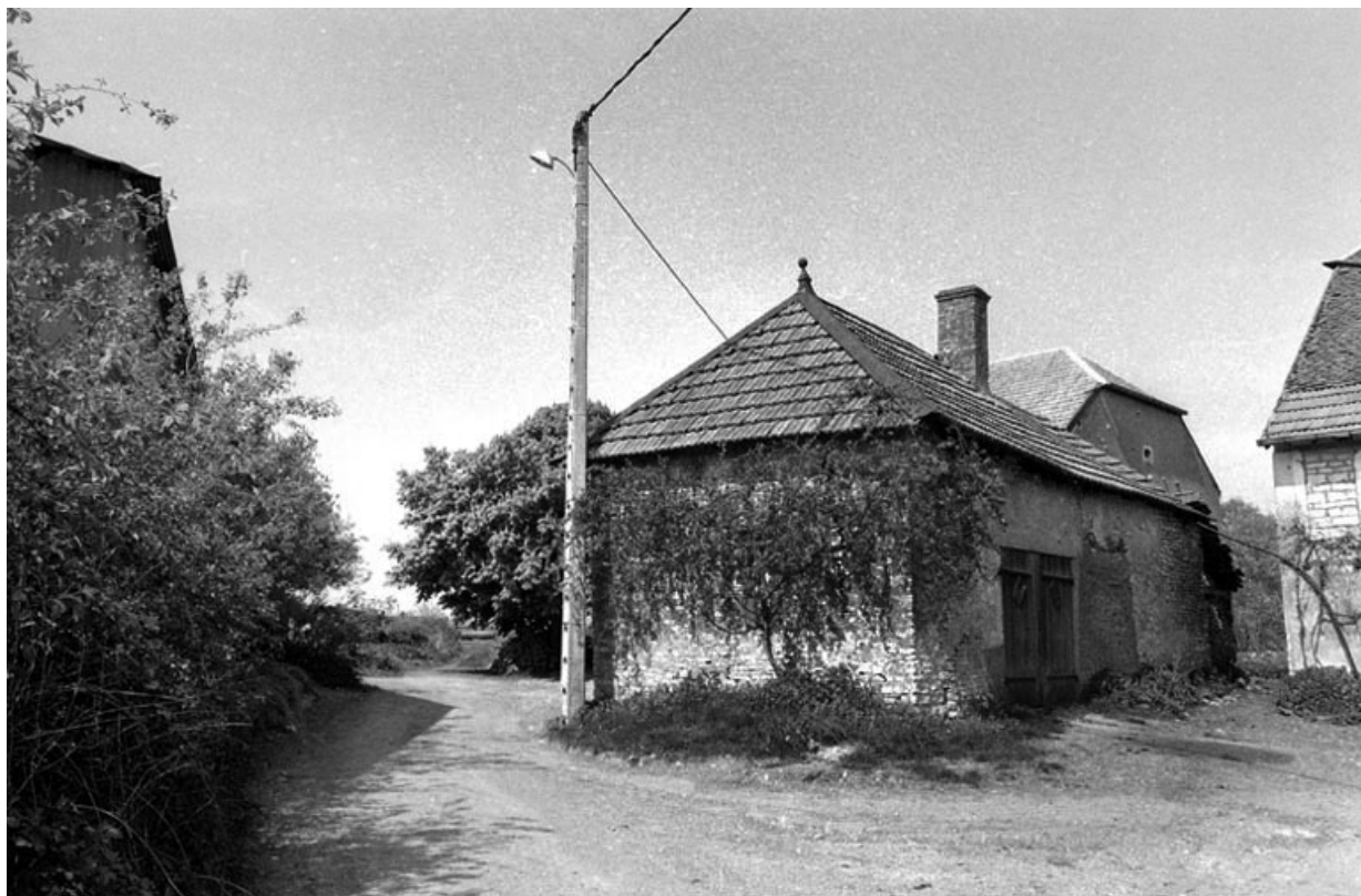
Ferme cadastrée 1941 A6 750, située rue Vierge de Chevigny : vue de la remise. 70, Chevigny