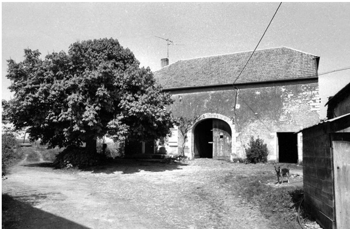
Ferme cadastrée 1941 A6 750, située rue Vierge de Chevigny : vue du bâtiment situé à gauche. 70, Chevigny