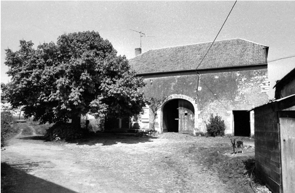
Ferme cadastrée 1941 A6 750, située rue Vierge de Chevigny : vue du bâtiment situé à gauche. 70, Chevigny