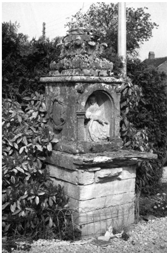
Vue d'ensemble du socle.