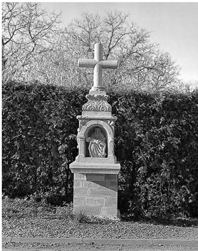
Croix après restauration : de face.