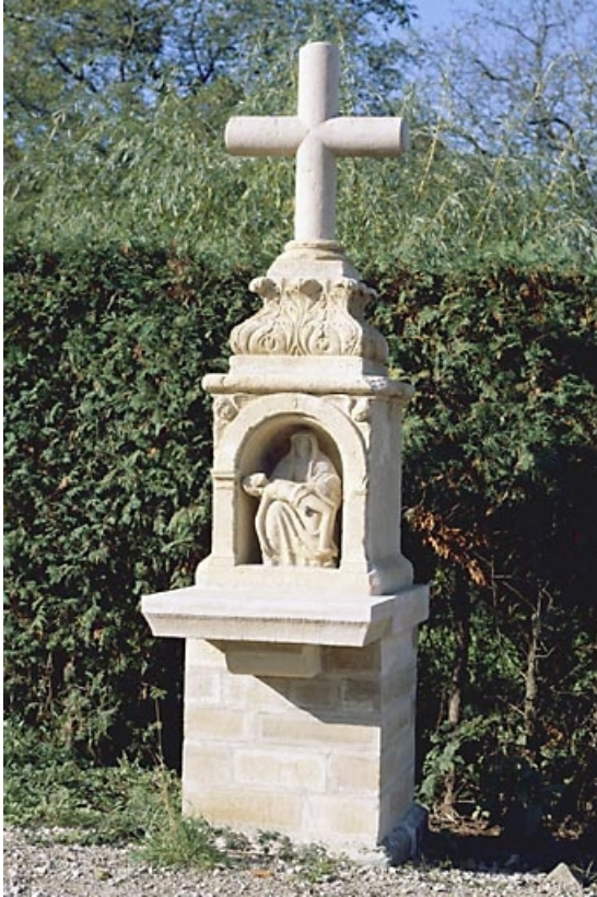
Vue de face après restauration.