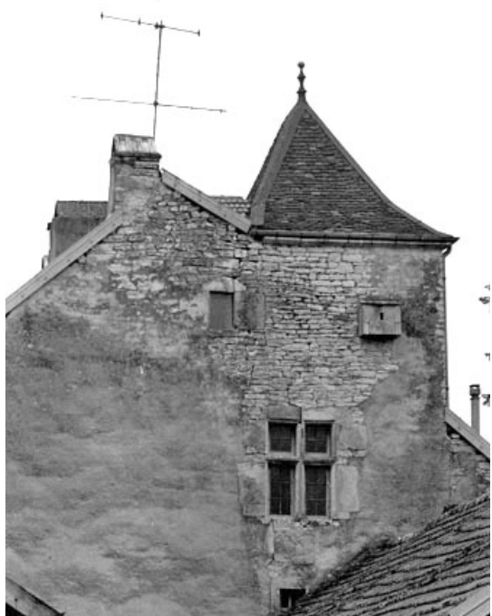
Détail de l'habitation : le pigeonnier au-dessus de la tourelle d'escalier en vis. 70, Chancey rue des Clos