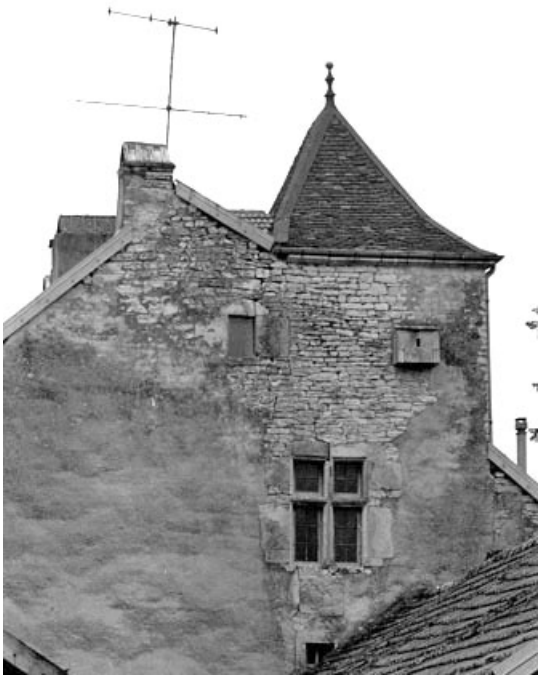
Détail de l'habitation : le pigeonnier au-dessus de la tourelle d'escalier en vis. 70, Chancey rue des Clos