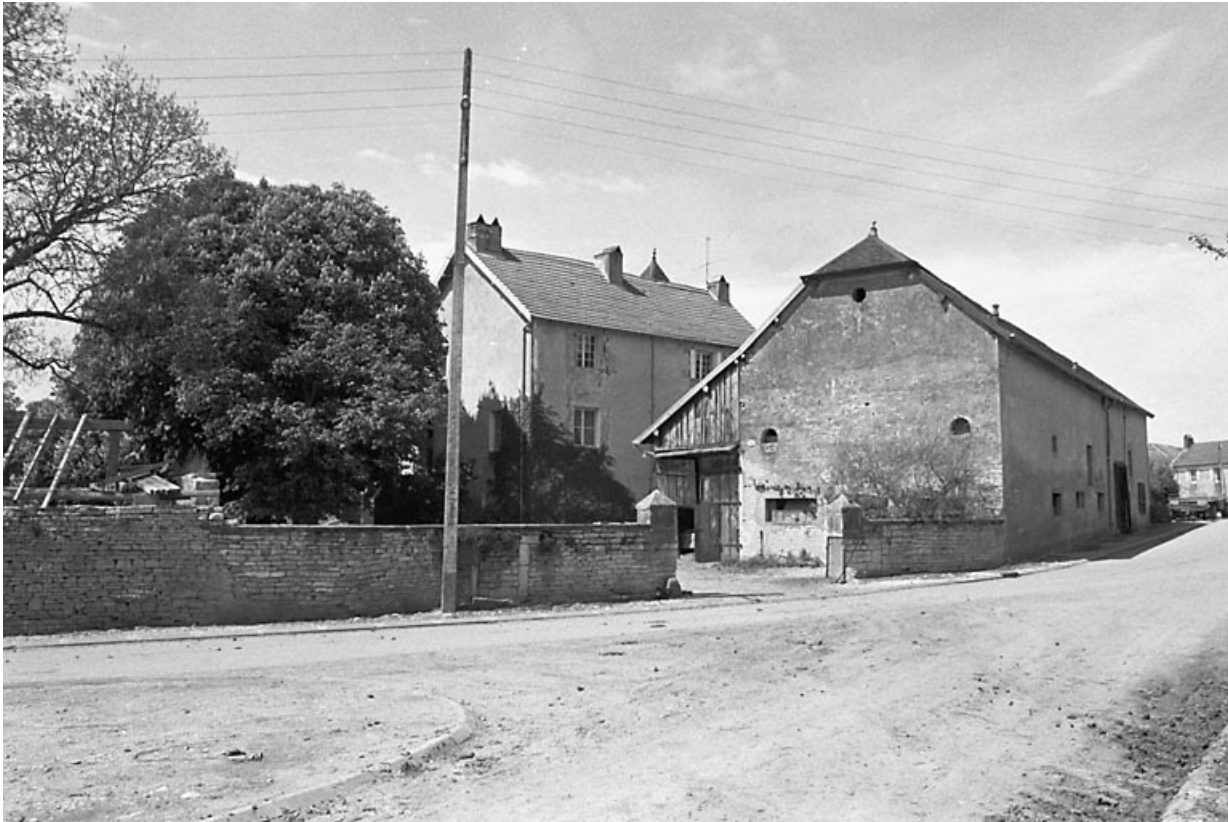
Ferme dissociée avec cour fermée.