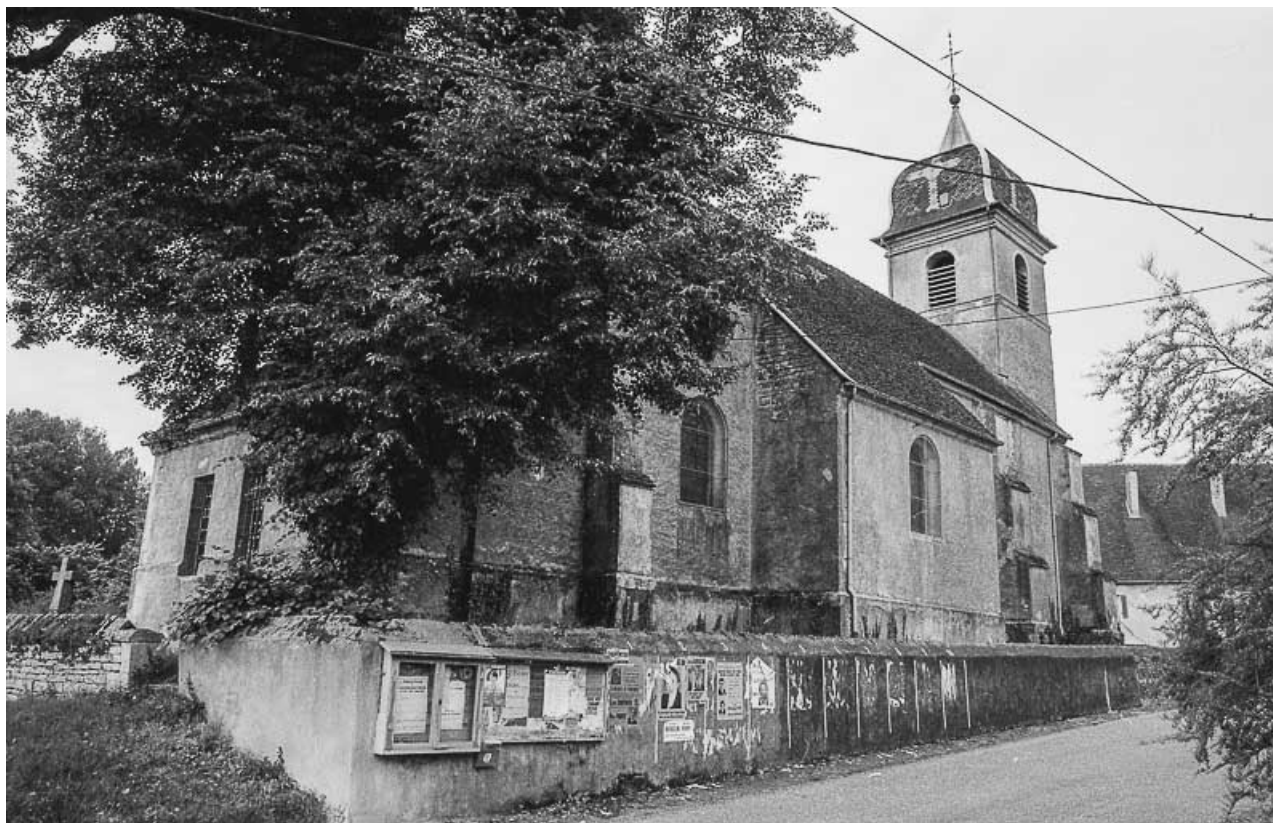
Façades latérale gauche et postérieure.