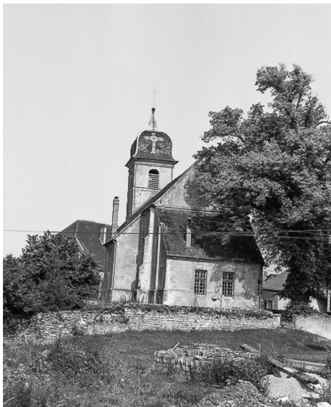
Extérieur : chevet et sacristie.