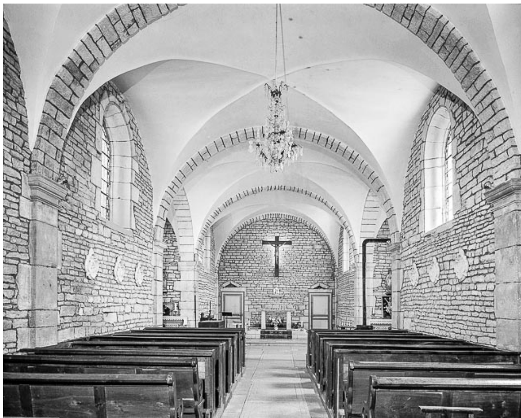
Intérieur : nef et choeur.