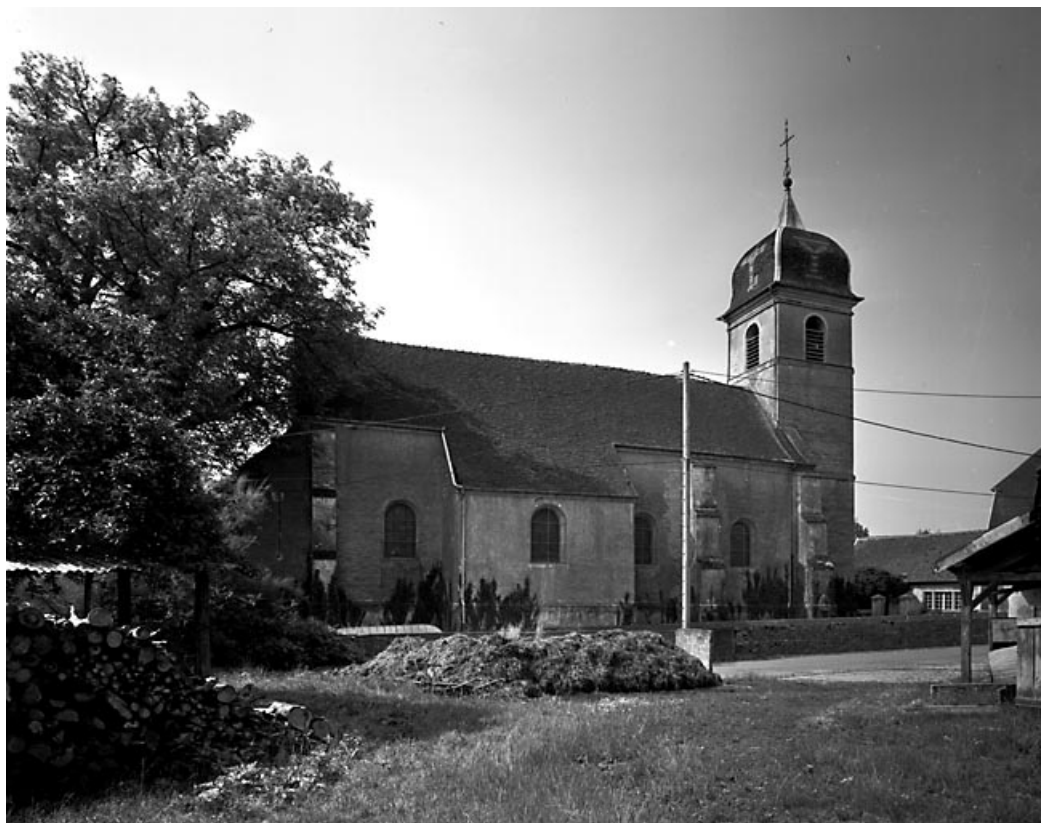
Façade latérale gauche. 70, Bresilley