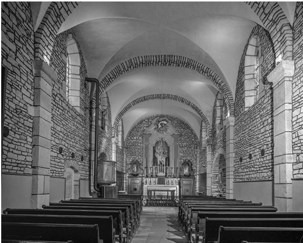
Intérieur : nef et choeur.