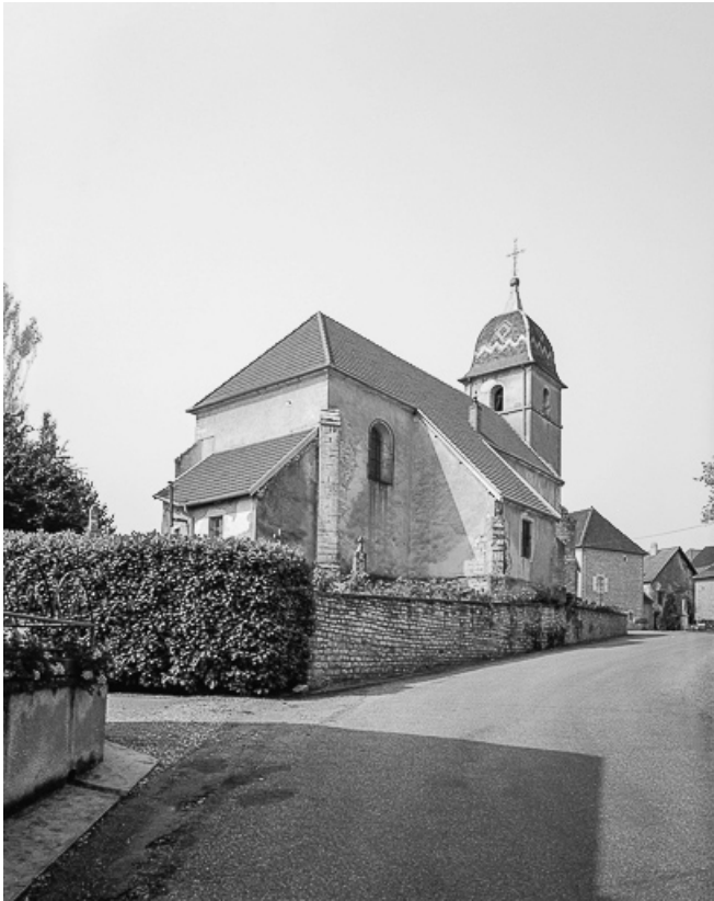
Extérieur : façades postérieure et latérale gauche.