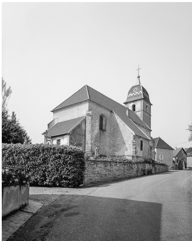
Extérieur : façades postérieure et latérale gauche.