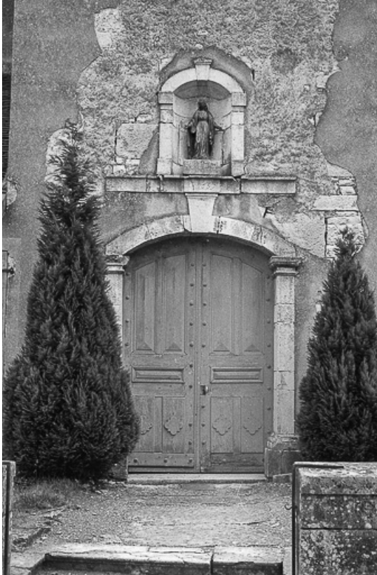
Extérieur : détail du porche de l'église.