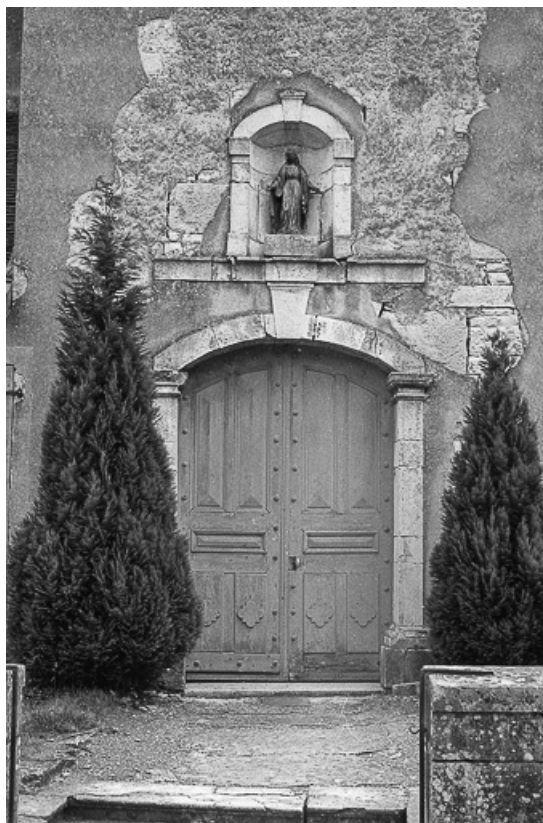
Extérieur : détail du porche de l'église.