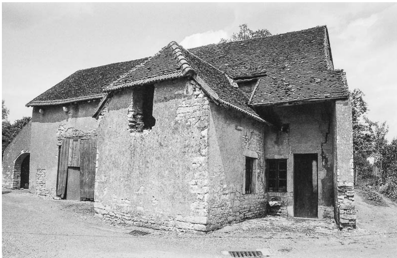
Ferme cadastrée ZD 39, située rue des Tantots : vue d'ensemble. 70, Bard-lès-Pesmes