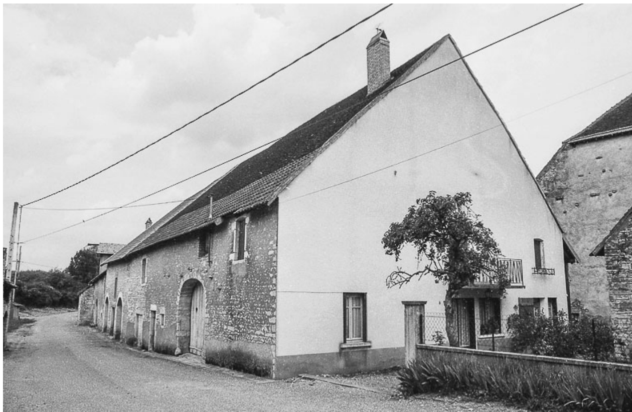
Ferme situées rue du Mont. 70, Bard-lès-Pesmes