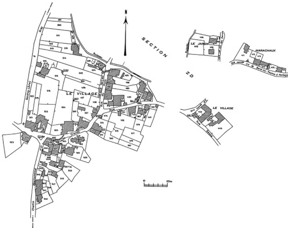
Extrait du cadastre de 1979, section B3. 70, Bard-lès-Pesmes