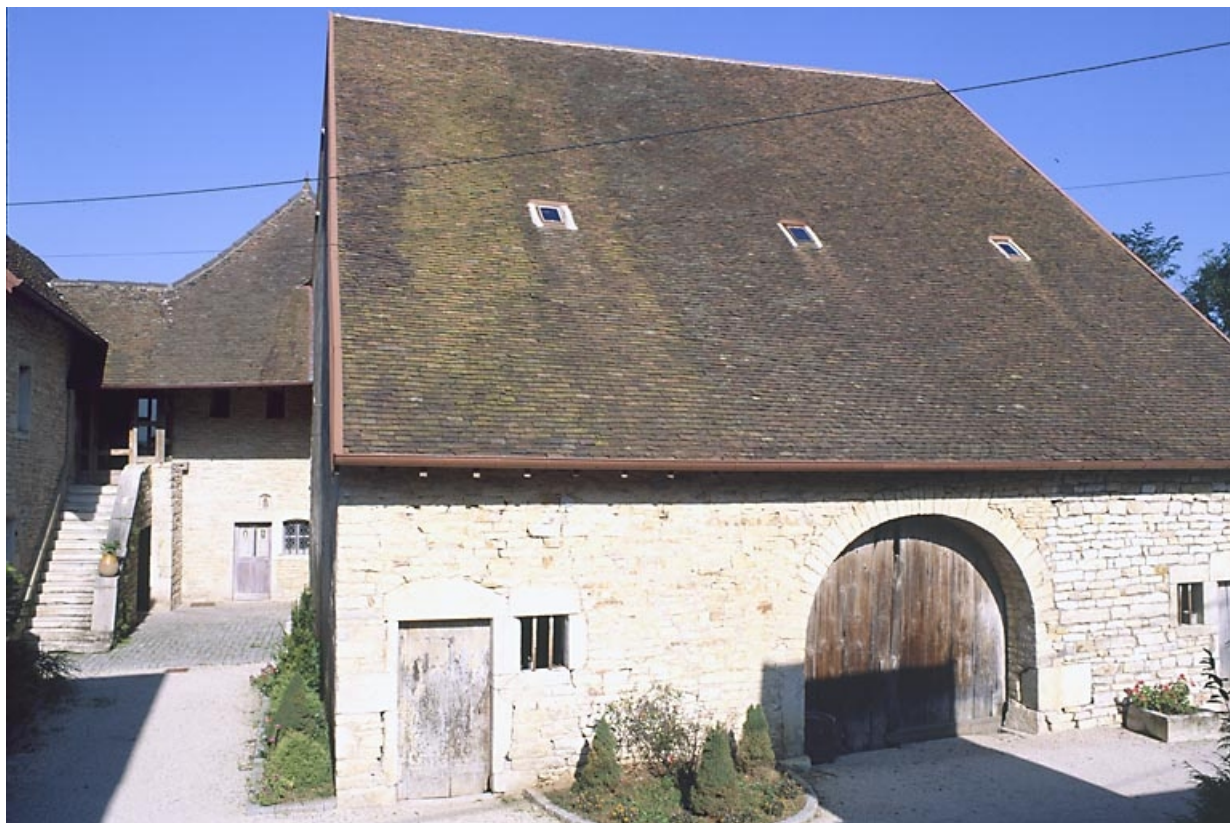
Les parties agricoles situées dans la cour.