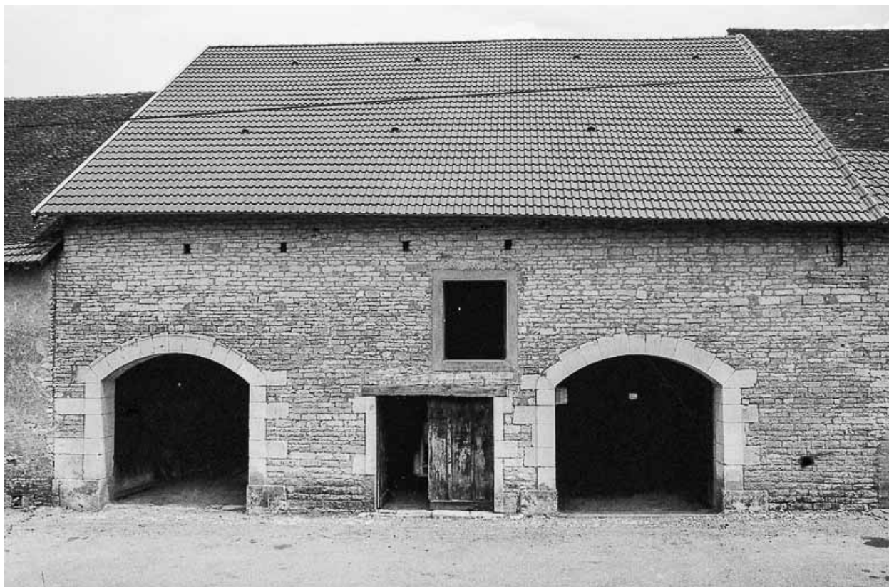
Ferme située rue du Mont, à travées avec parties agricoles sur long-pan antérieur et habitation en rez-de-chaussée sur long-pan postérieur.