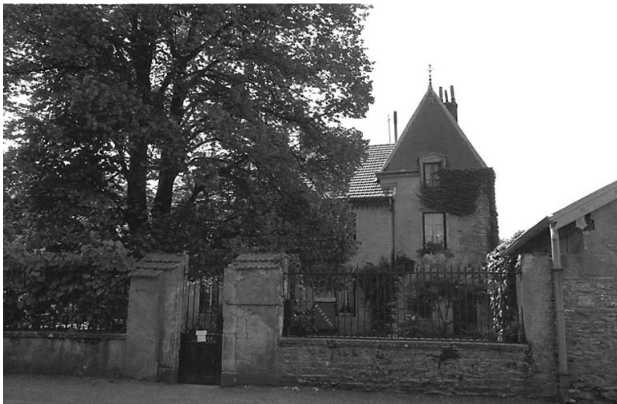
Vue d'ensemble depuis la rue.