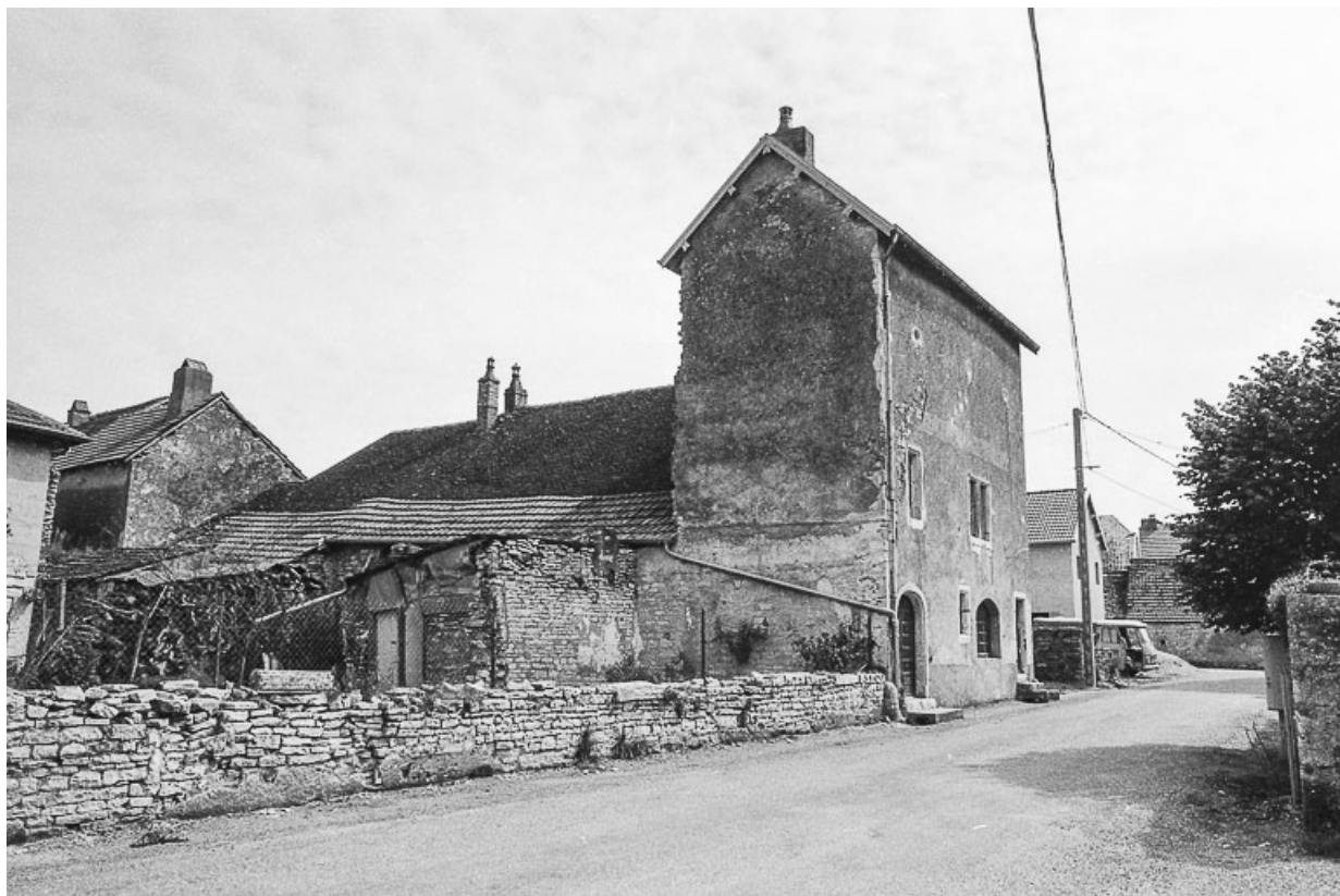
Vue d'ensemble : façade postérieure.