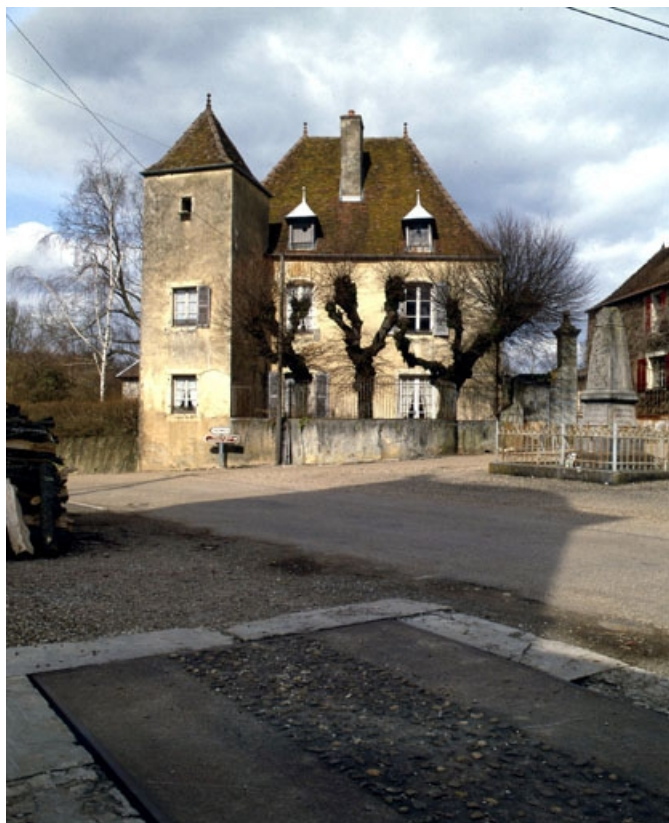
Vue d'ensemble depuis la rue.