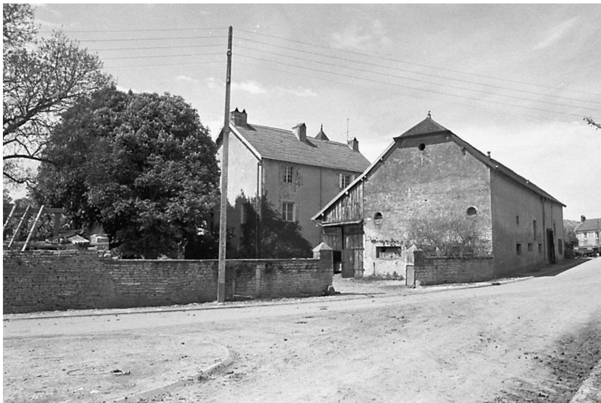
Ferme dissociée avec cour fermée.