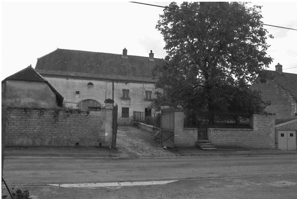
Vue d'ensemble depuis la rue.