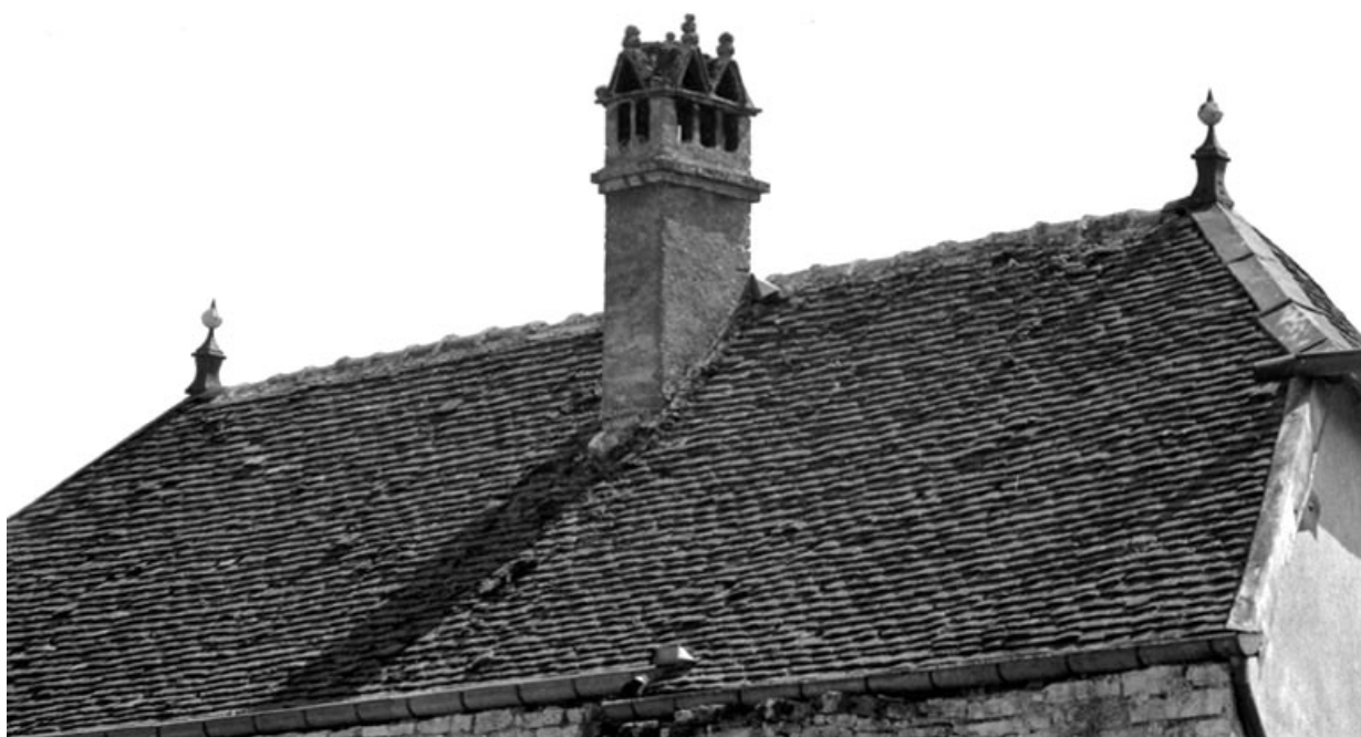
Détail du toit recouvert de tuiles plates