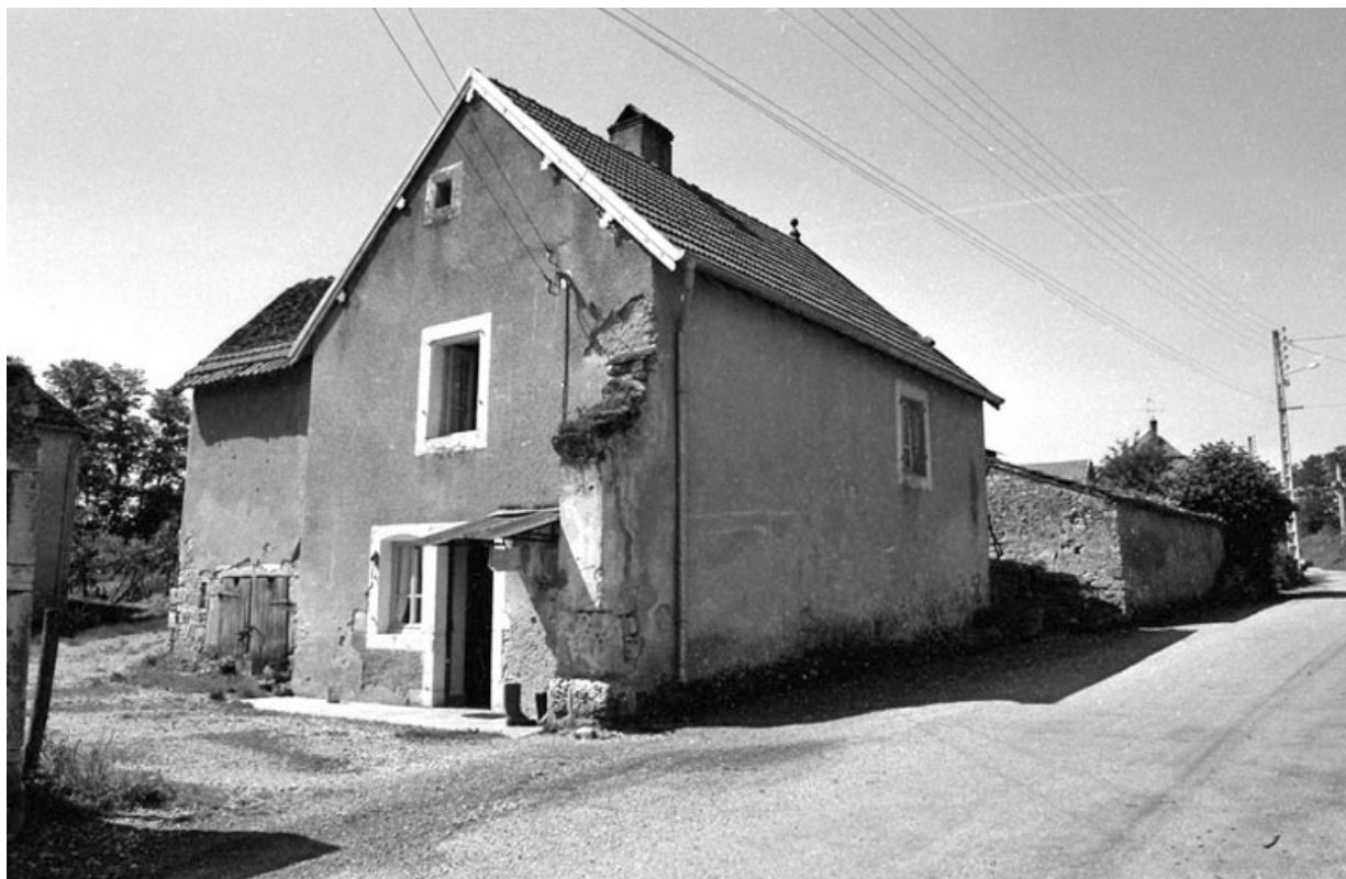
Logement indépendant à l'entrée de la cour.