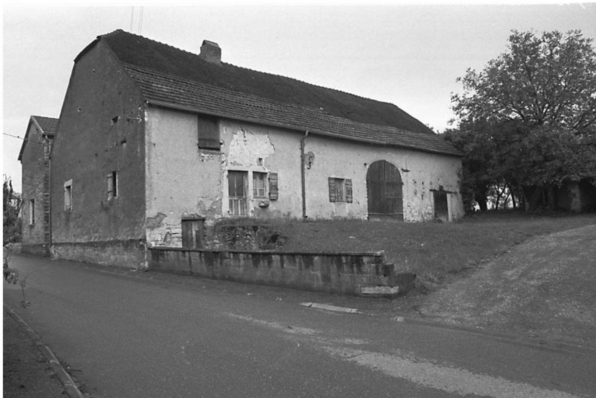
Ferme-bloc à trois travées.