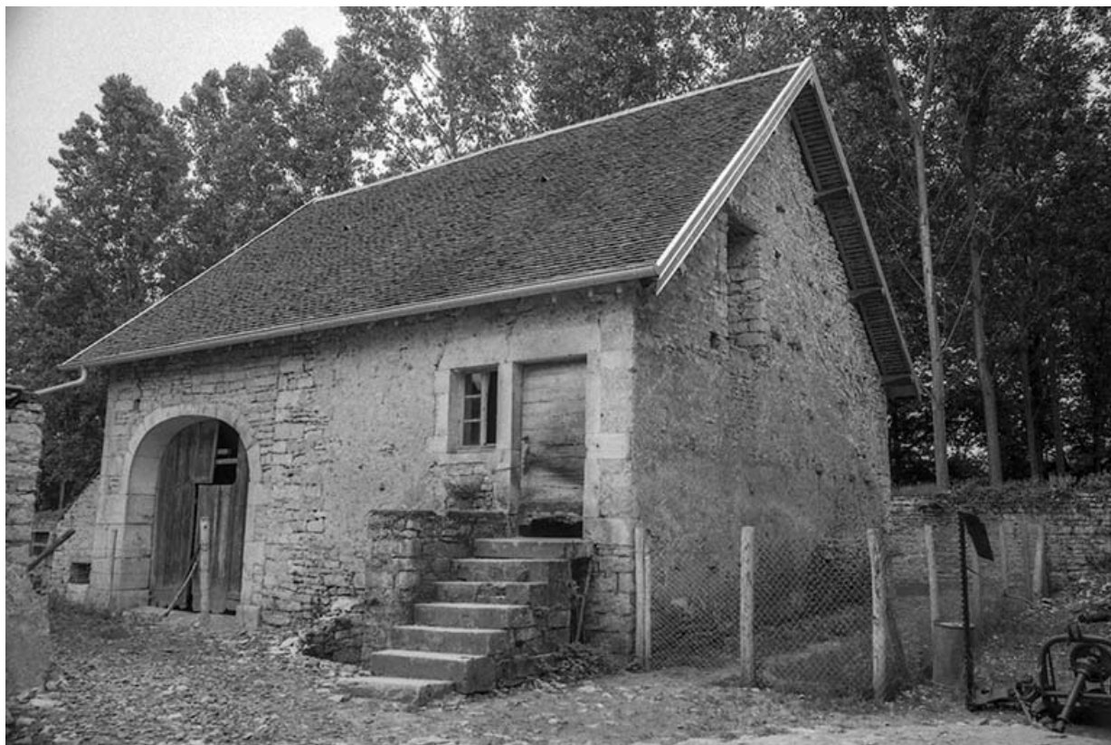
Ferme-bloc à deux travées cadastrée 1963 AC 158, située rue des Châteaux.