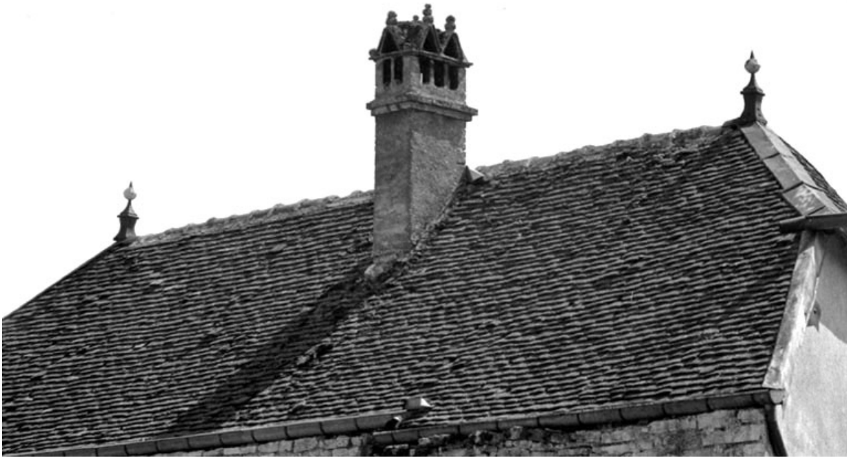
Détail du toit recouvert de tuiles plates