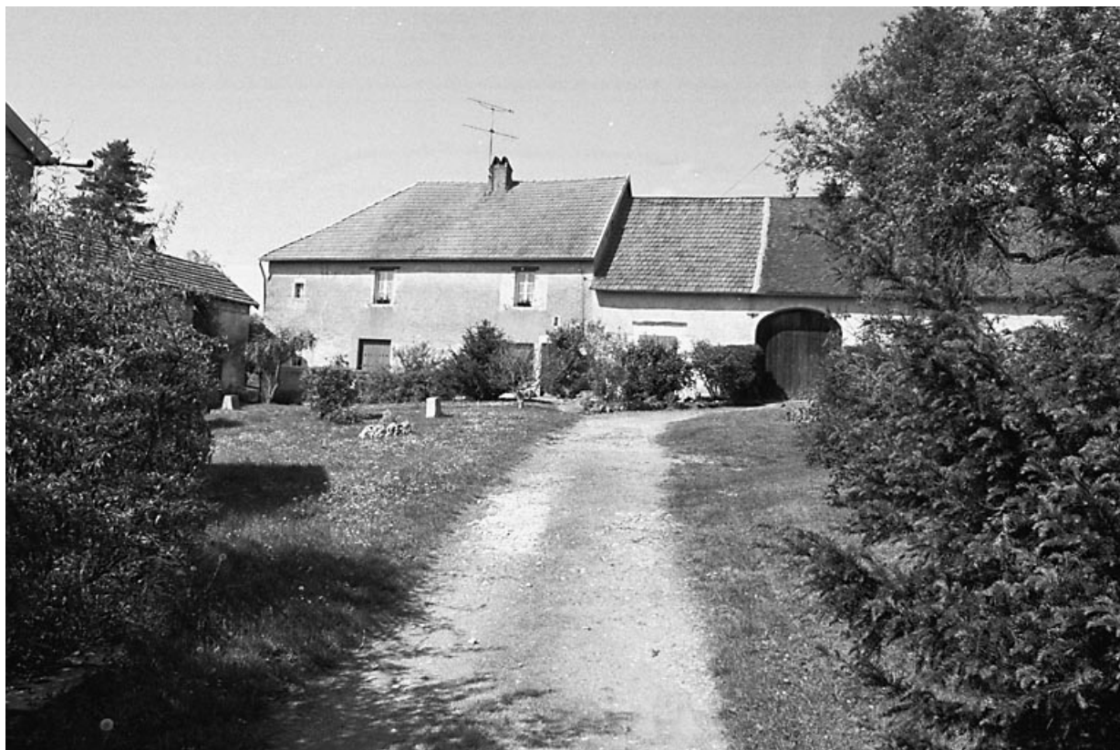
Vue d'ensemble depuis l'entrée de la cour.