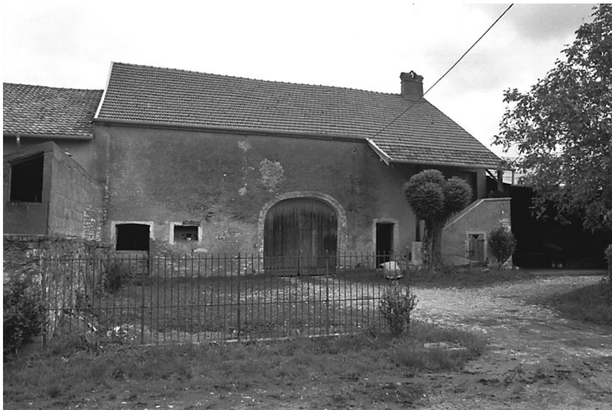
Façade antérieure sur cour.