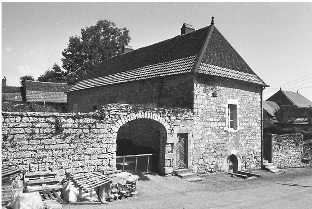
Vue d'ensemble depuis la rue.