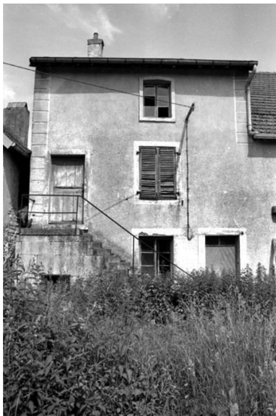
Ferme cadastrée 1970 B 54, située rue Gazelle : façade postérieure.