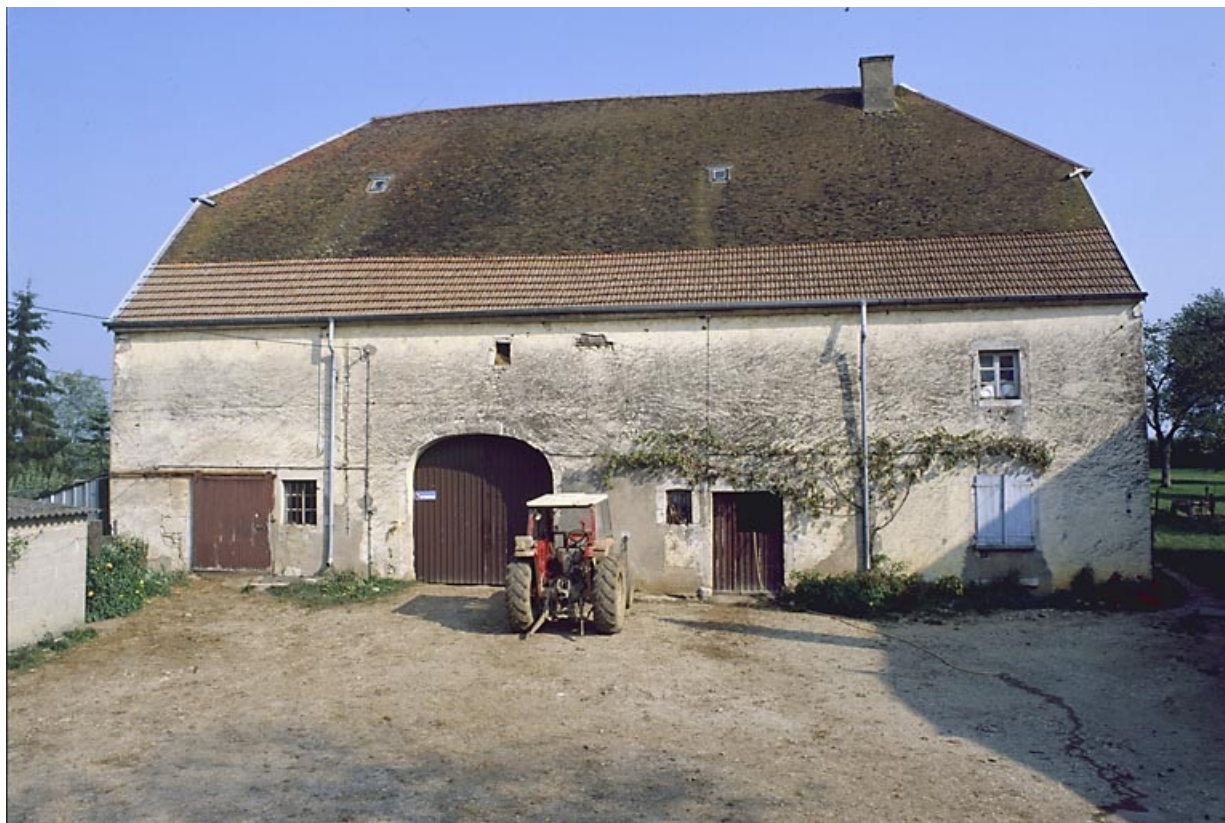
Façade sur cour.