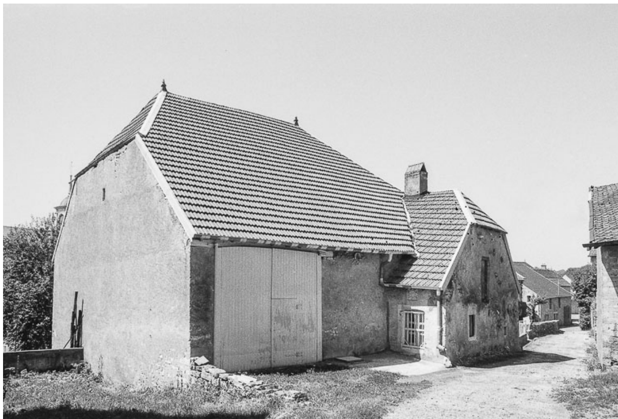
Le volume de grange.