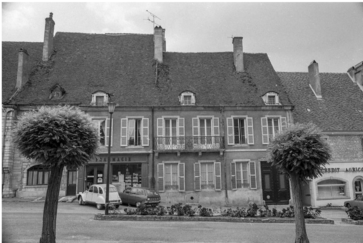
Façade sur rue.