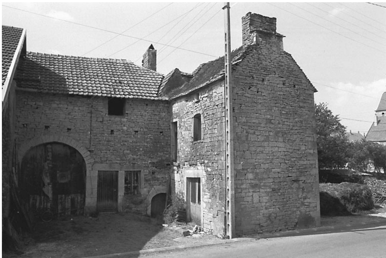
Ferme avec habitation débordante : façade antérieure.