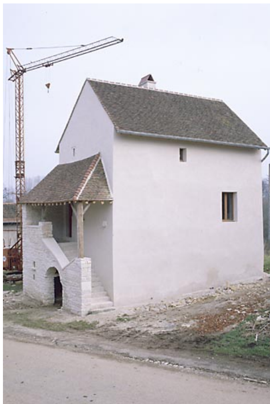
Vue de trois quarts droit.