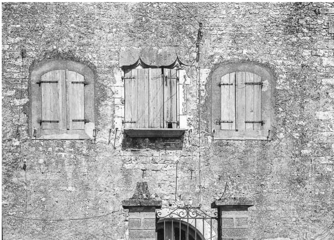
Mur en moellons calcaires recouverts d'enduit