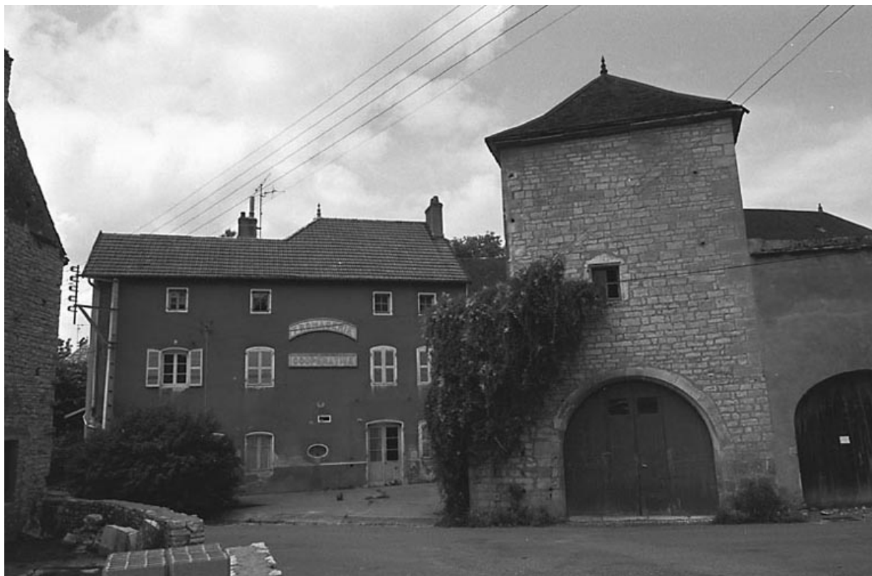
Façade antérieure et pigeonnier.