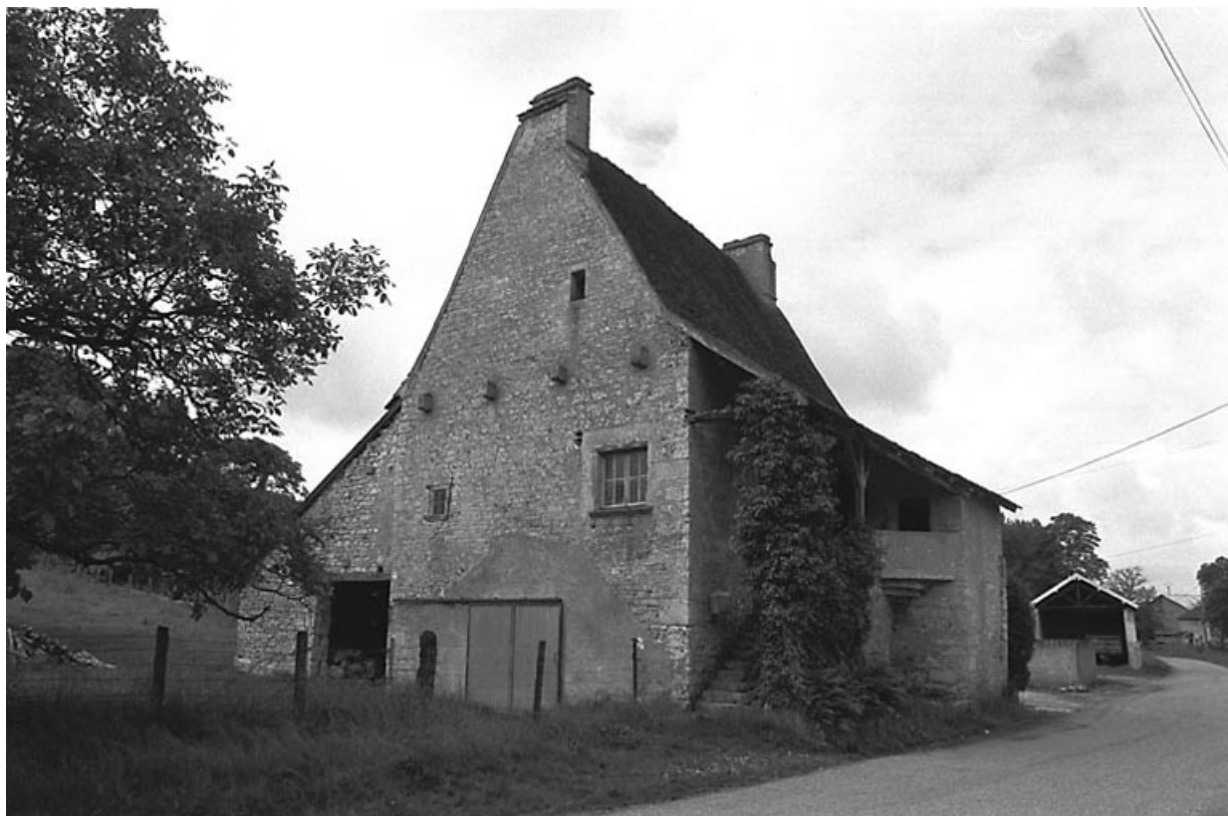
Façades antérieure et latérale gauche.