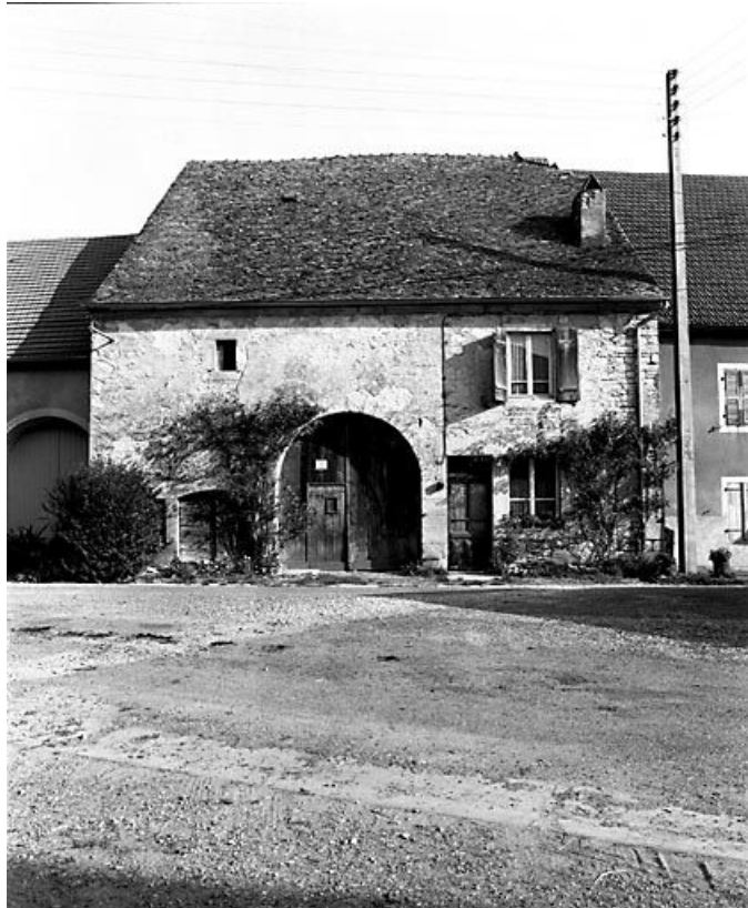
Façade antérieure à trois travées.