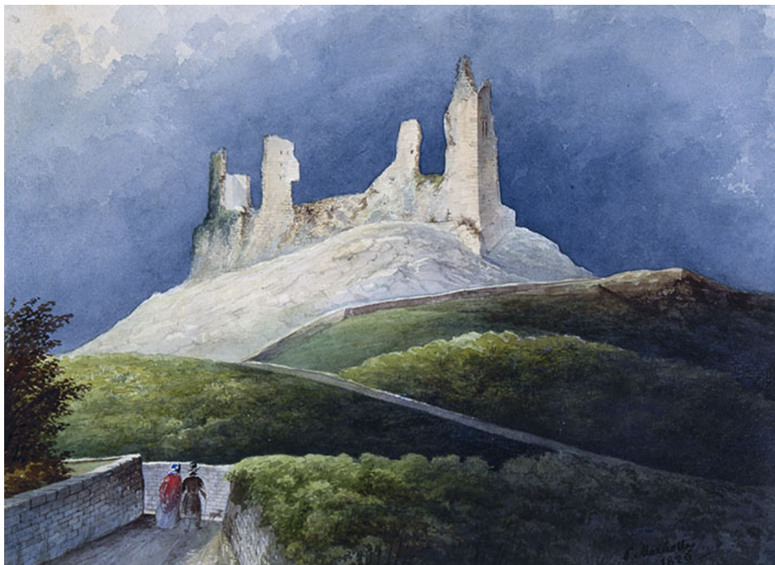
Les ruines du château d'Oiselay. 70, Oiselay-et-Grachaux