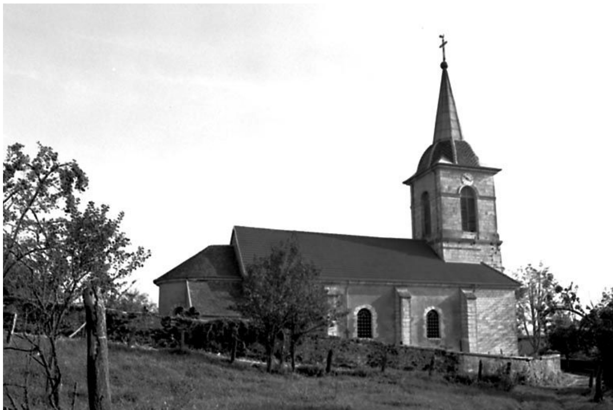
Façade latérale gauche. 70, Montboillon