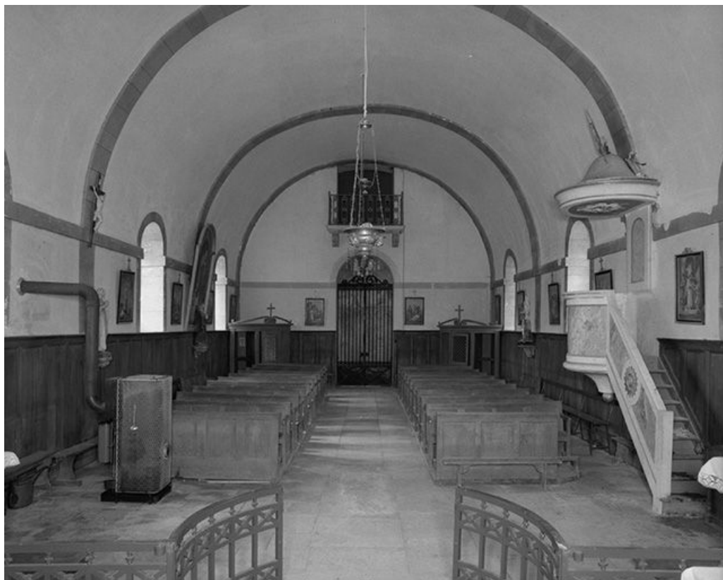
Intérieur : nef vue du chœur. 70, Montboillon