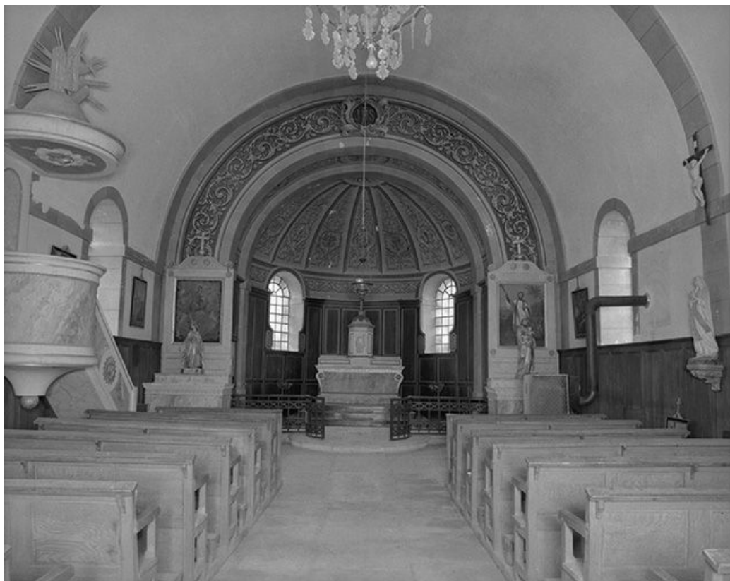
Intérieur : nef et chœur. 70, Montboillon