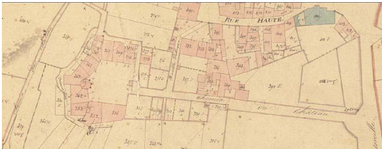
Le bâtiment sur le cadastre de 1837