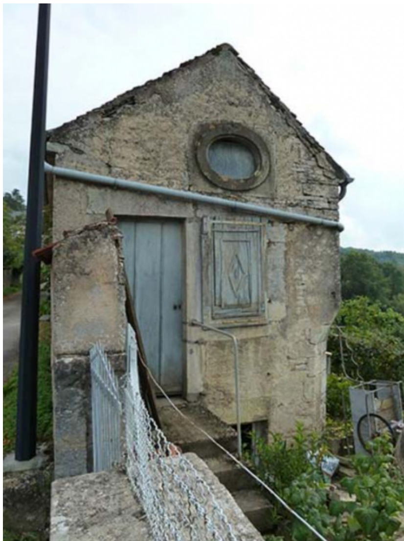
Vue générale nord