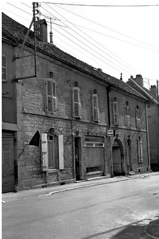
Façade antérieure en pierre de taille.