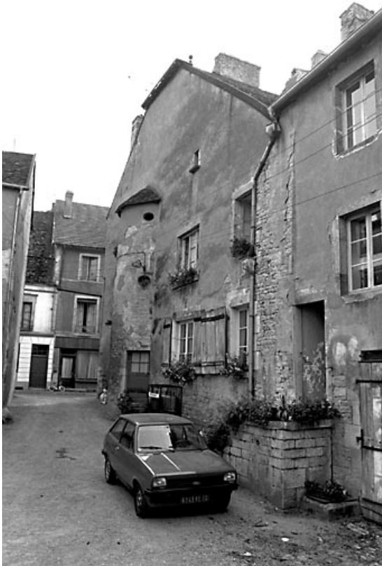
Façade latérale droite sur cour.