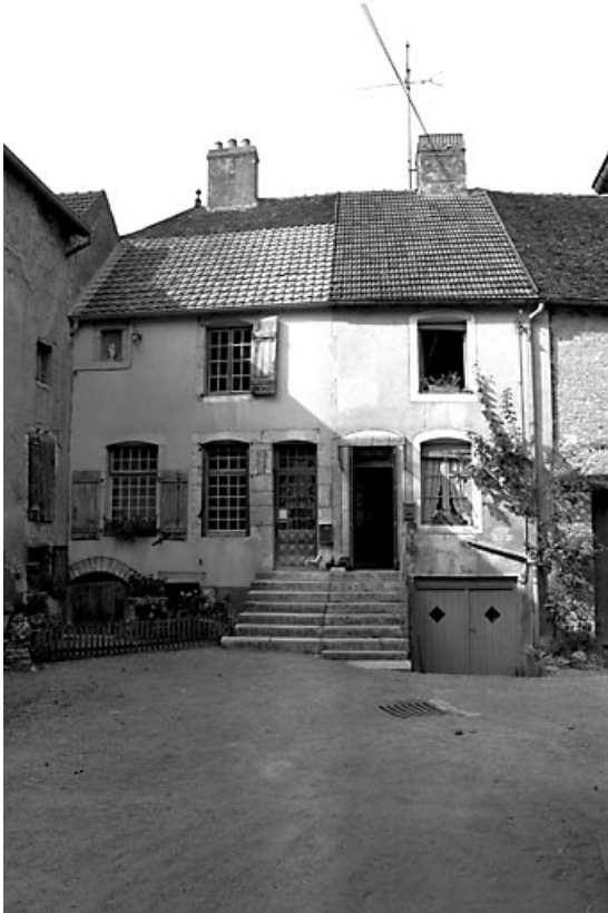
Habitations symétriques (seule la maison de gauche est sélectionnée). 70, Gy, 12-14 Grande Rue