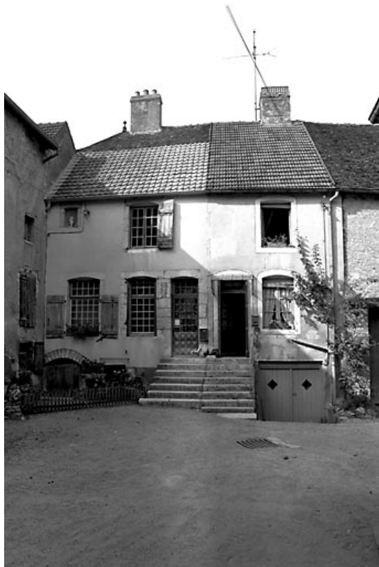
Habitations symétriques (seule la maison de gauche est sélectionnée).