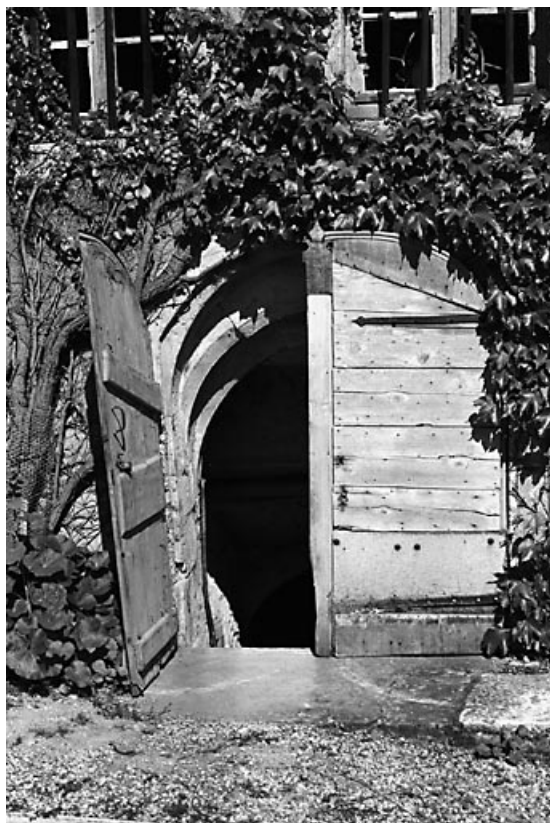
Entrée de la cave.