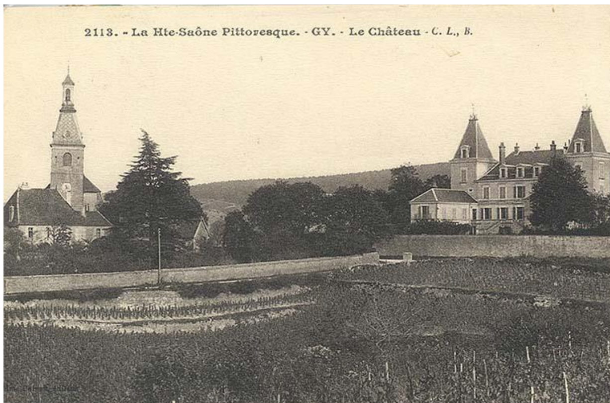
Le bâtiment sur une carte postale ancienne