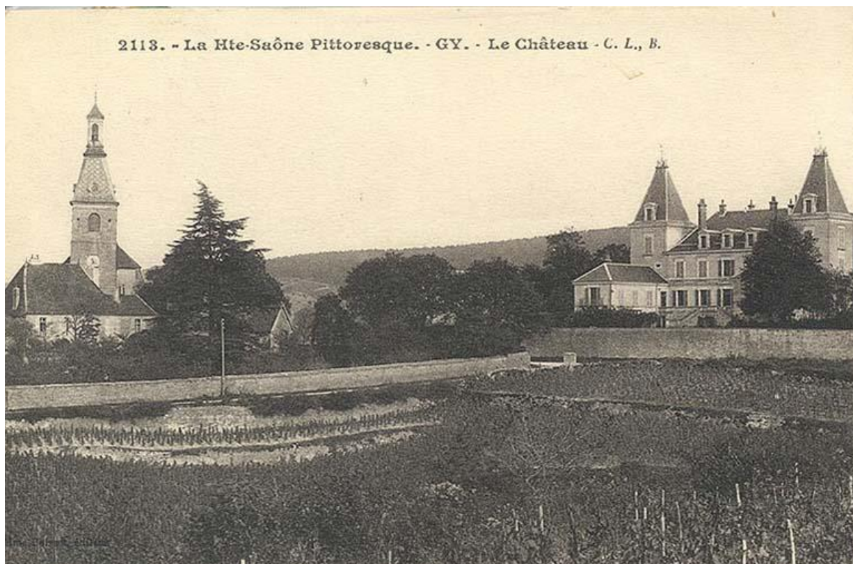
Le bâtiment sur une carte postale ancienne