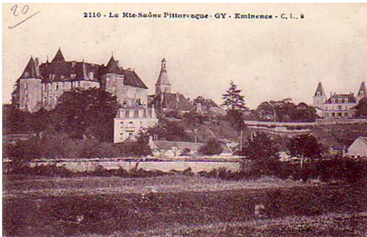
Vue nord-ouest du château sur une carte postale ancienne