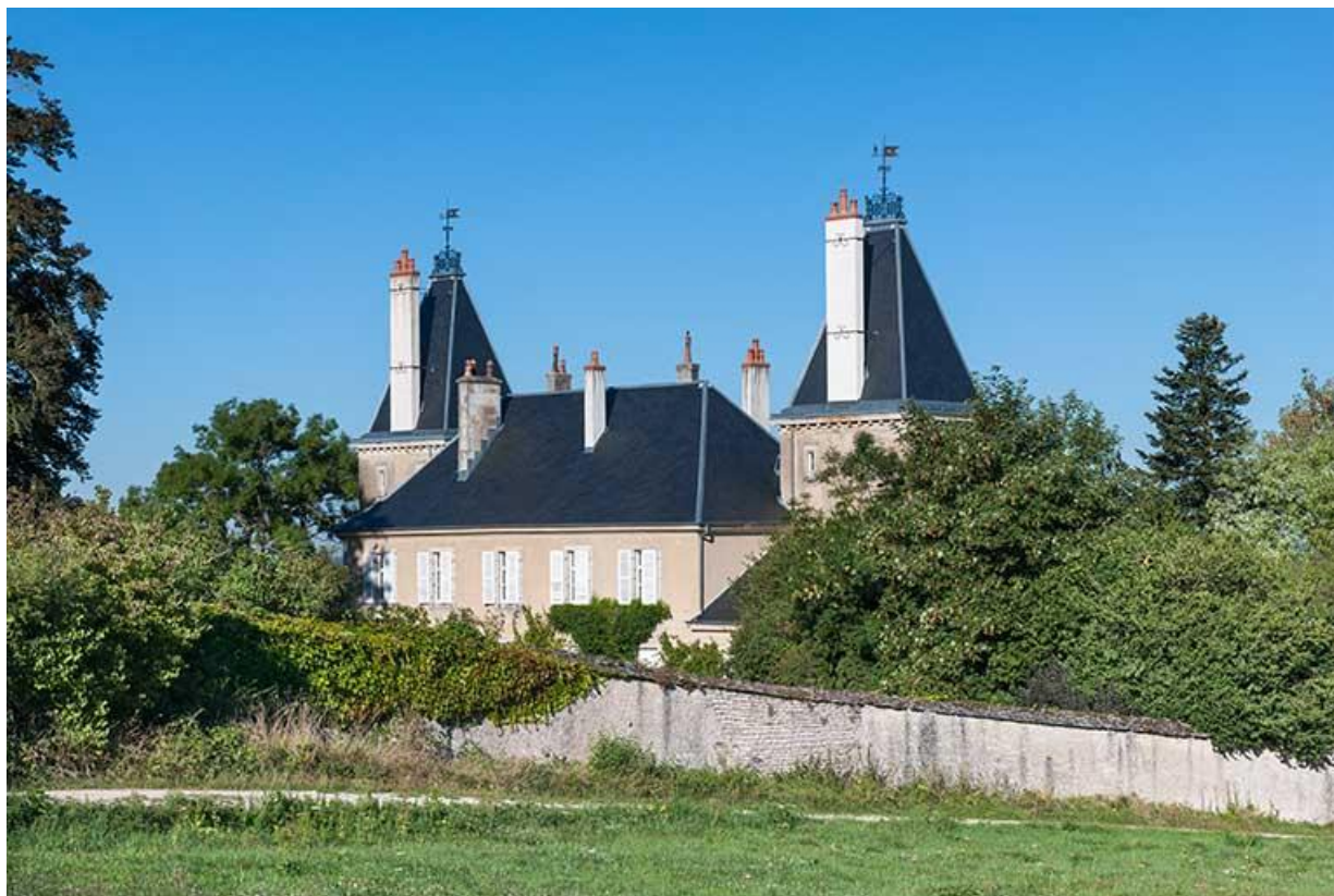
Vue générale sud-est