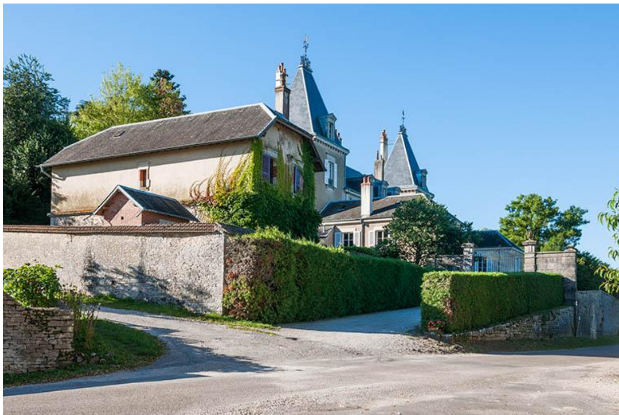
Vue générale nord-est