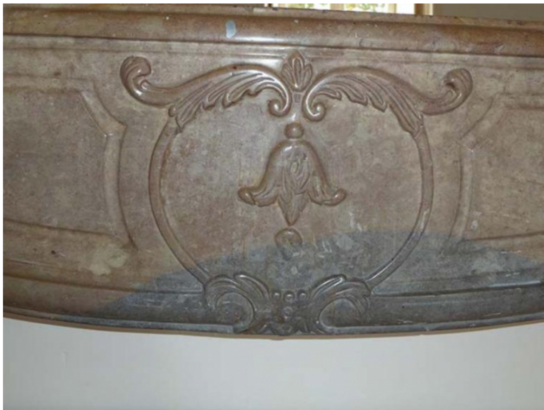
Cheminée en marbre de l'étage, détail