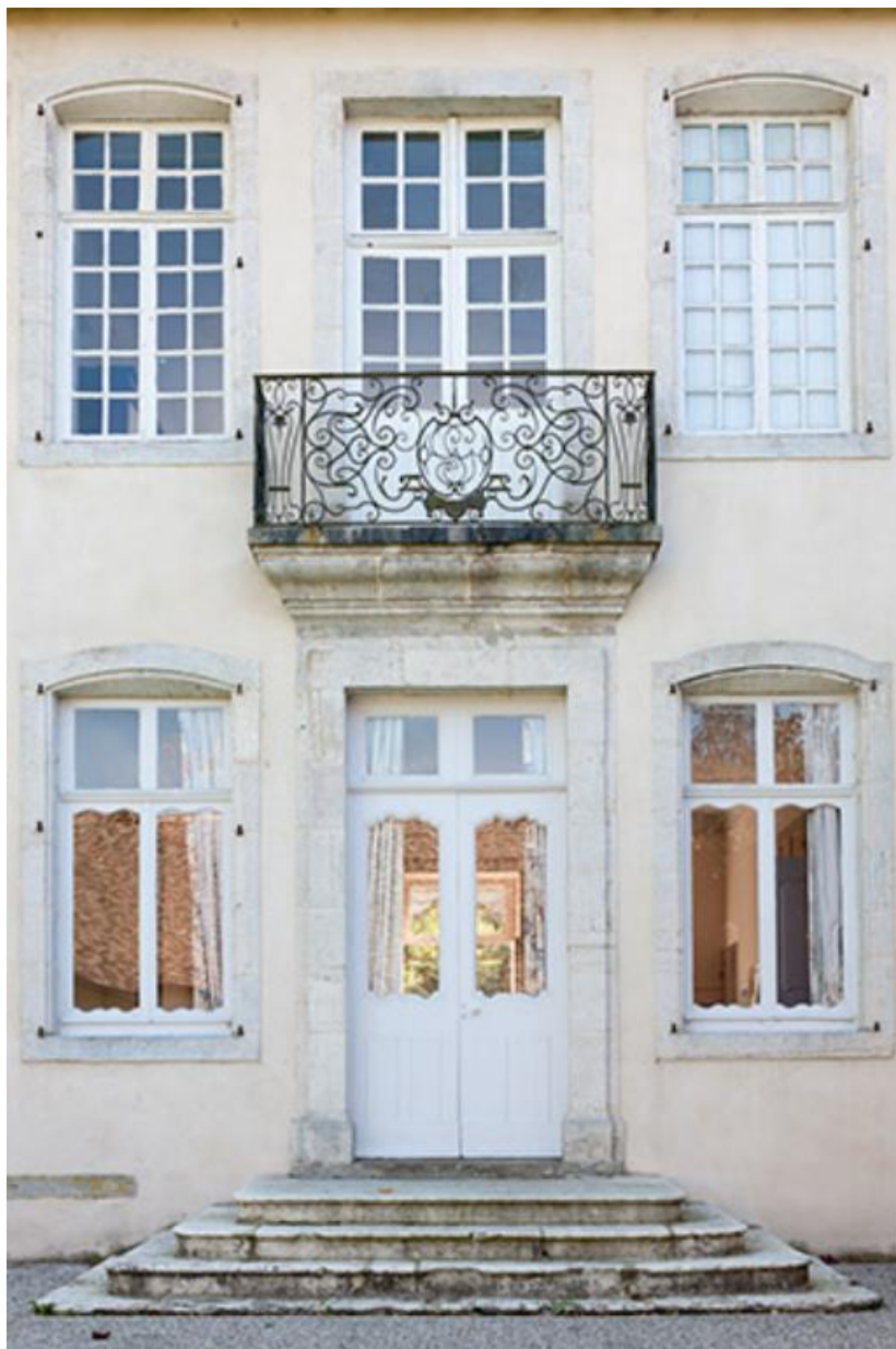
Détail de la partie centrale de la façade nord