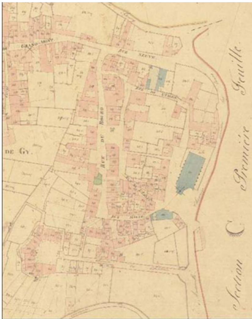
Le bâtiment sur le cadastre napoléonien (1837) 70, Gy