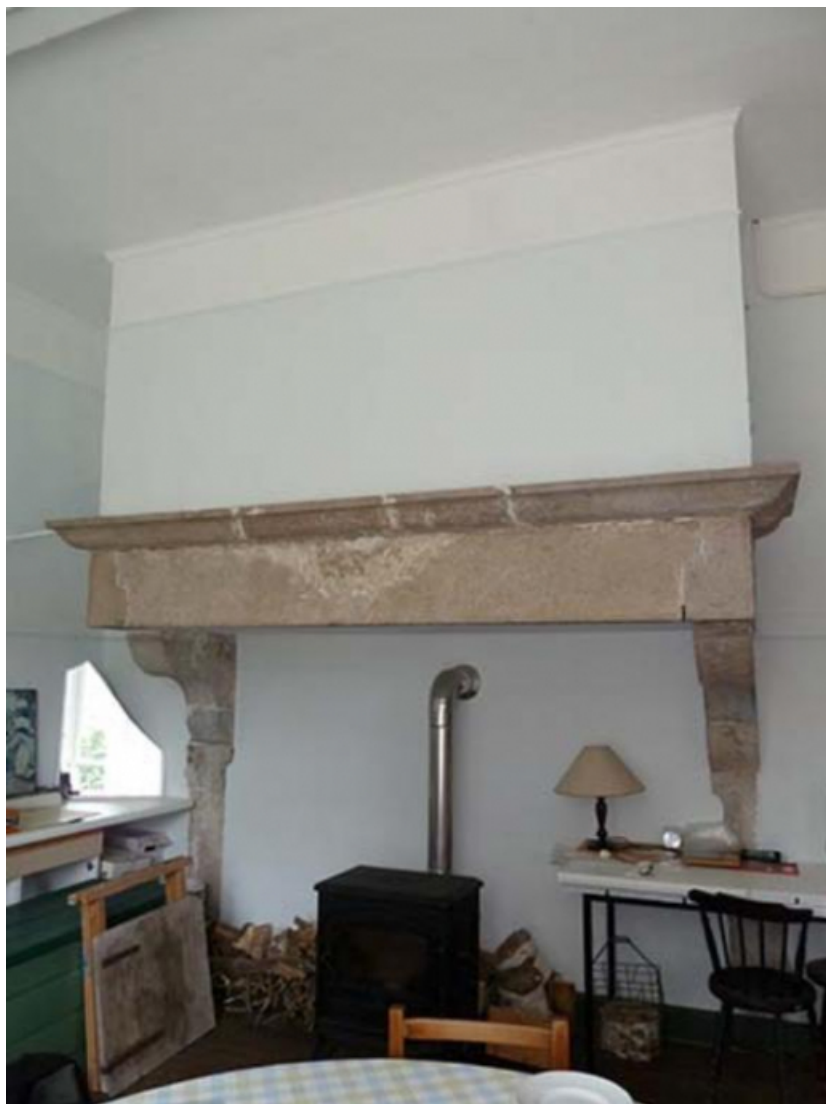
Cheminée de l'une des salles (ouest) du rez-de-chaussée 70, Gy rue Derrière les Tours