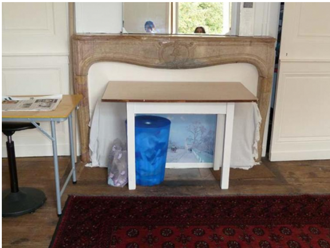
Cheminée en marbre de l'étage (partie ouest du bâtiment)