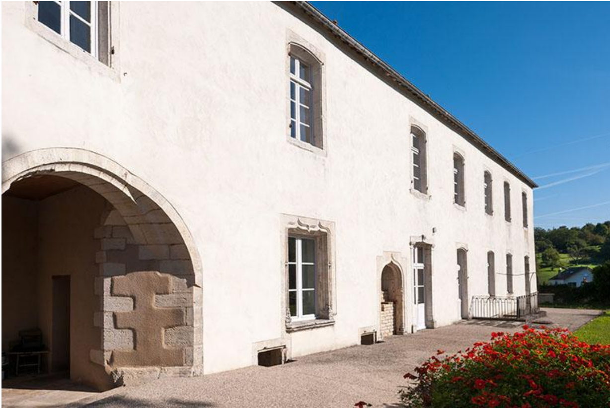
Vue sud-ouest du logis