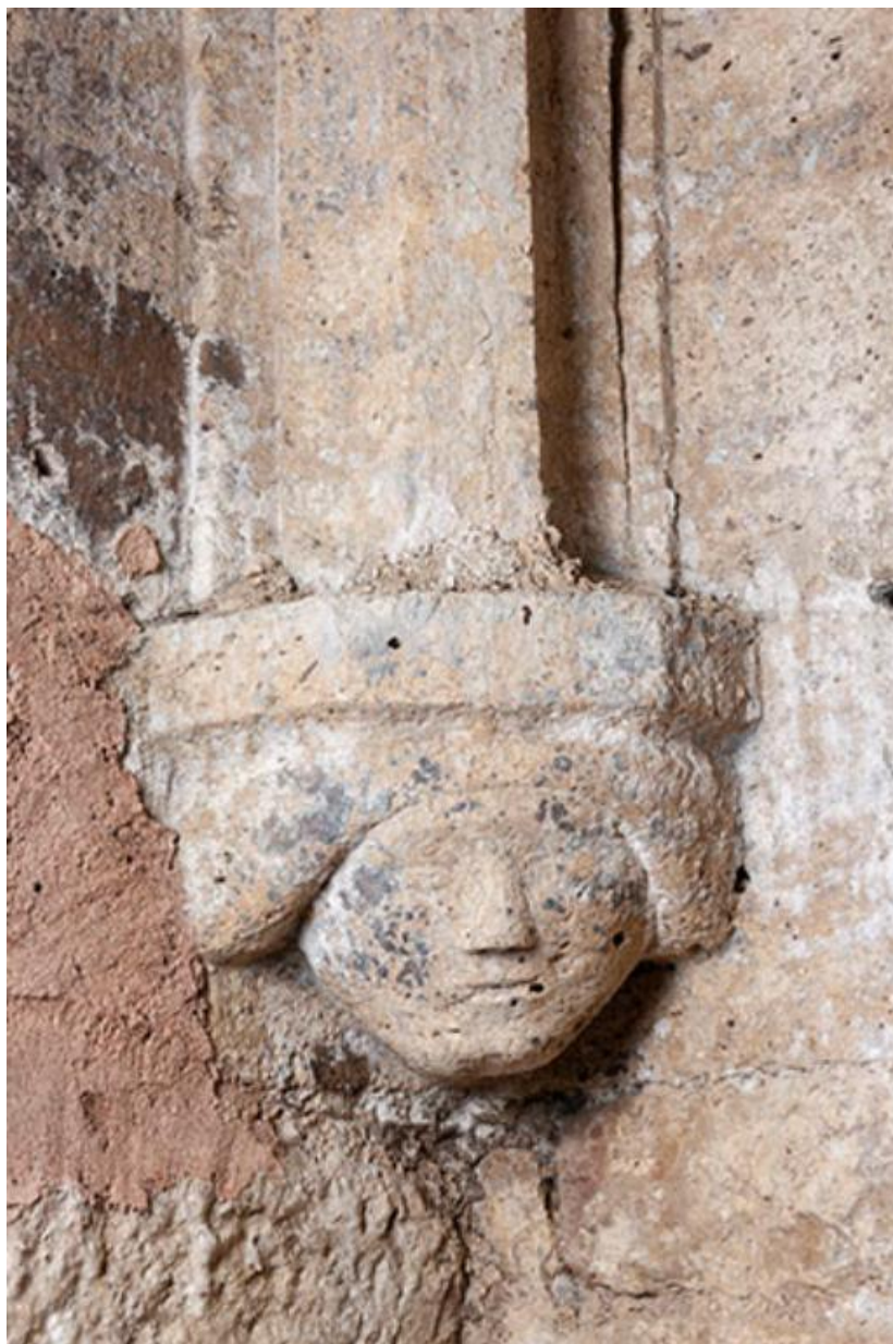
Détail d'un culot de retombée de la voute sur croisées d'ogives