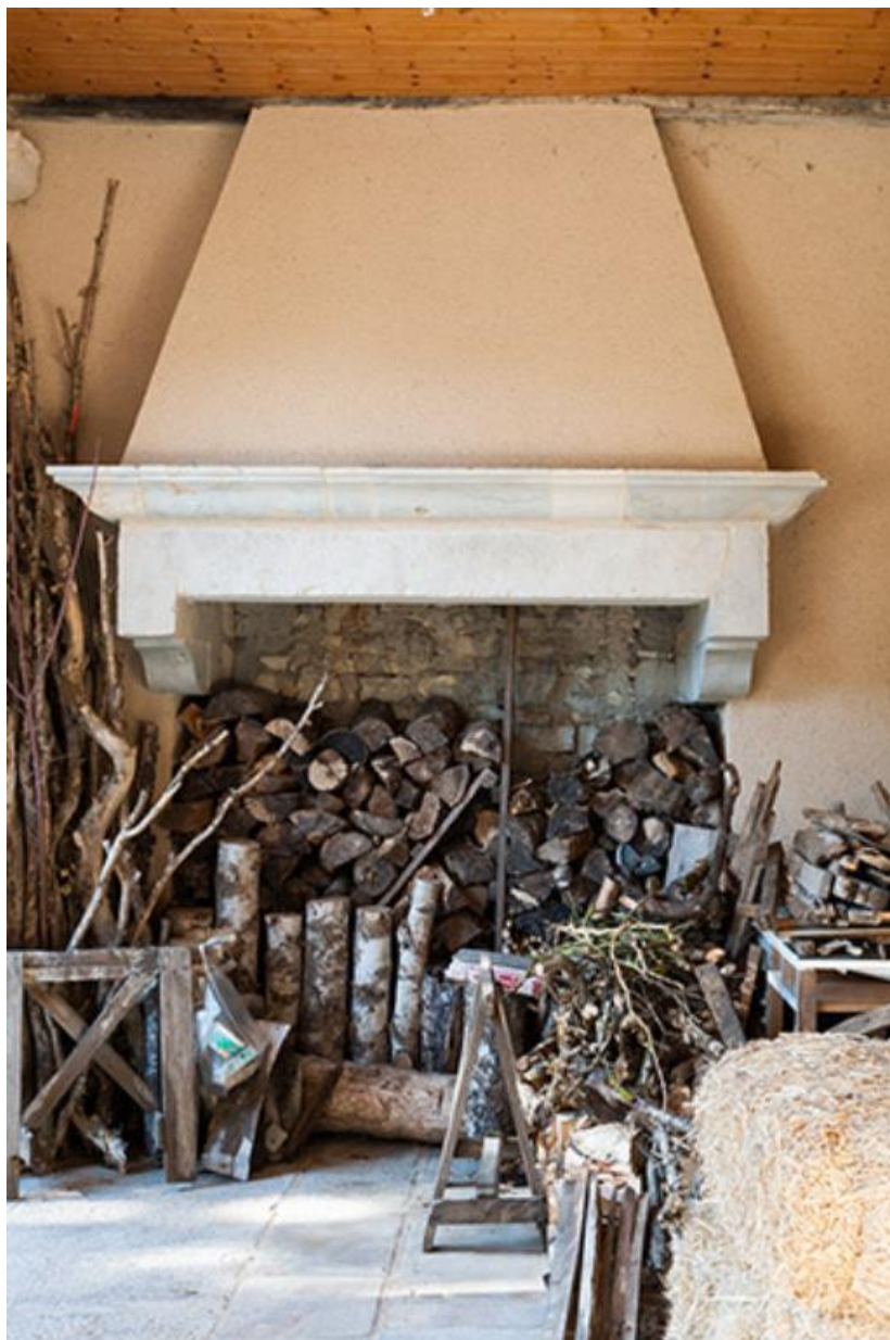
Cheminée située sous le porche