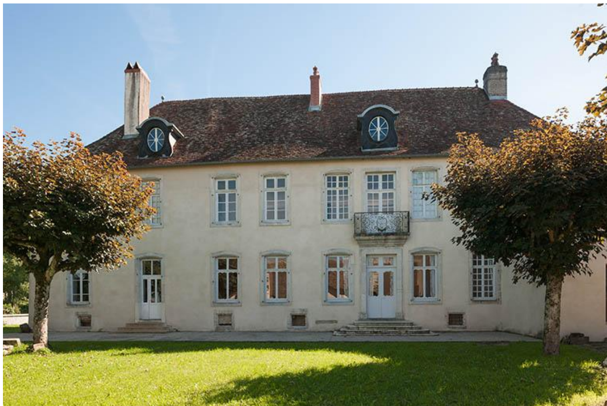
Façade nord 70, Gy