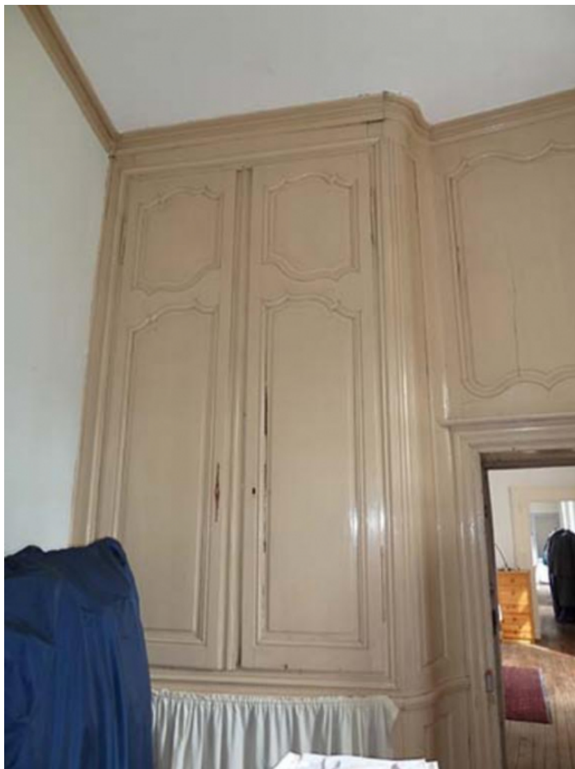
Boiseries de l'étage, détail 70, Gy rue Derrière les Tours