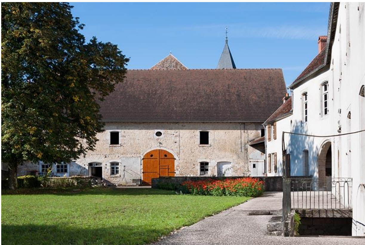
Les écuries et granges situées à l'ouest de la cour