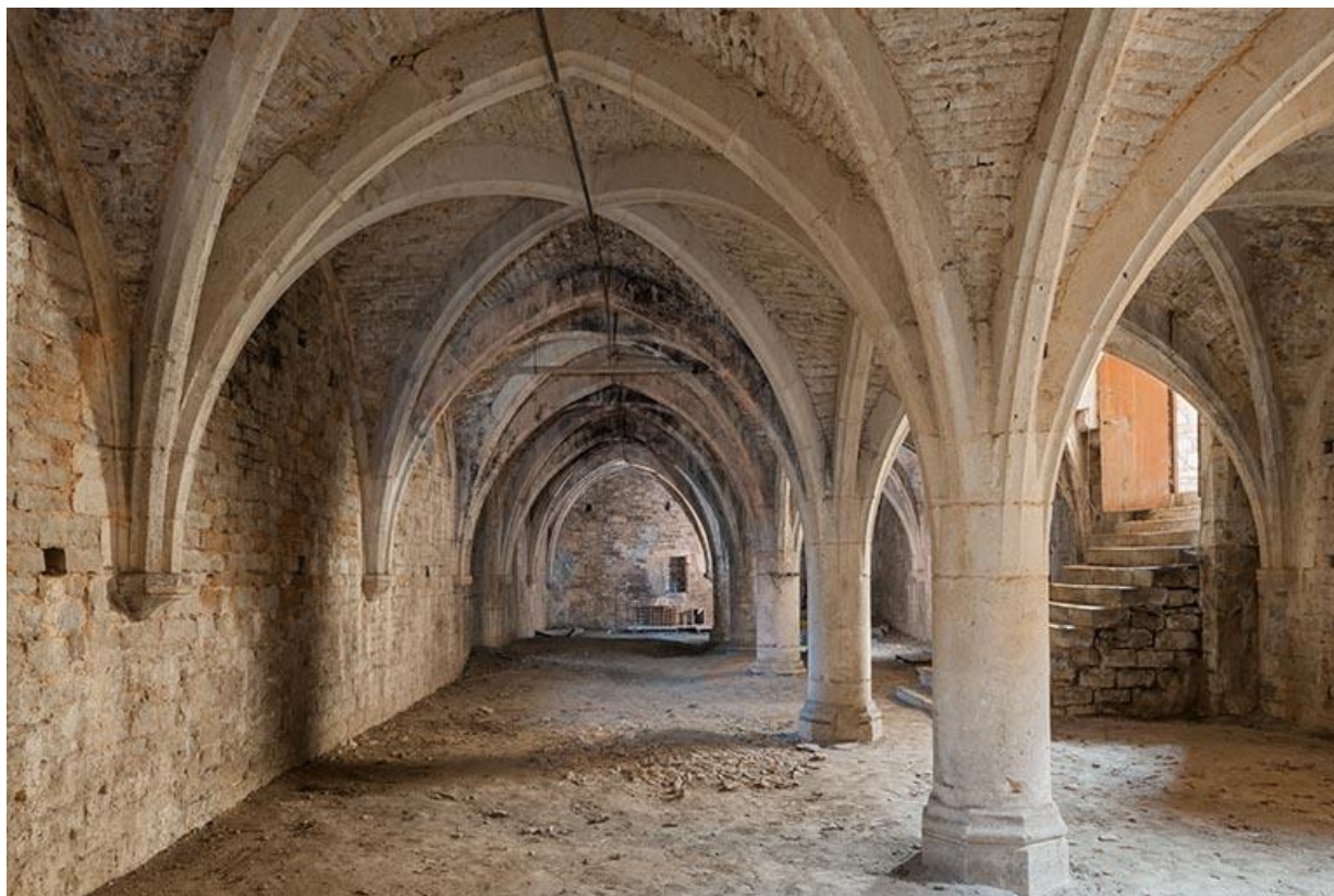
Vue générale de la cave voûtée sur croisées d'ogives