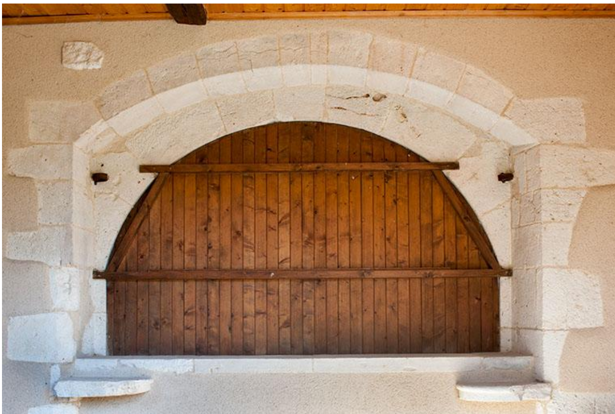
Porche donnant sur la rue Ménans