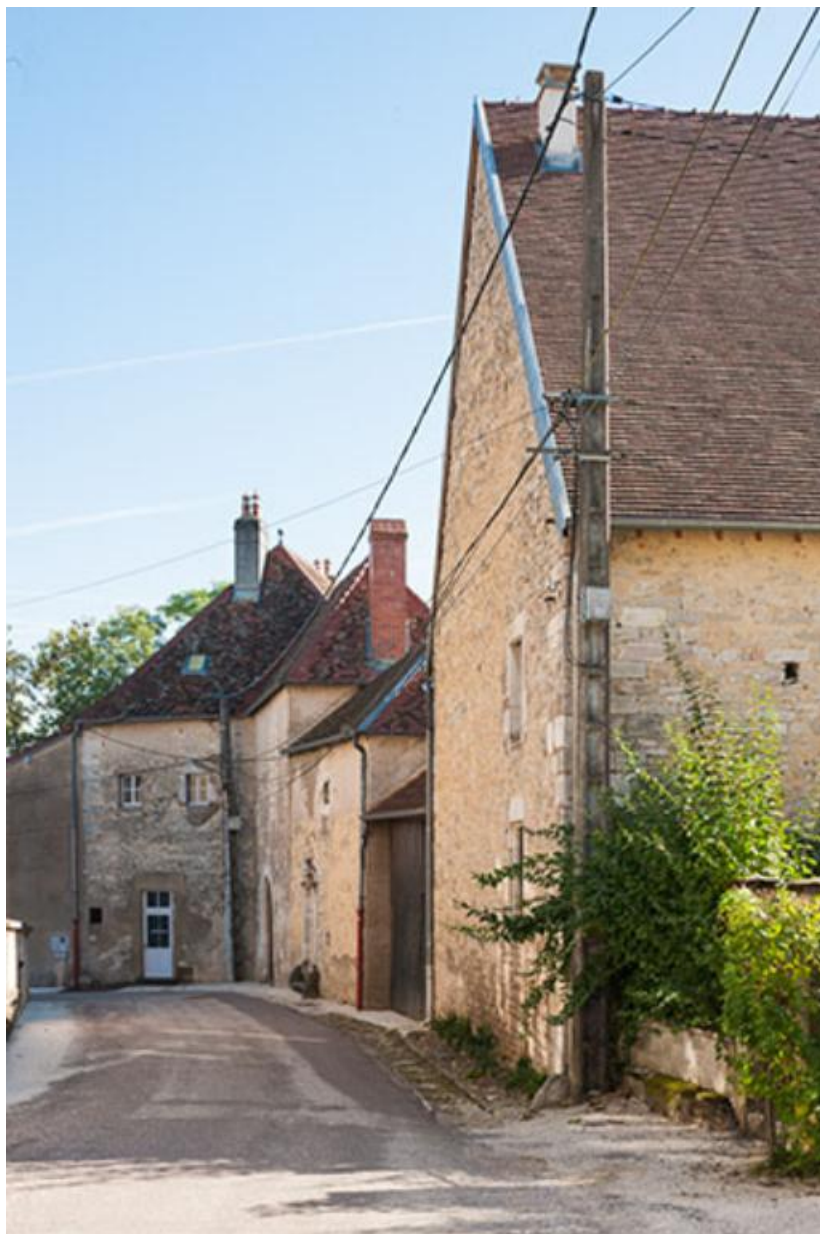
Les bâtiments rue Ménans 70, Gy rue Derrière les Tours