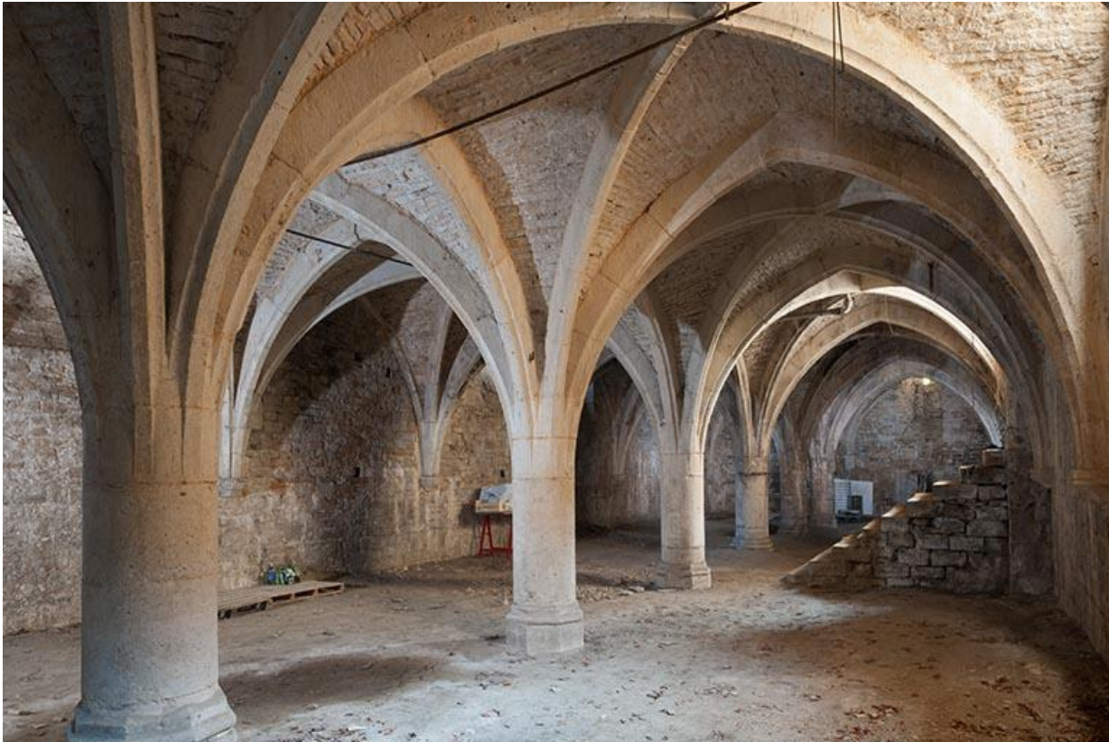
Vue générale de la cave voûtée sur croisées d'ogives