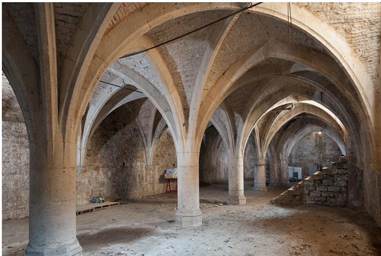
Vue générale de la cave voûtée sur croisées d'ogives