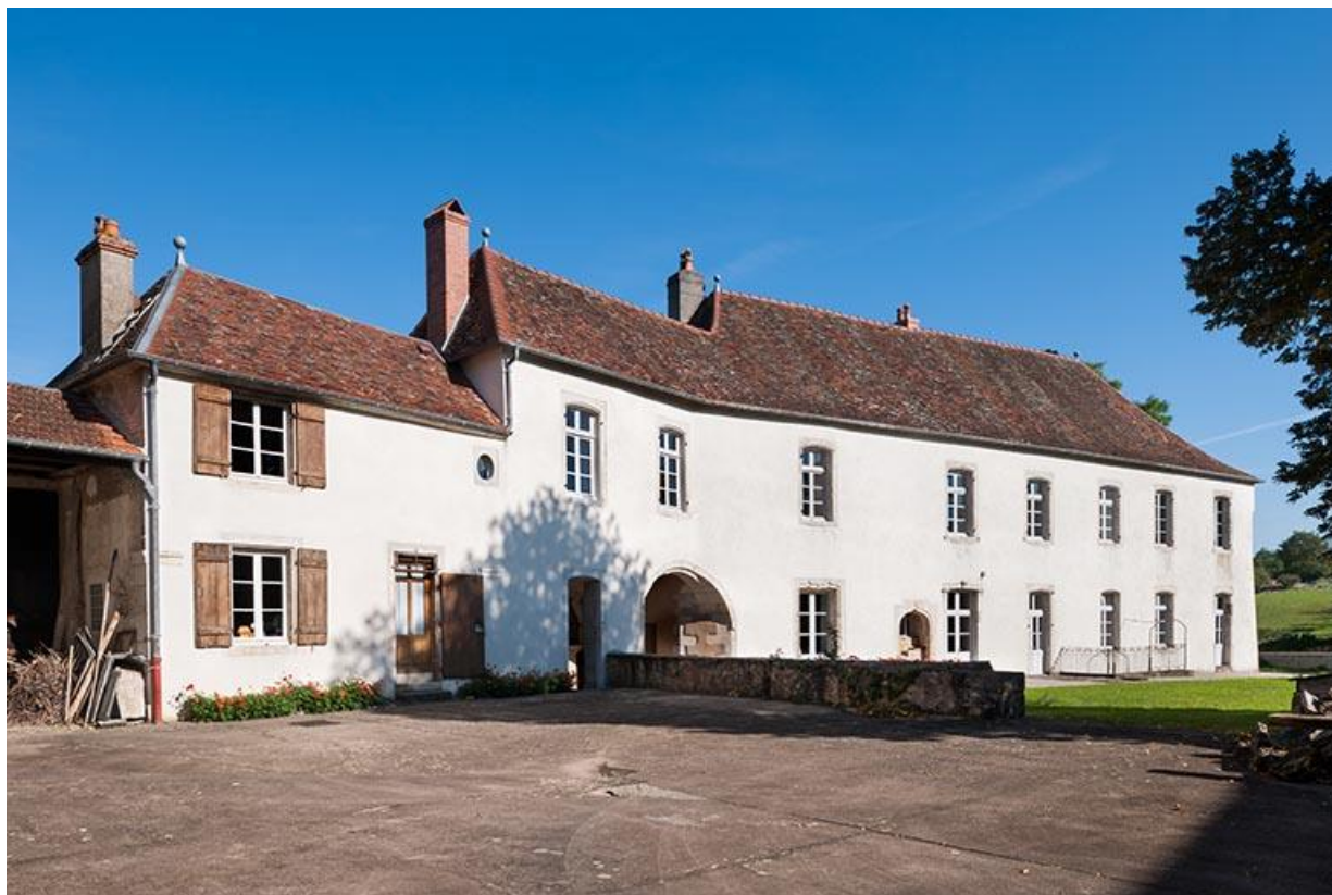
Vue sud-ouest 70, Gy