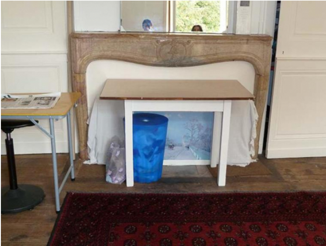
Cheminée en marbre de l'étage (partie ouest du bâtiment)