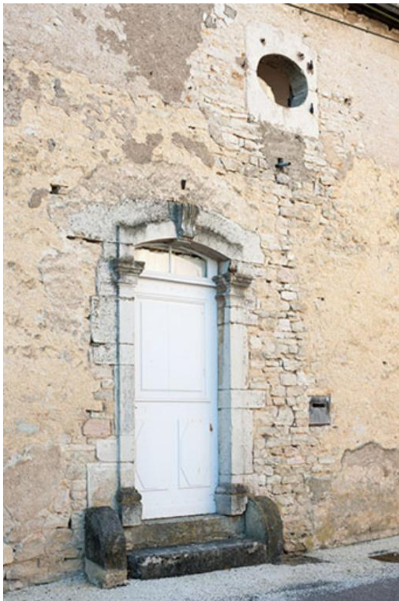
Détail de l'une des portes donnant sur la rue Ménans