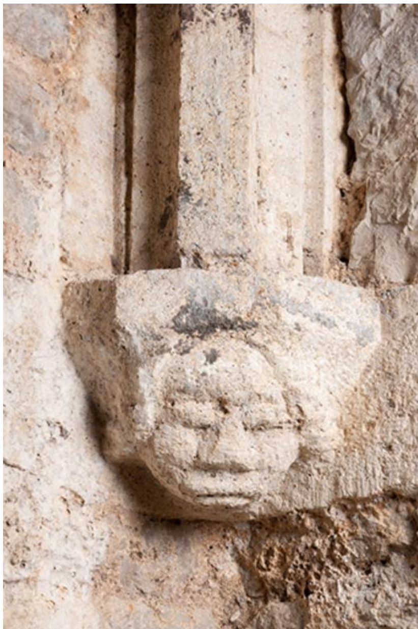
Détail d'un culot de retombée de la voute sur croisées d'ogives