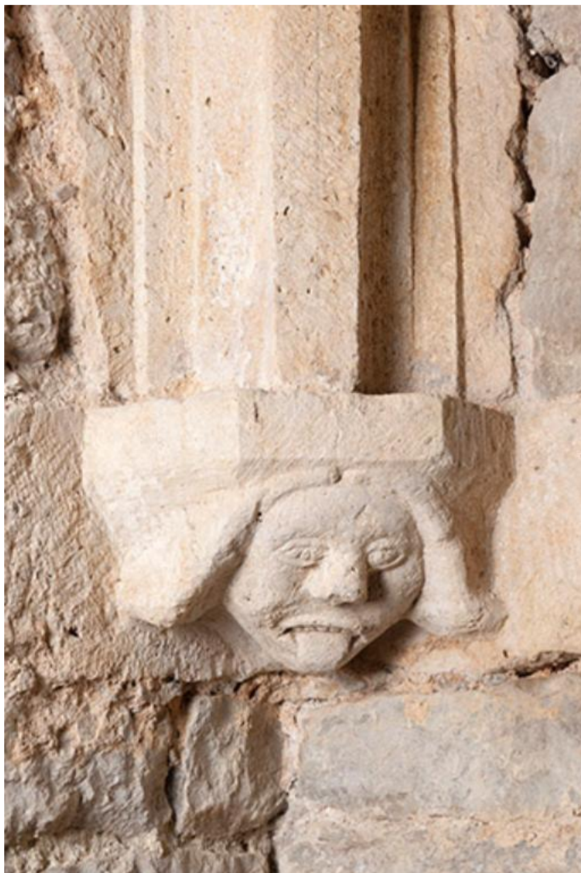
Détail d'un culot de retombée de la voûte sur croisées d'ogives