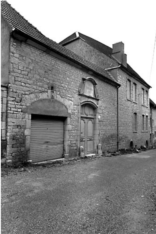
Façade sur rue.