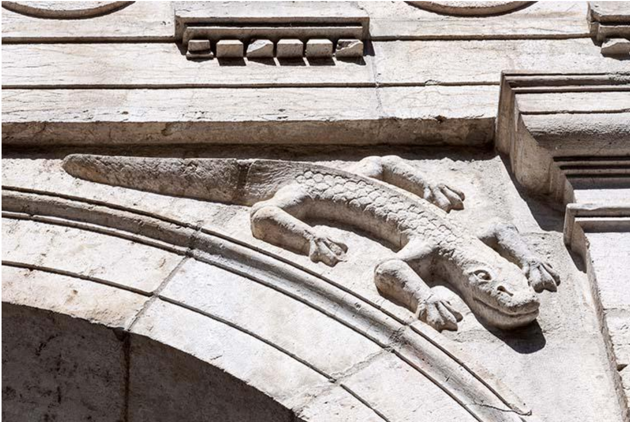
Détail de l'un des reptiles sculptés