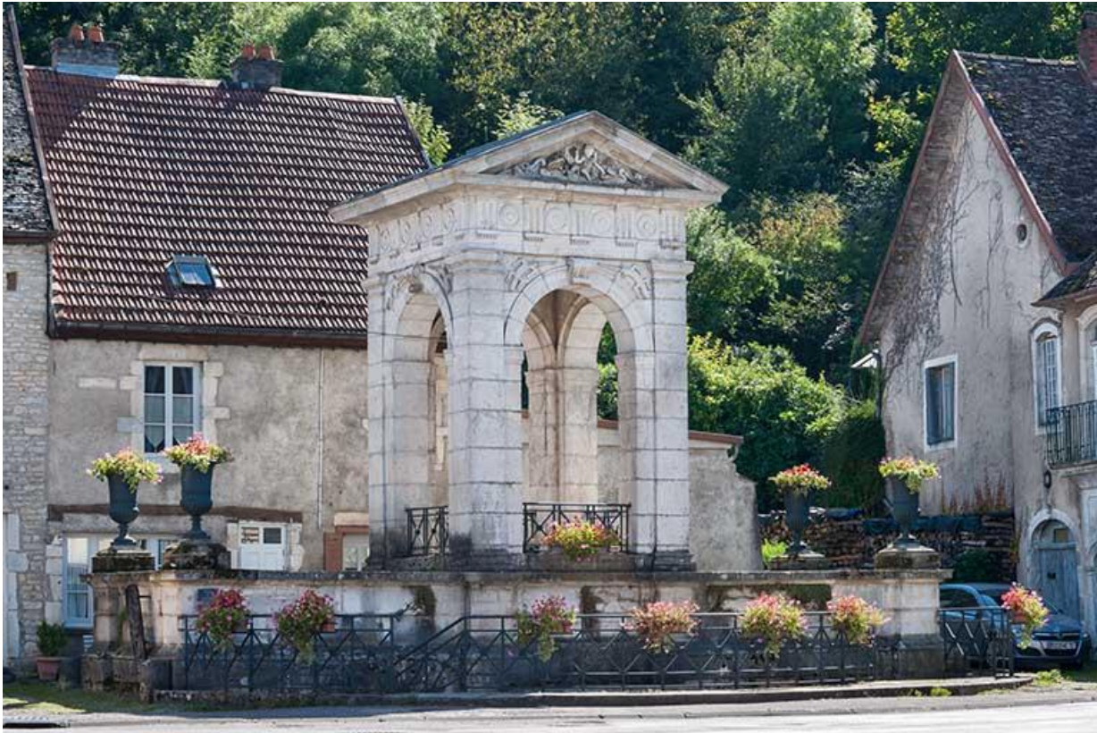
Vue générale nord 70, Gy