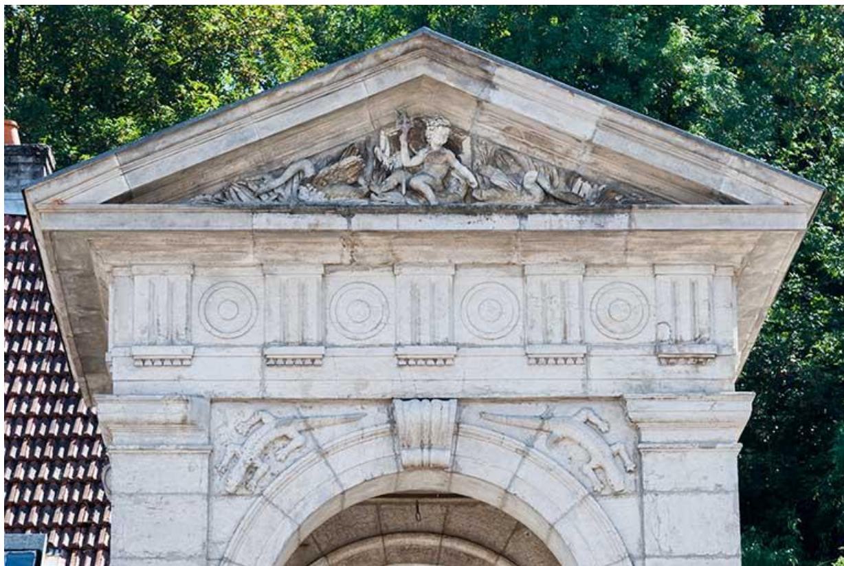
Détail du fronton triangulaire