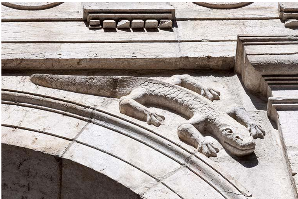
Détail de l'un des reptiles sculptés