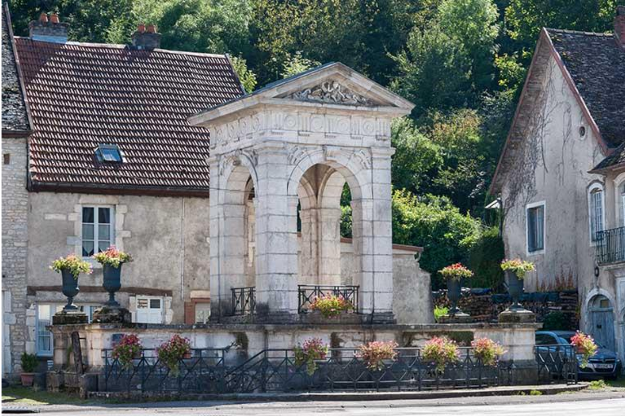
Vue générale nord 70, Gy