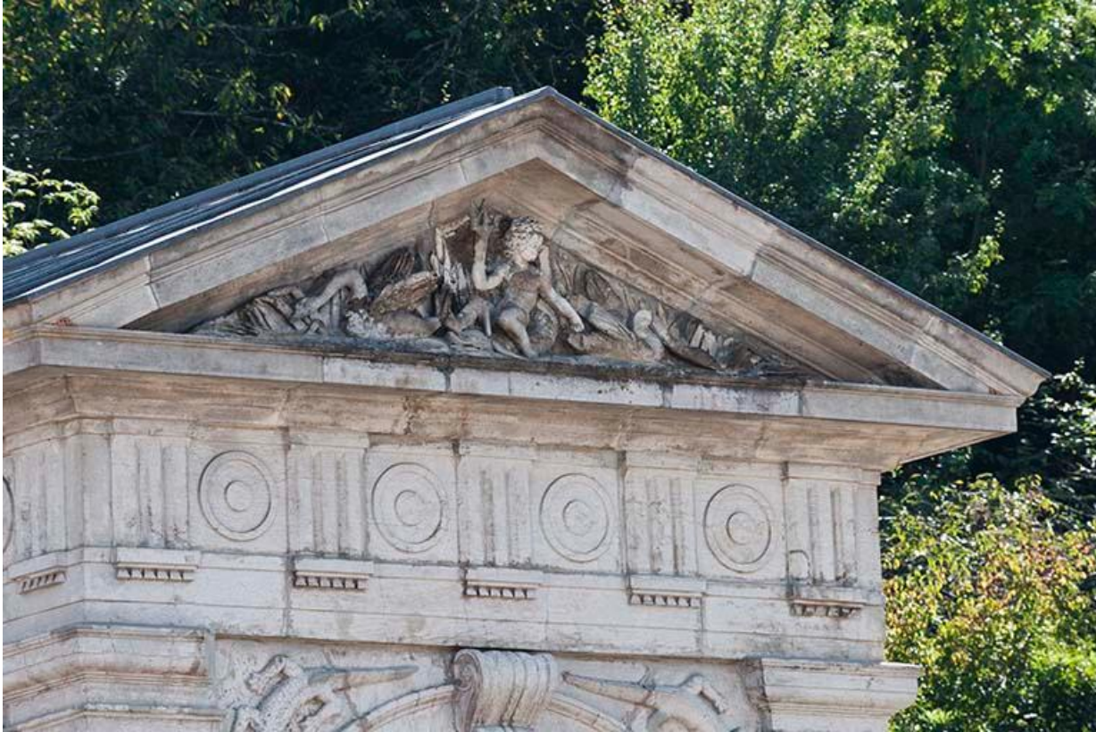
Détail du fronton triangulaire