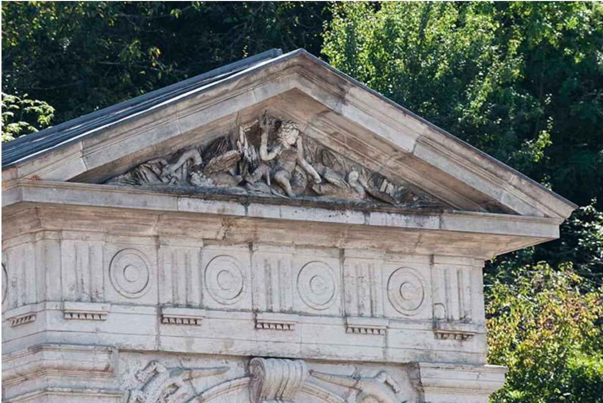
Détail du fronton triangulaire