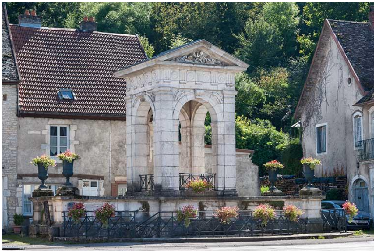
Vue générale nord 70, Gy