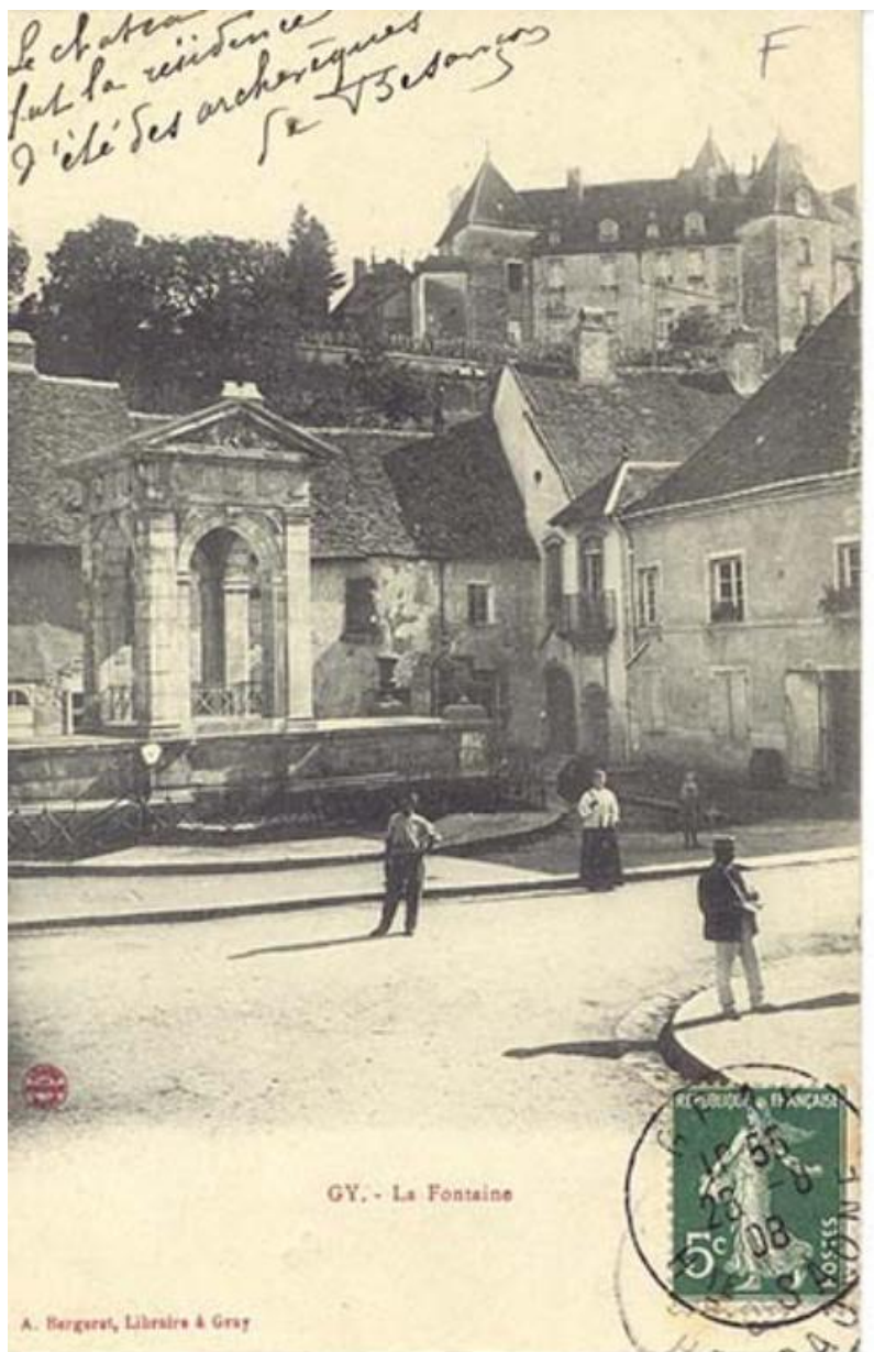
La fontaine sur une carte postale ancienne