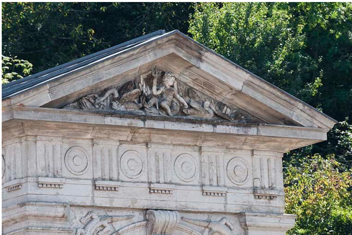
Détail du fronton triangulaire