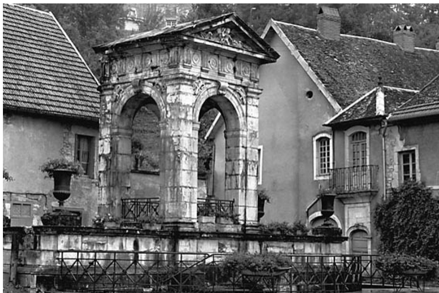
Vue d'ensemble. 70, Gy Grande Rue