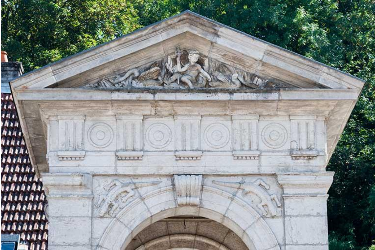
Détail du fronton triangulaire