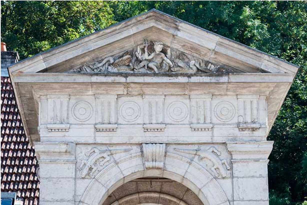
Détail du fronton triangulaire