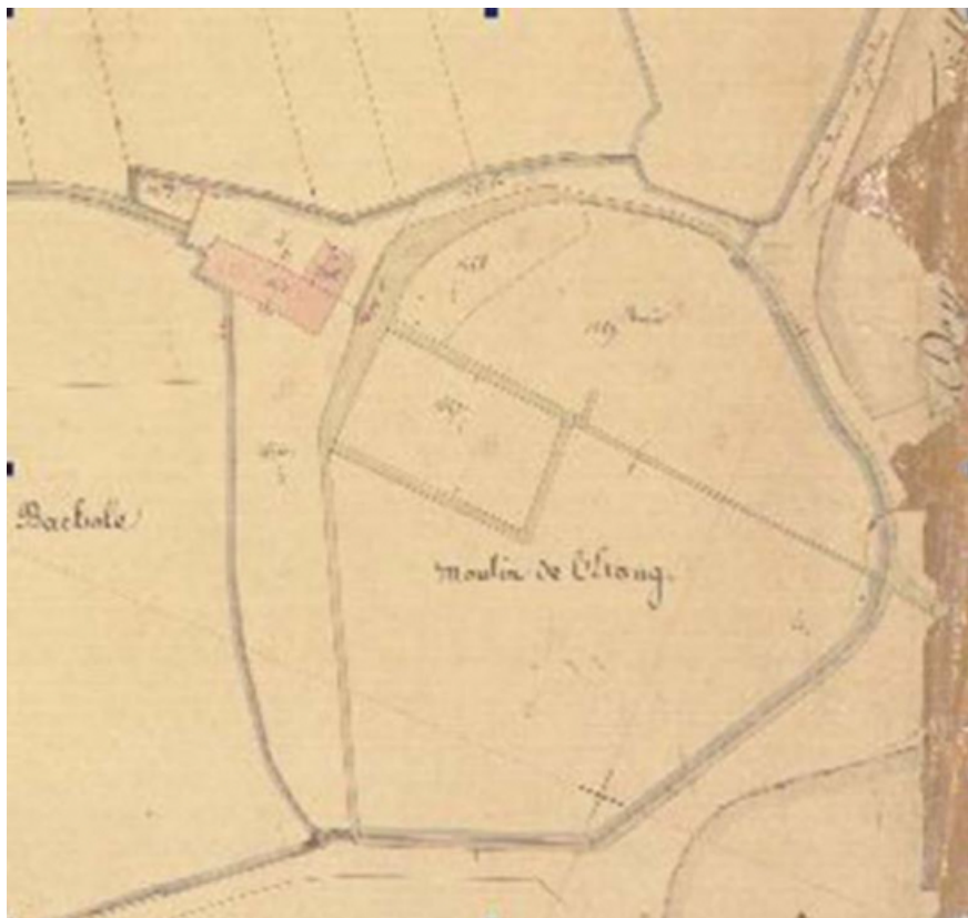
Le moulin de l'étang sur le cadastre napoléonien de 1837 70, Gy