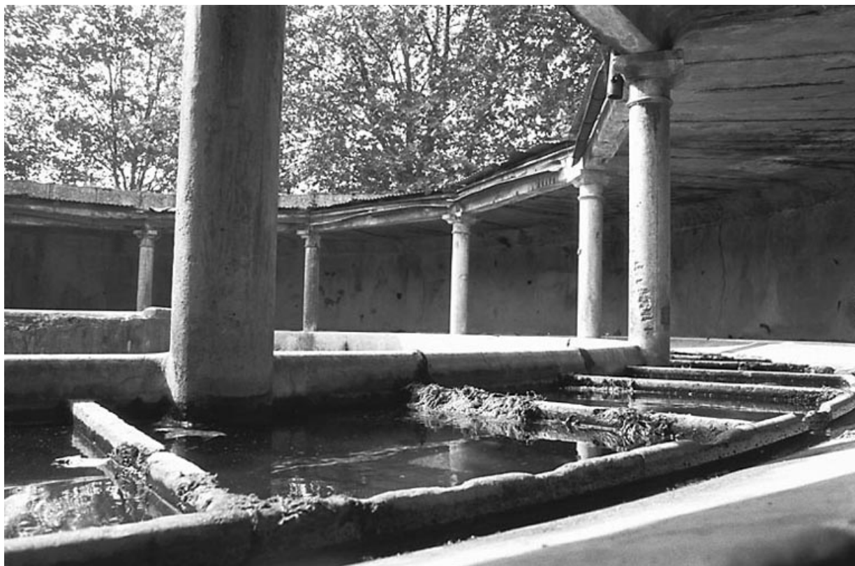
Vue de détail : compartimentage du bassin pour les lessives individuelles.