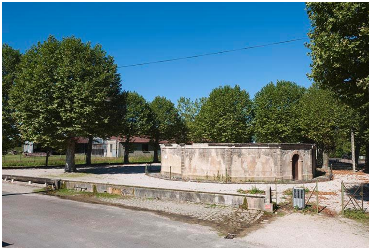
Vue générale sud-est 70, Gy Place du Lavoir