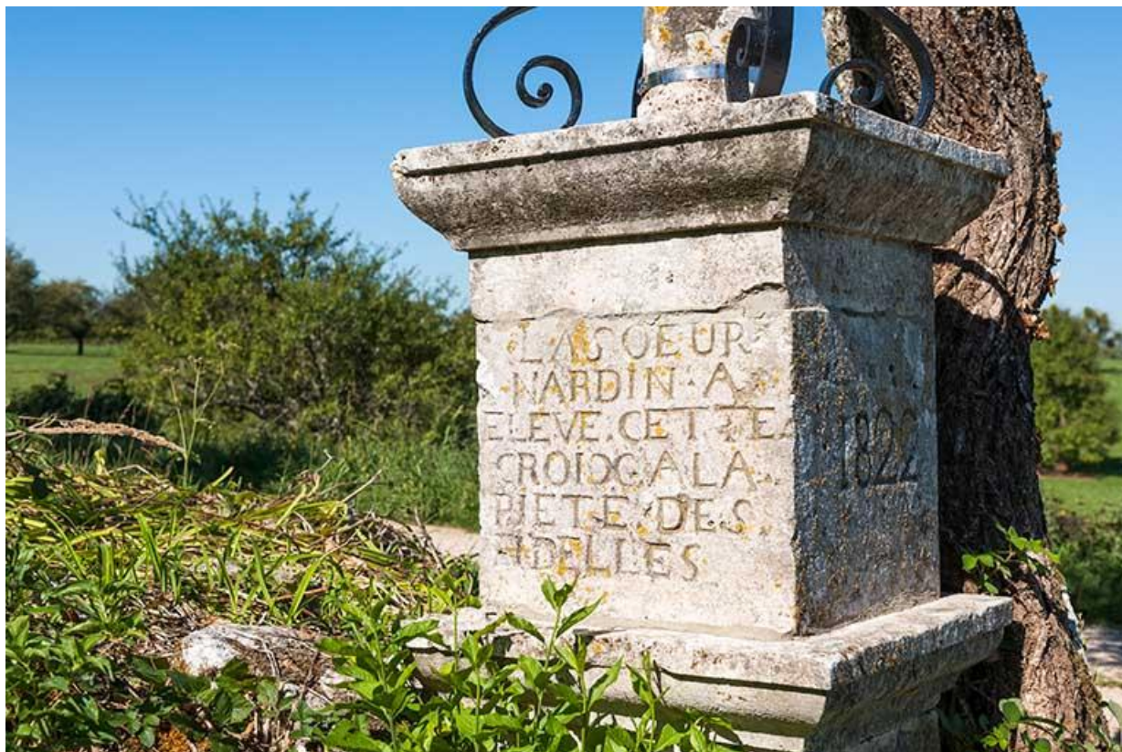
Détail du socle