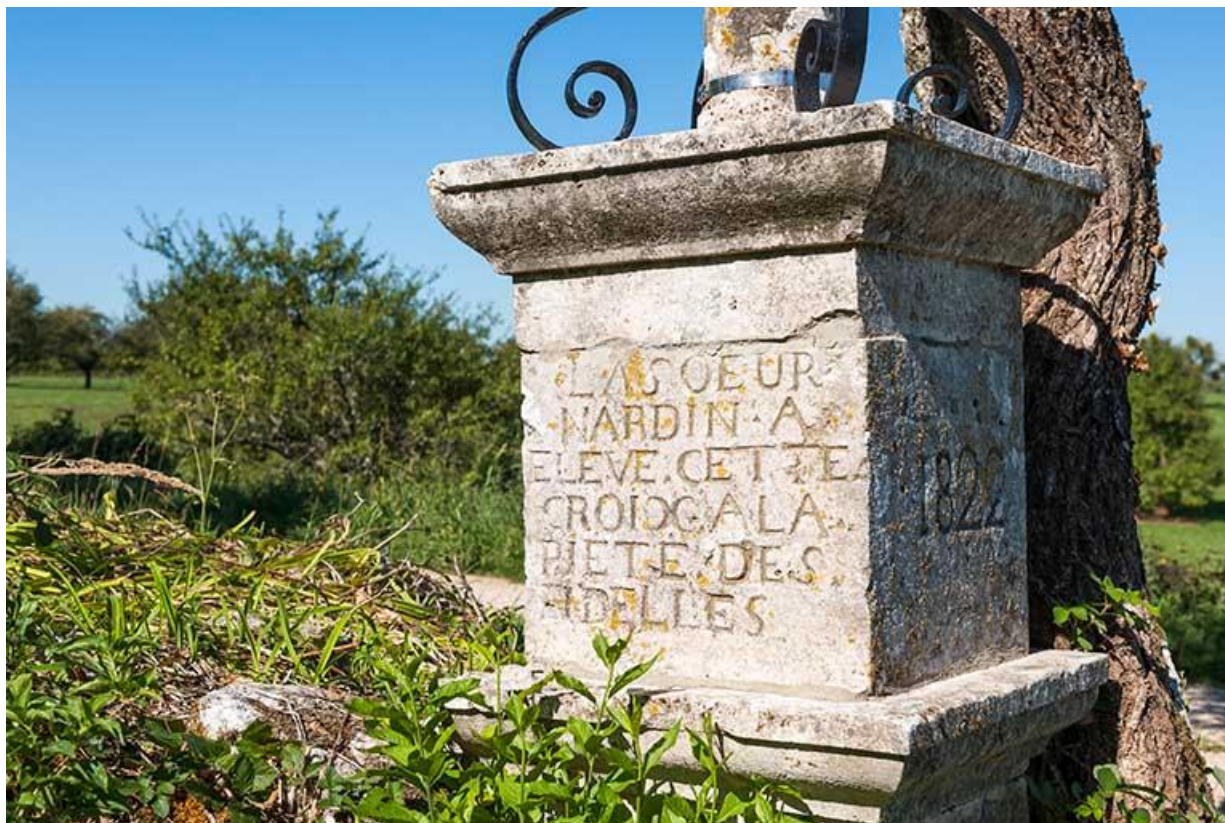
Détail du socle 70, Gy