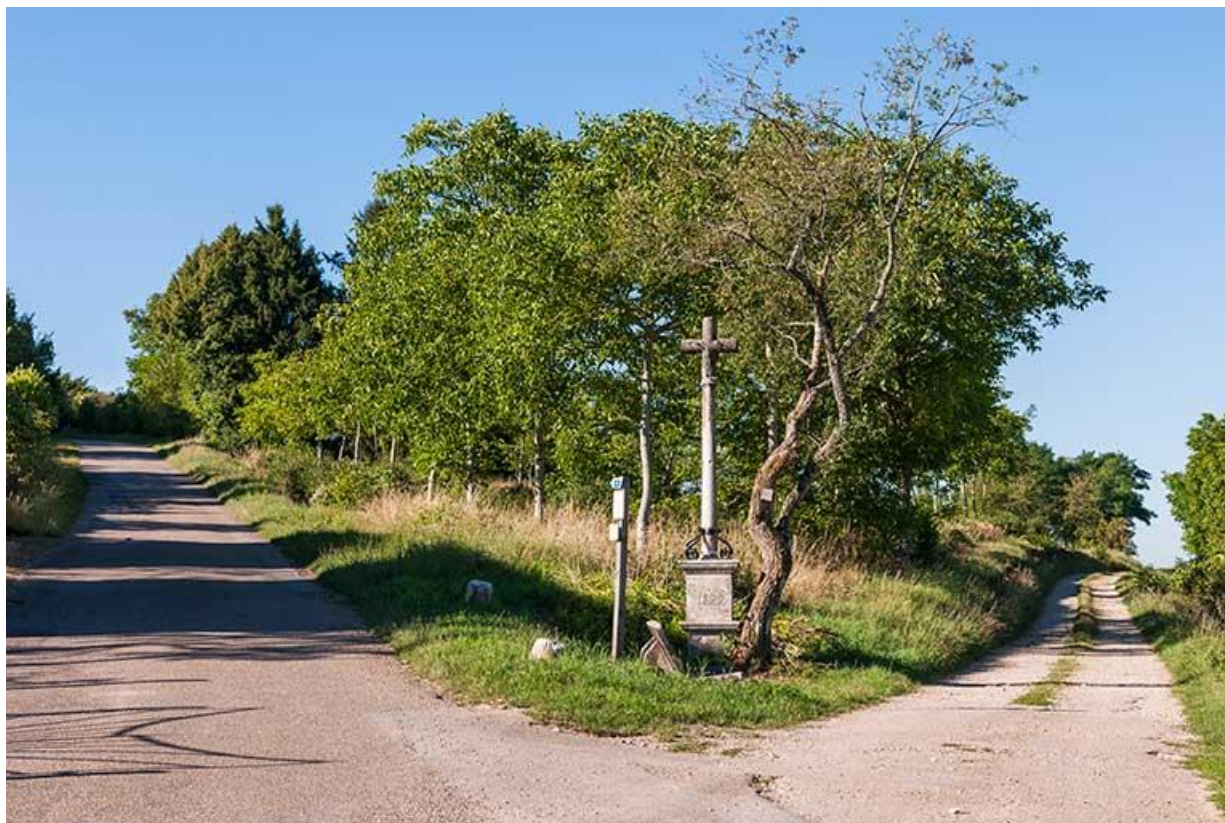
Vue générale nord-est 70, Gy