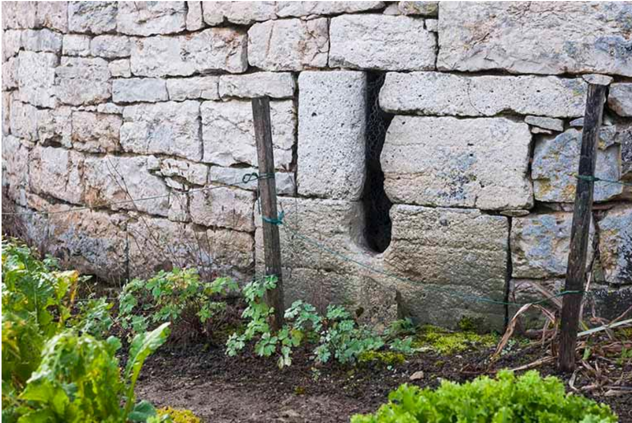
Détail de l'une des meurtrières de la tour 70, Gy