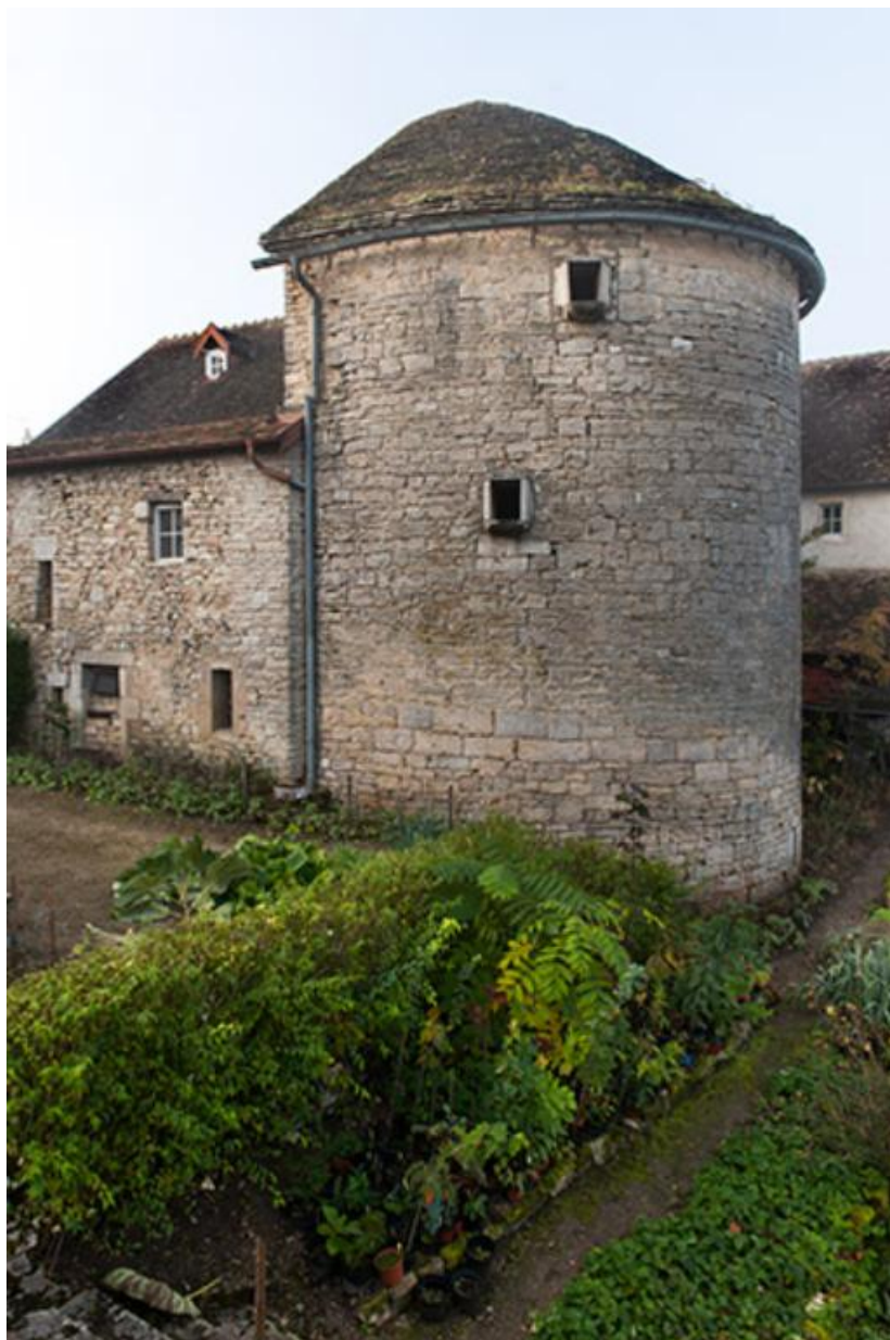
Tour de l'enceinte urbaine