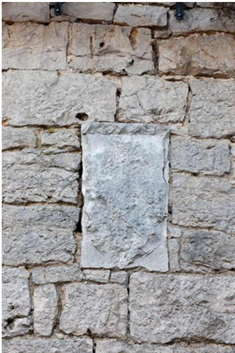
Détail d'un blason martelé situé sur la tour 70, Gy