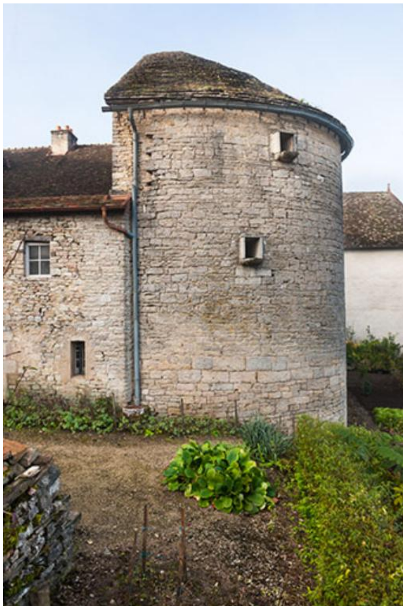
Dernière tour de l'enceinte urbaine