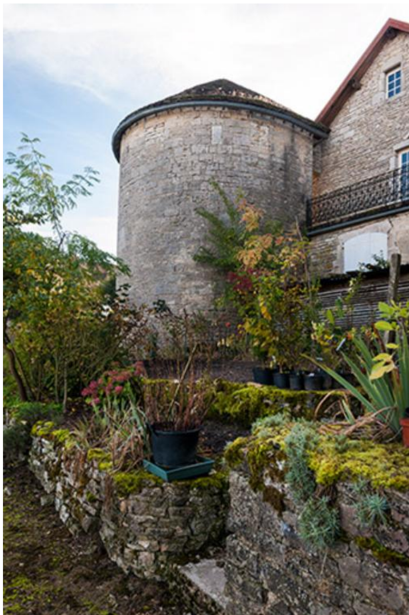
Dernière tour de l'enceinte urbaine, vue nord-ouest 70, Gy