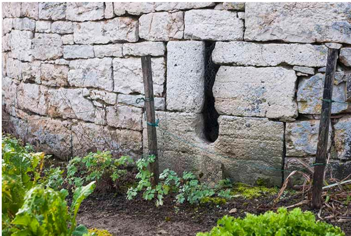
Détail de l'une des meurtrières de la tour 70, Gy