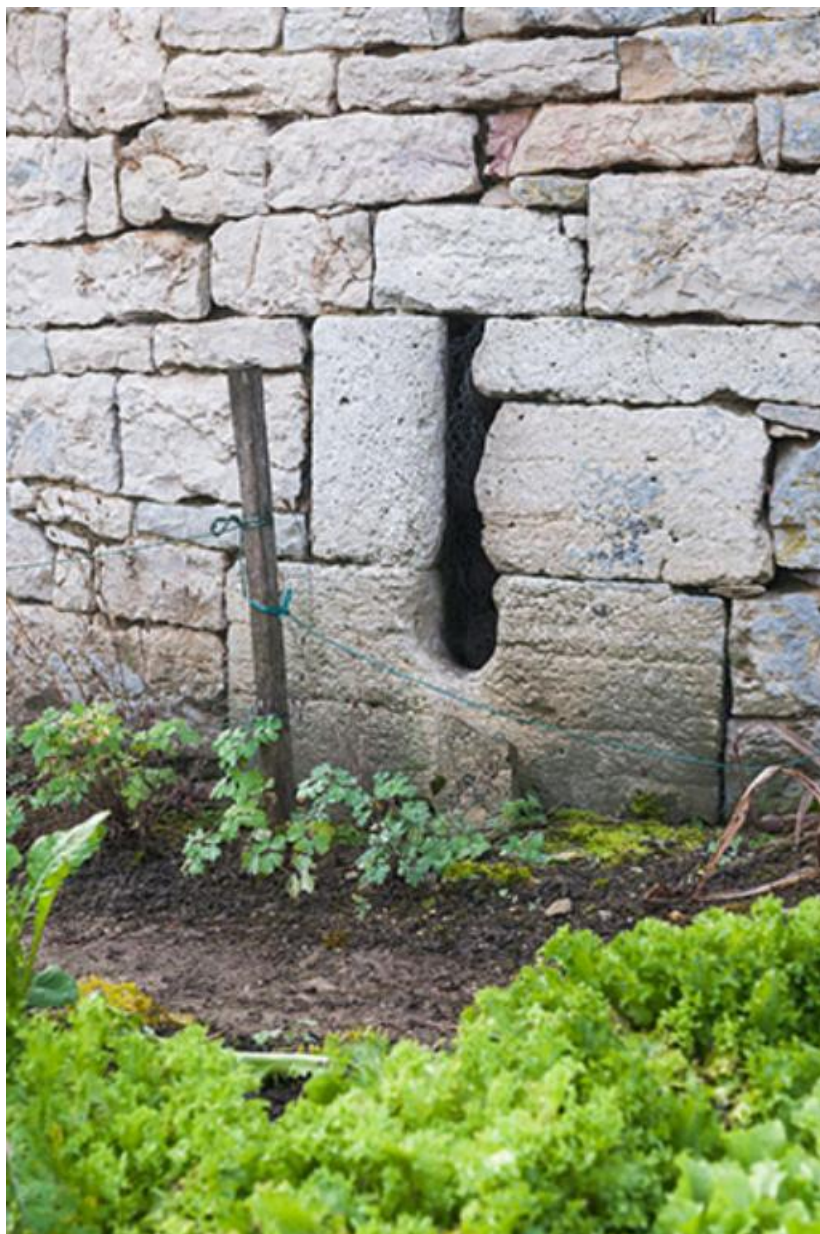
Détail de l'une des meurtrières de la tour 70, Gy