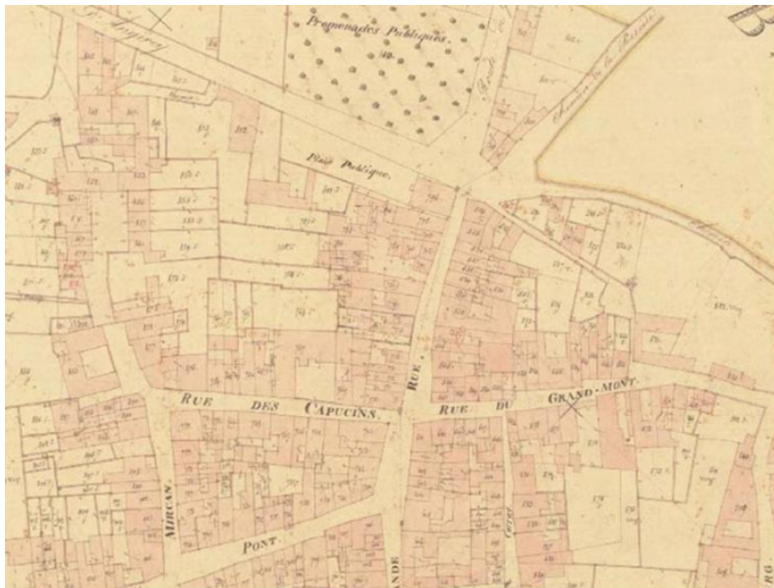
La ville basse sur le cadastre de 1837 (partie est) 70, Gy