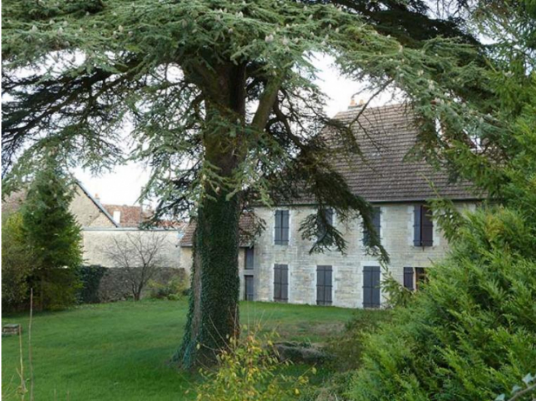
Façade postérieure (ouest)