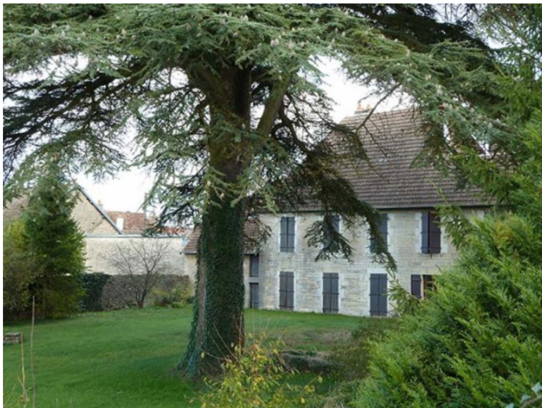
Façade postérieure (ouest)