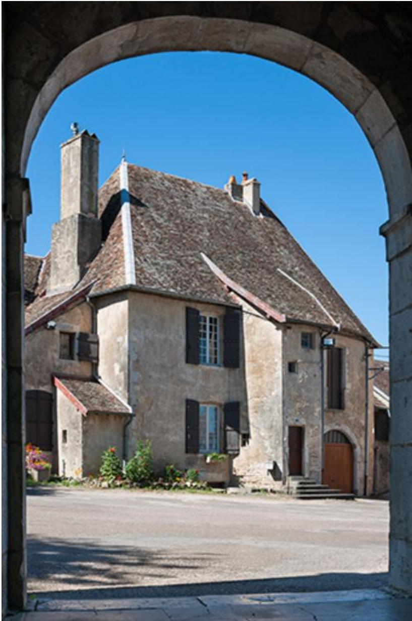
Vue depuis le porche de l'église