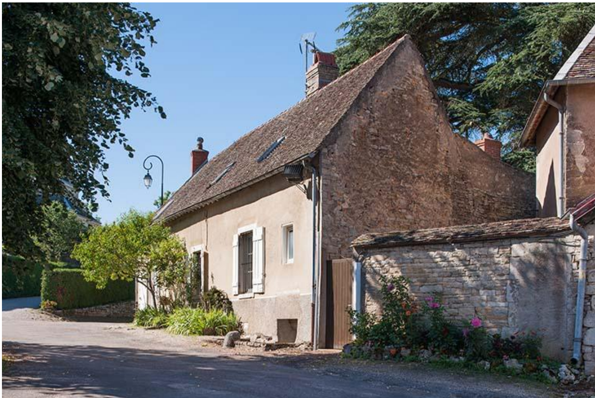
Bâtiment situé à l'ouest du presbytère