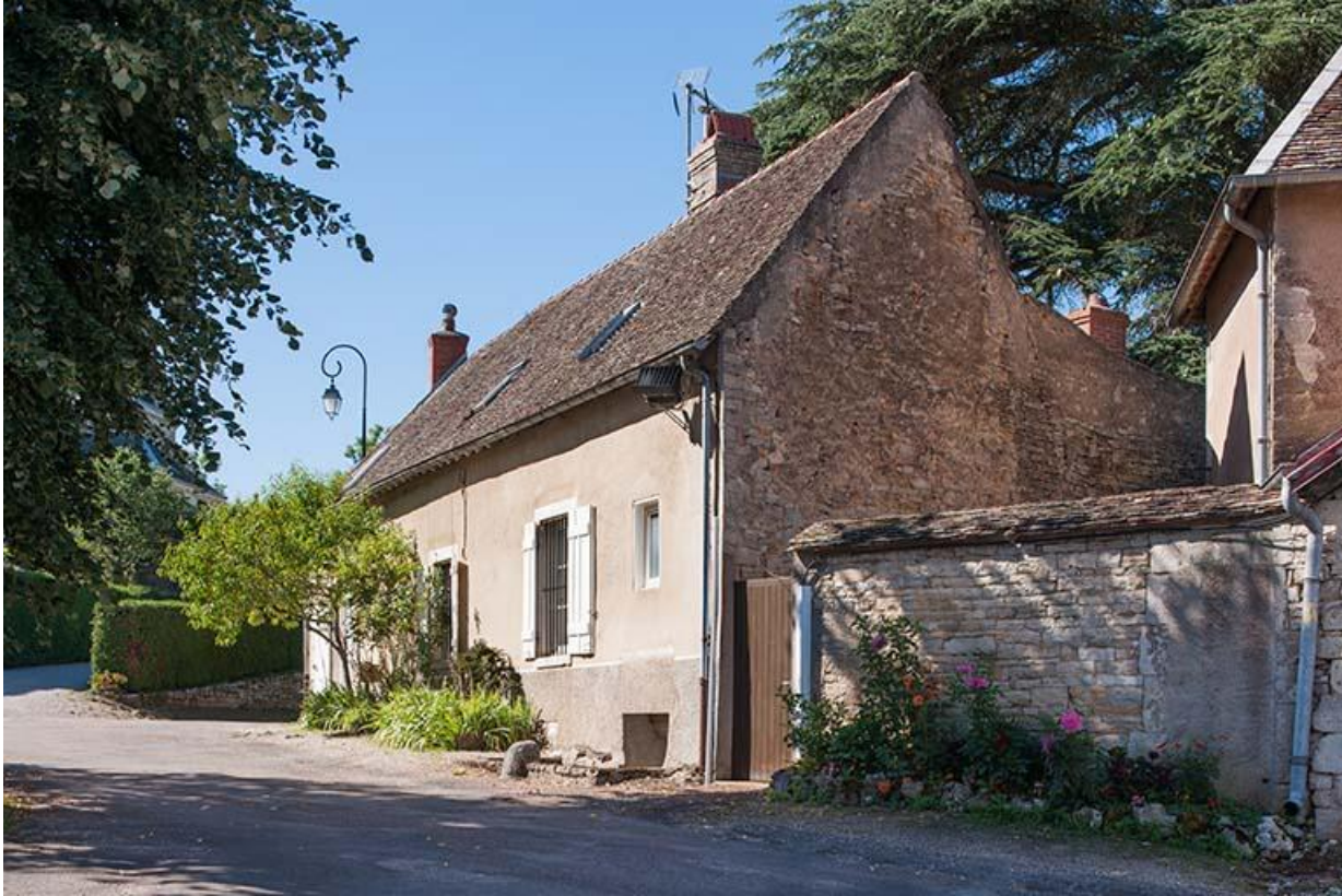
Bâtiment situé à l'ouest du presbytère