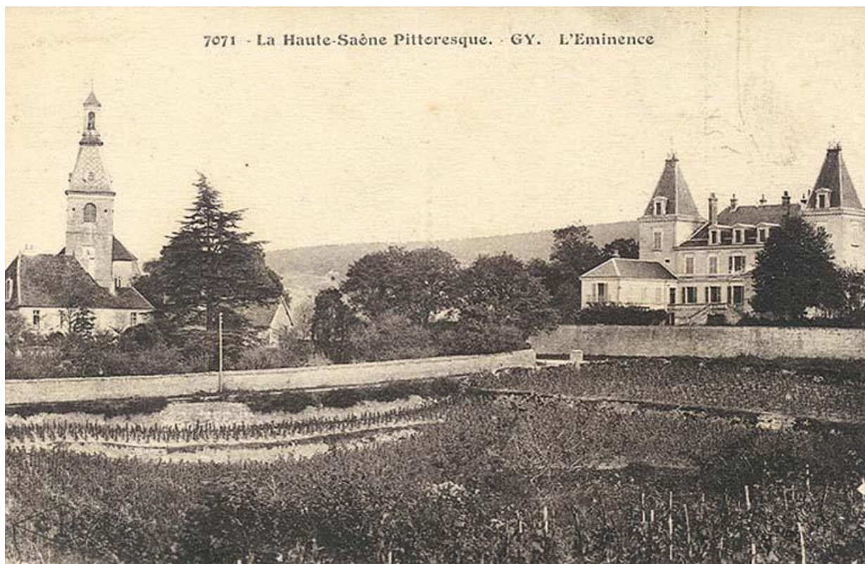
L'église sur une carte postale ancienne