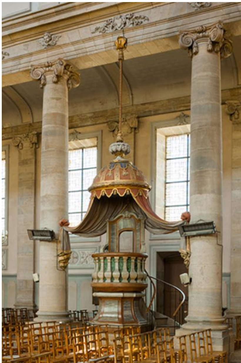
La chaire à prêcher 70, Gy rue de l' Eglise