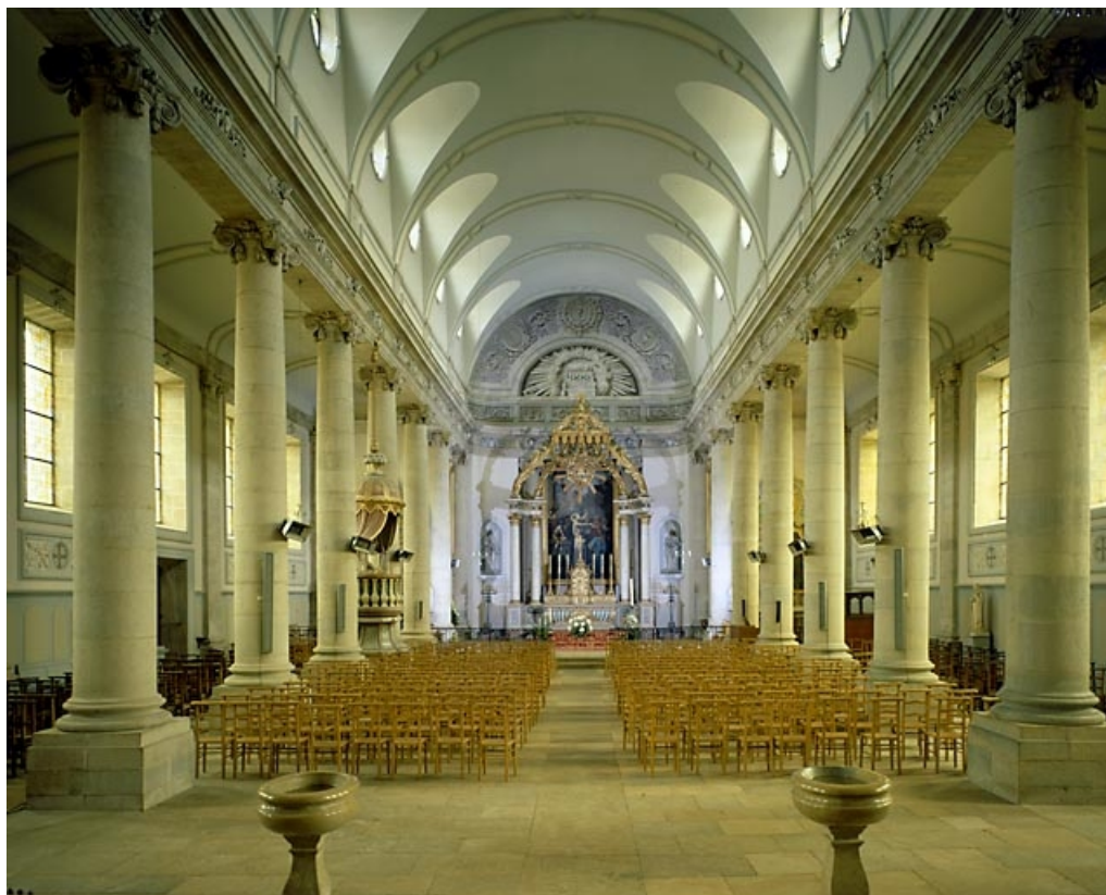
Vue de la nef et du chœur.