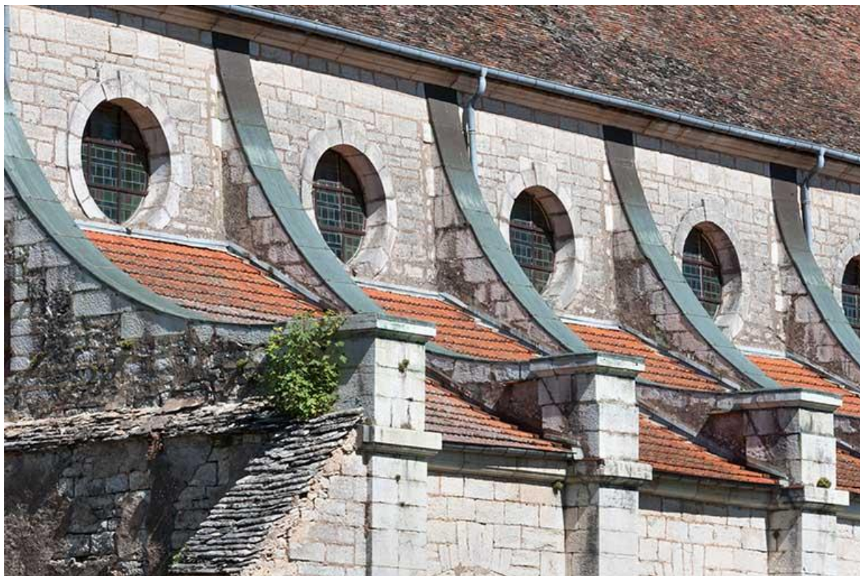
Détail des oculi de la façade sud