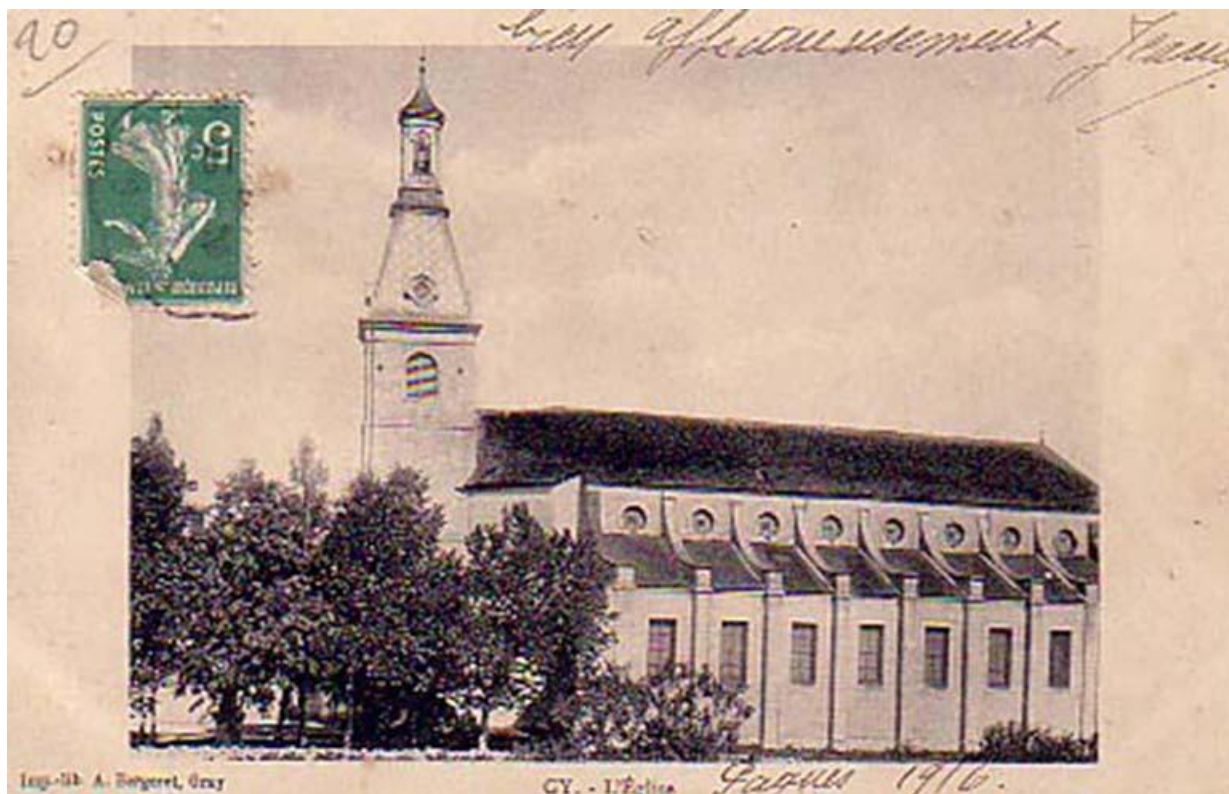
Vue sud-ouest de l'église sur une carte postale ancienne