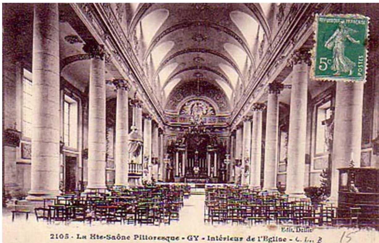
L'intérieur de l'église sur une carte postale ancienne