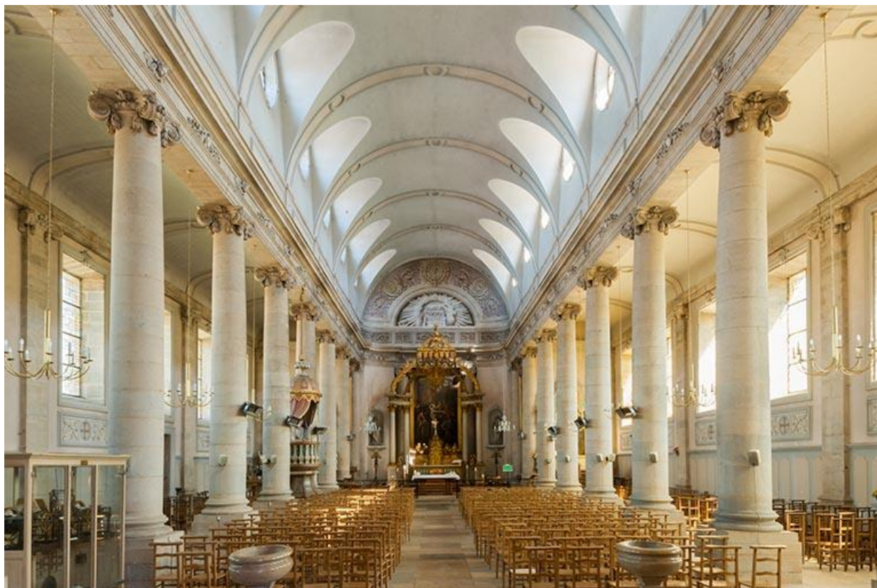
Vue générale de la nef depuis l'ouest