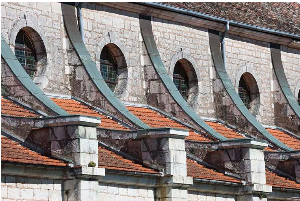
Détail des oculi de la façade sud