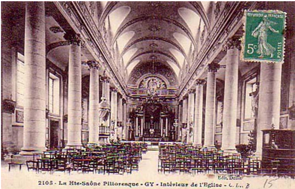
L'intérieur de l'église sur une carte postale ancienne