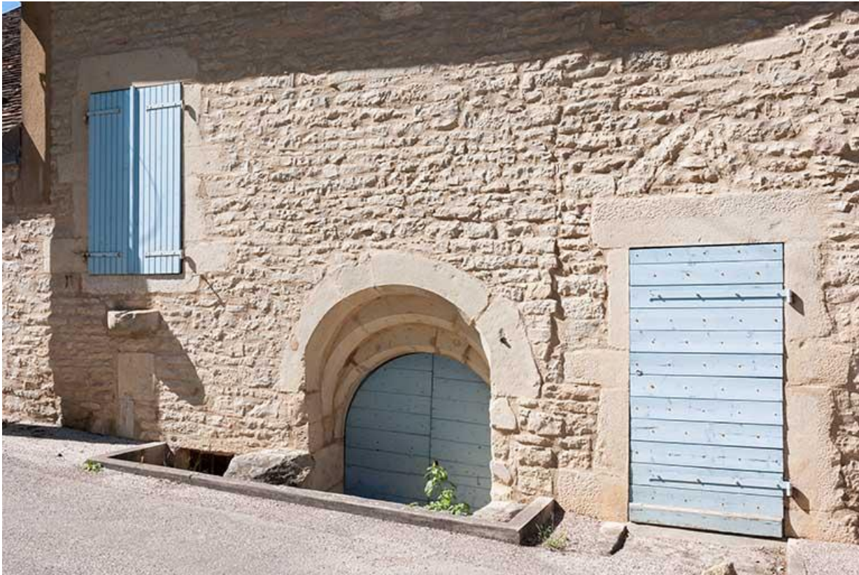
Détail de la porte d'entrée dans la cave 70, Gy