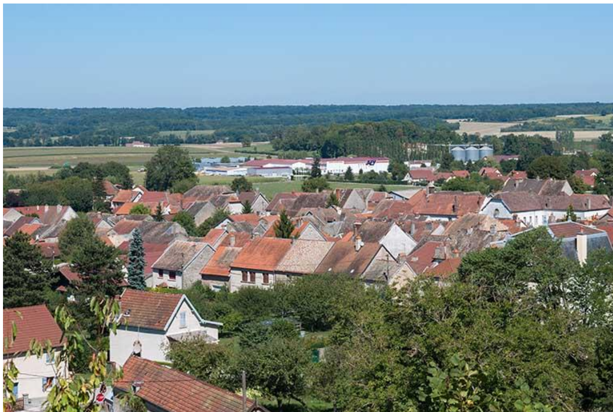
Vue des constructions de la partie basse de la ville 70, Gy