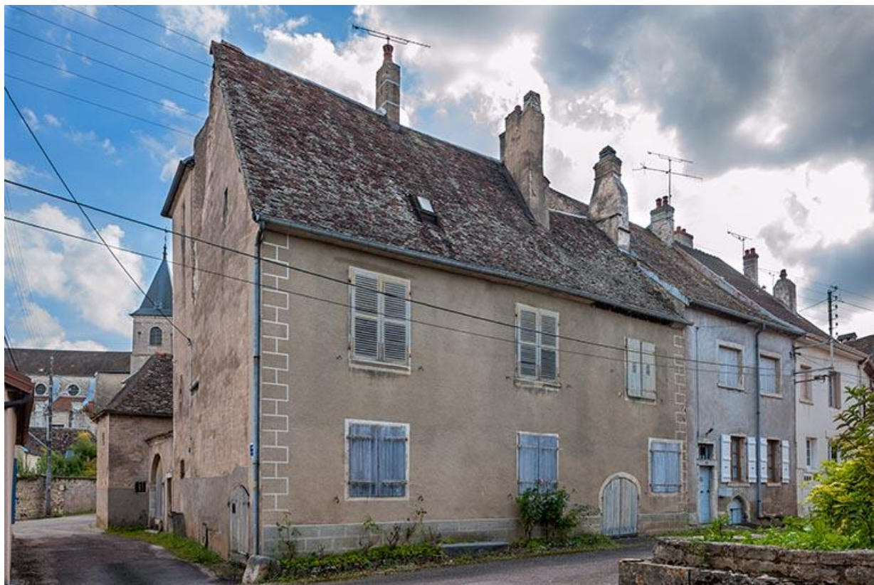
Maisons de la rue du Bourg 70, Gy