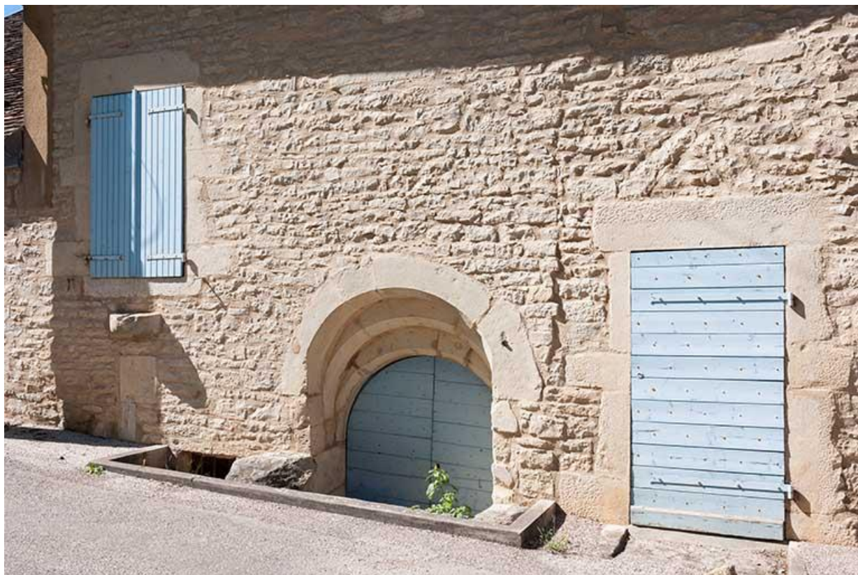
Détail de la porte d'entrée dans la cave 70, Gy