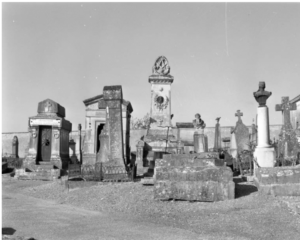
Vue partielle de la partie ancienne.