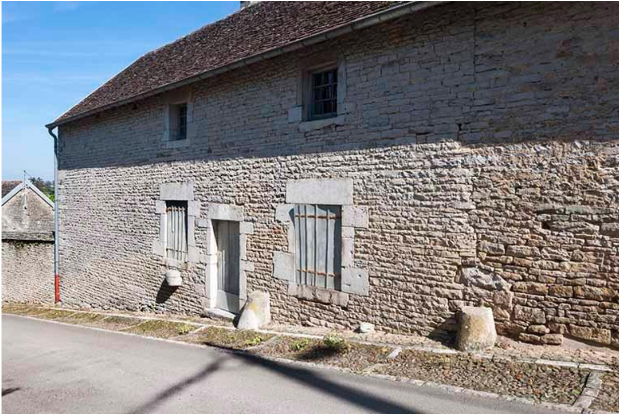
Ferme de la rue du Grand Mont 70, Gy