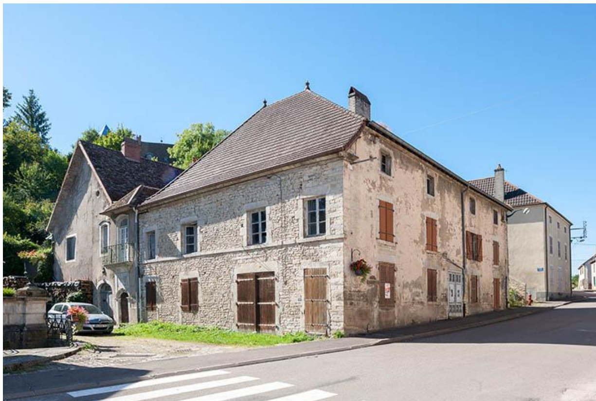
Maisons de la Grande Rue 70, Gy