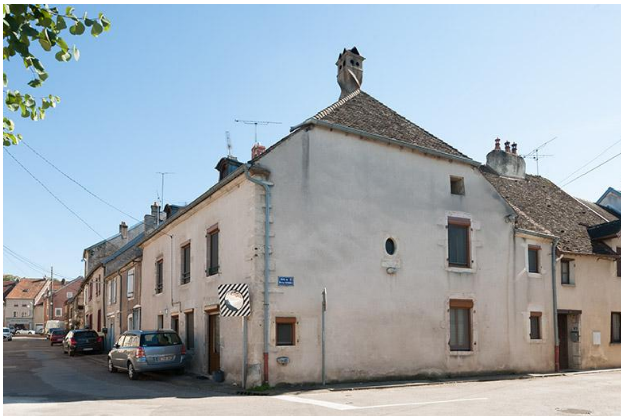
Maison située rue du 10 Septembre 70, Gy