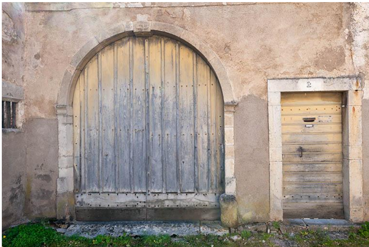
Détail du porche situé rue de l'Eglise 70, Gy