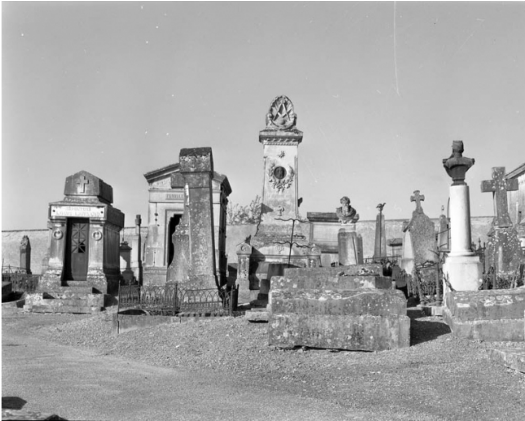
Vue partielle de la partie ancienne.