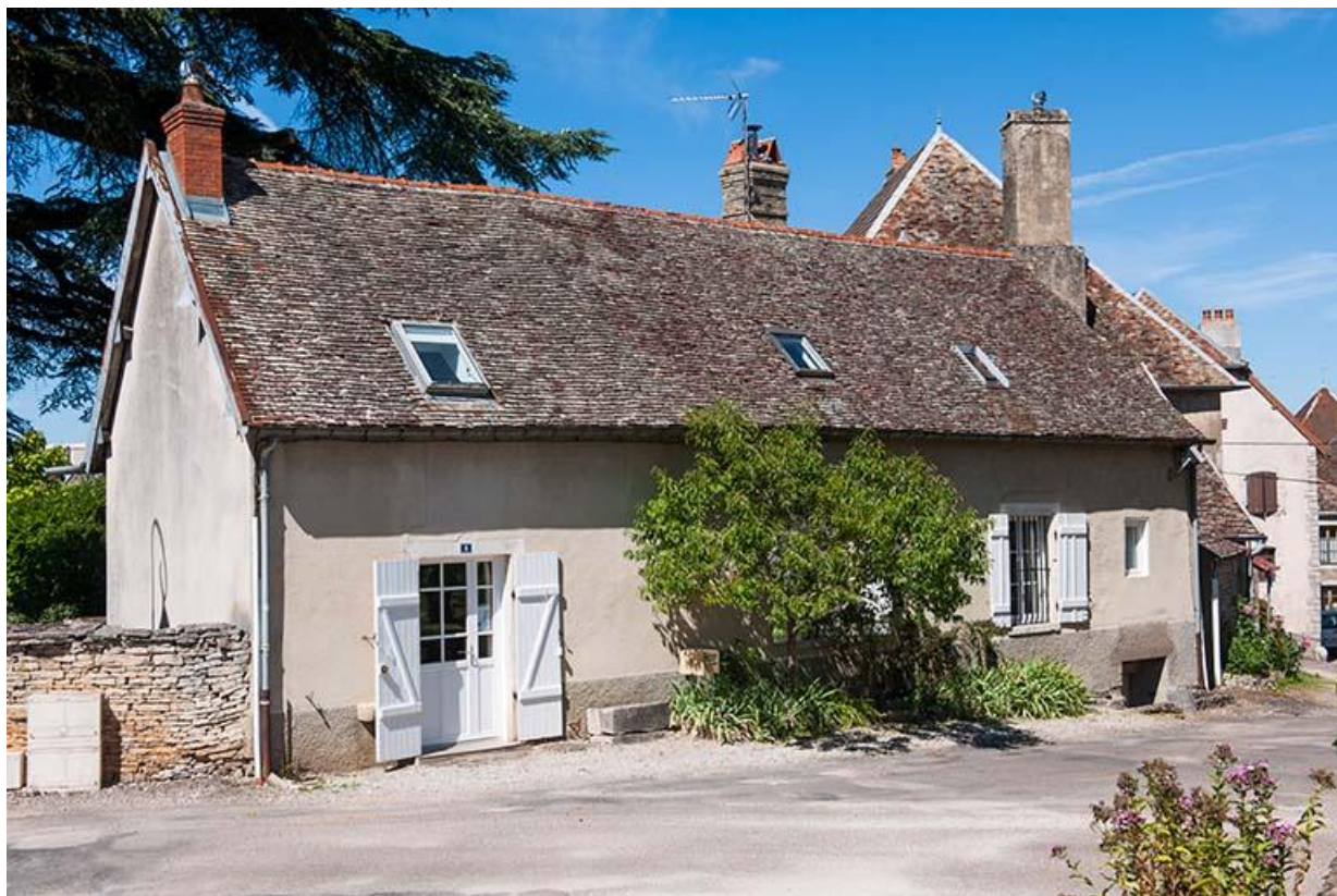
Maison située place de l'Eglise 70, Gy