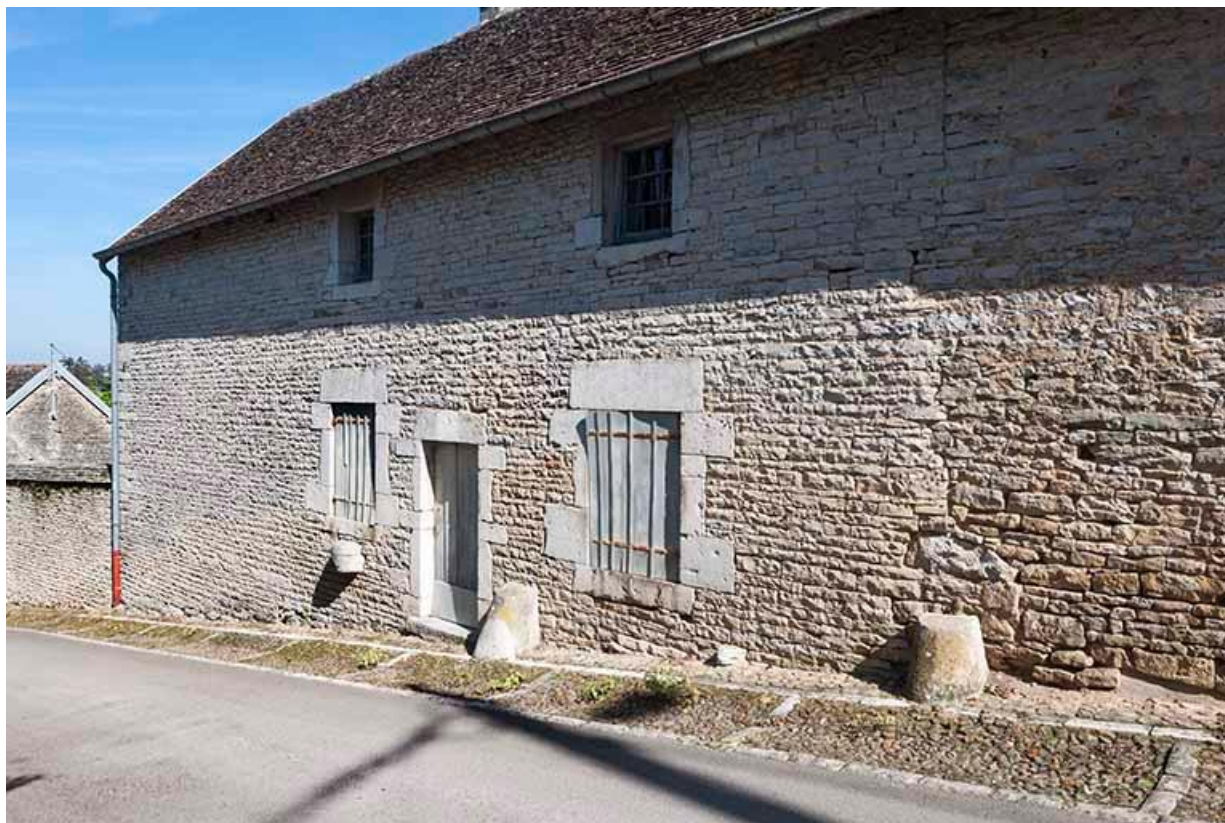
Ferme de la rue du Grand Mont 70, Gy