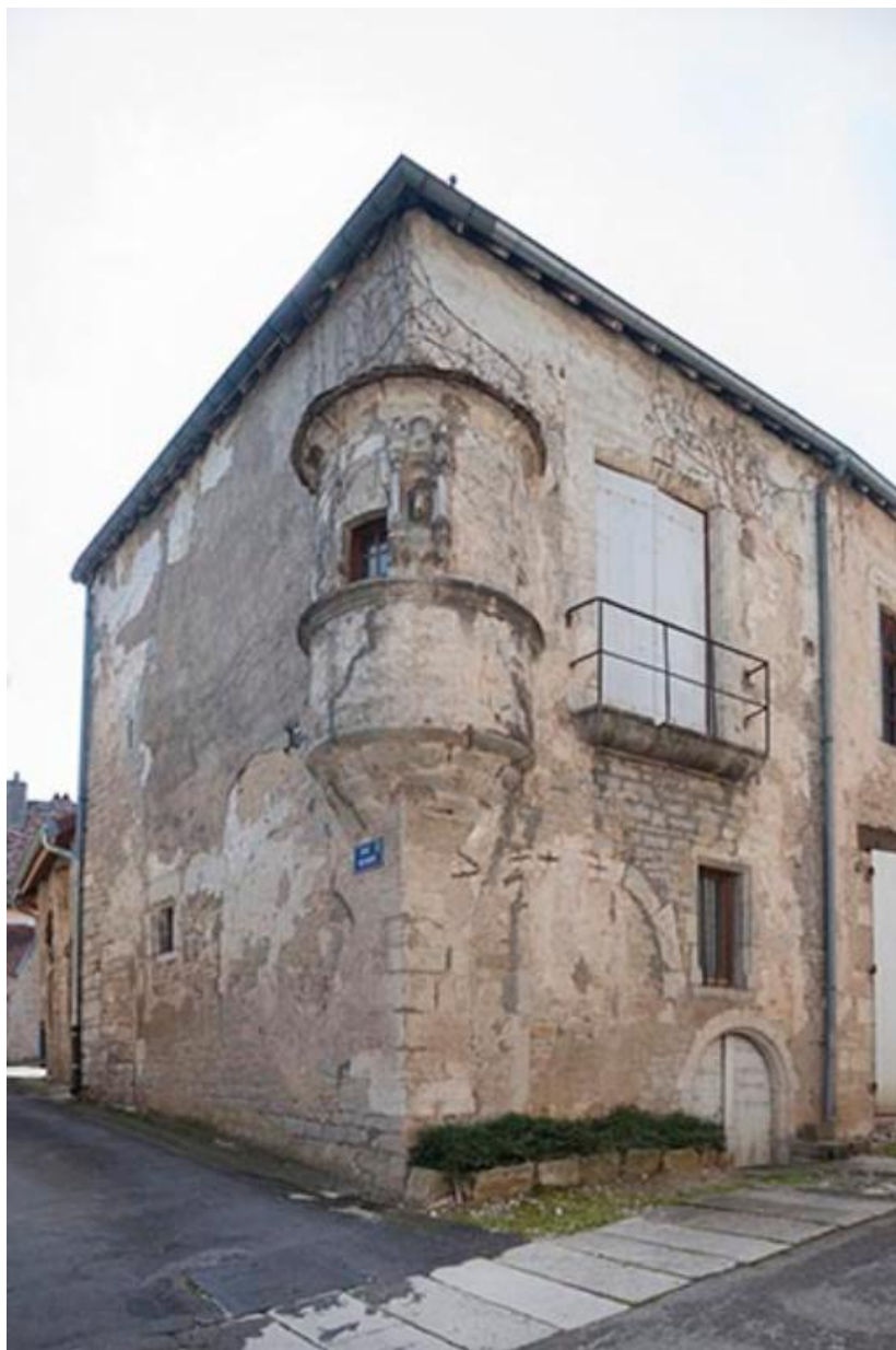
Maison du 1 rue du Bourg 70, Gy