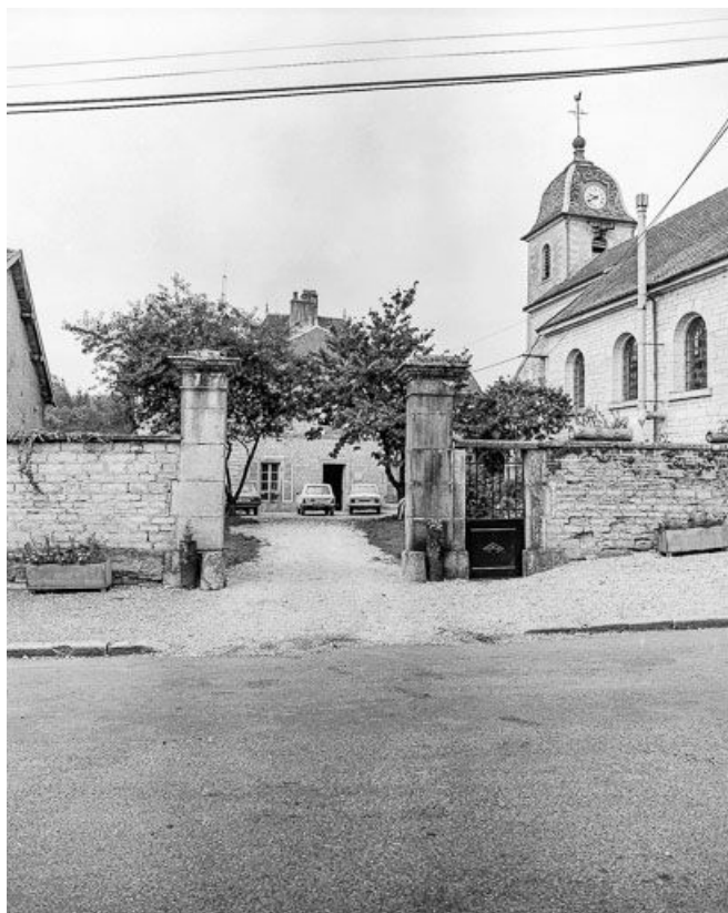
Vue d'ensemble depuis le portail d'entrée.

70, Gézier-et-Fontenelay rue du Car, lieudit : Gezier