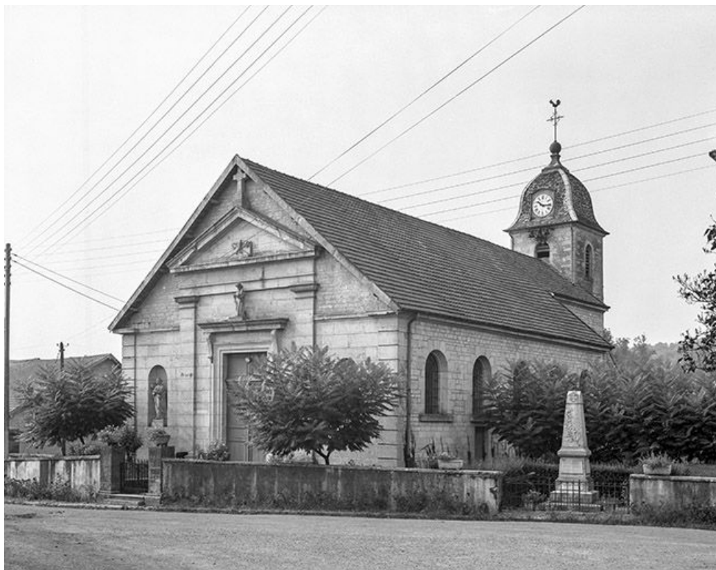
Extérieur : façade et côté droit, vue de trois quarts.