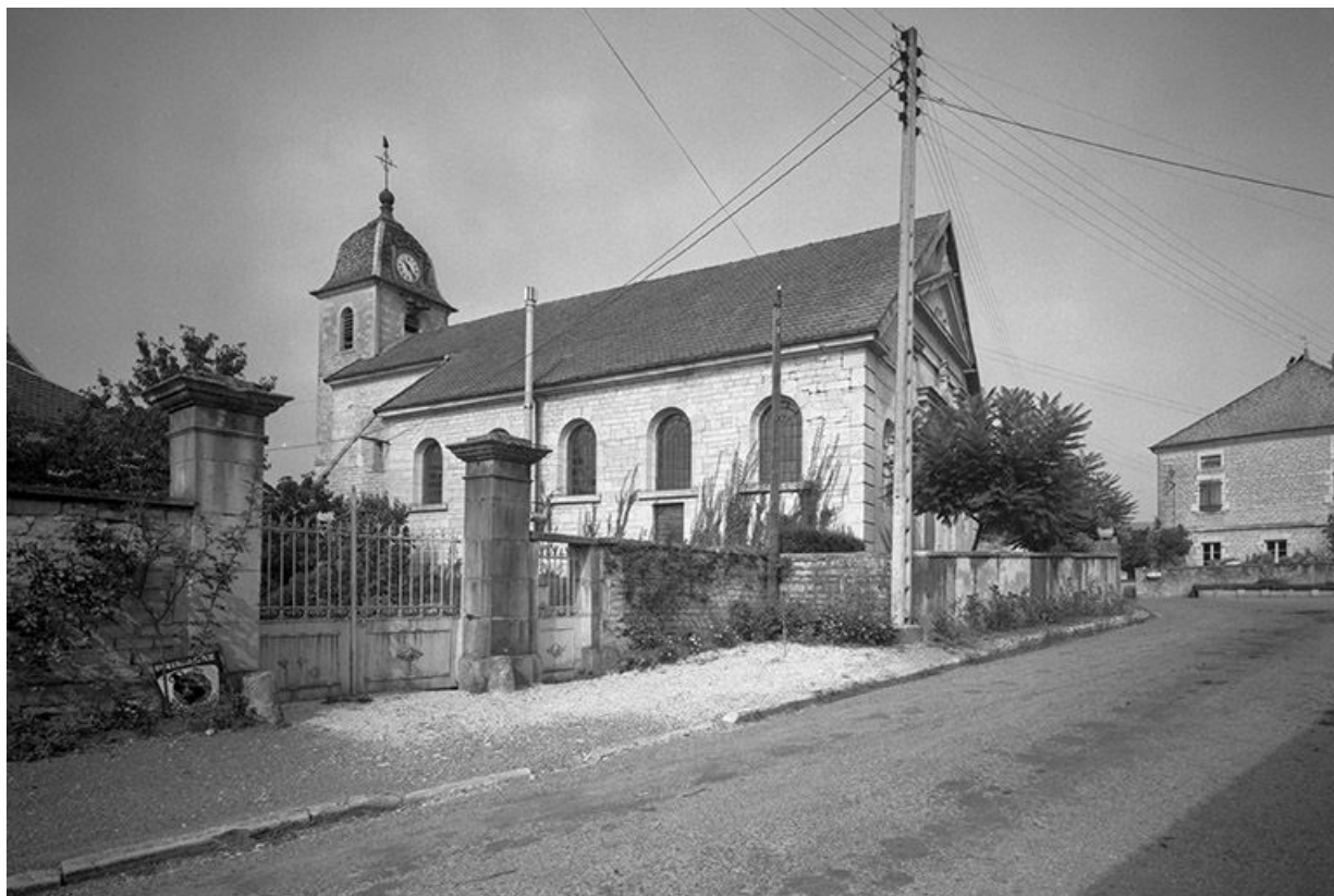
Façade antérieur, face gauche et tour-clocher.