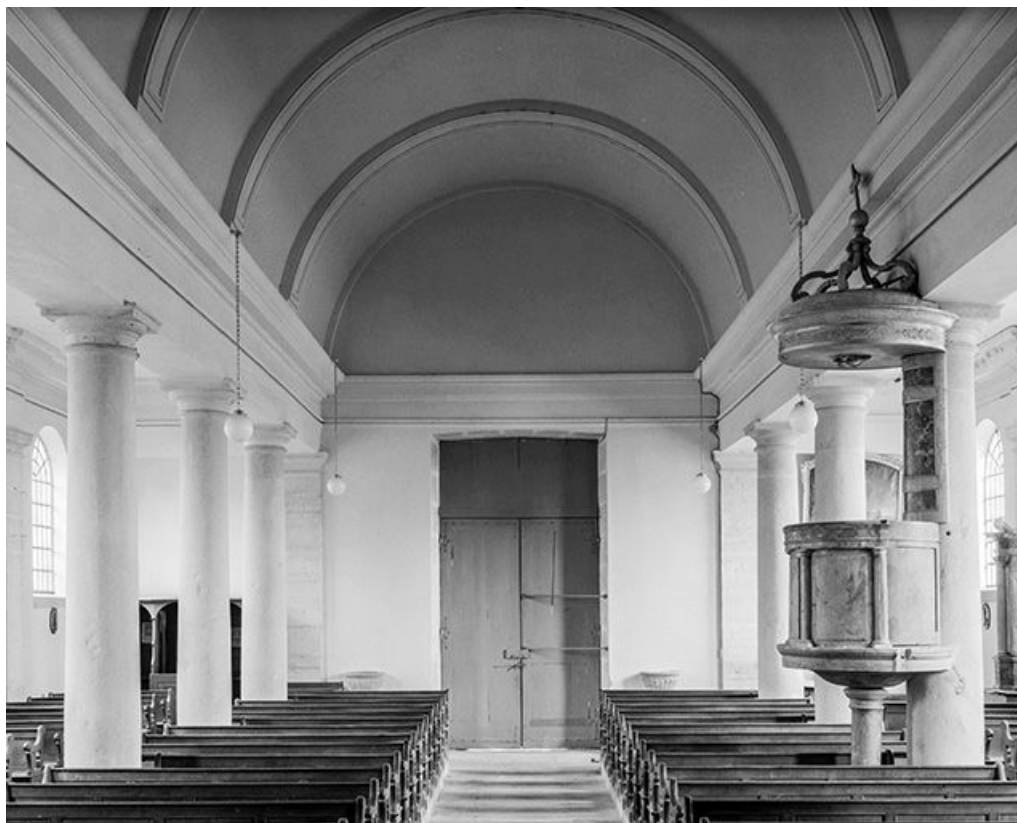
Nef : vaisseau central et chaire à prêcher vus du chœur.