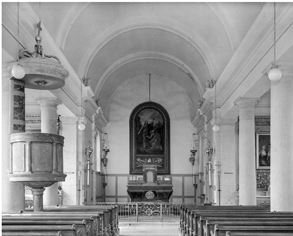
Intérieur : nef, vaisseau central et chœur. 70, Gézier-et-Fontenelay rue du Car