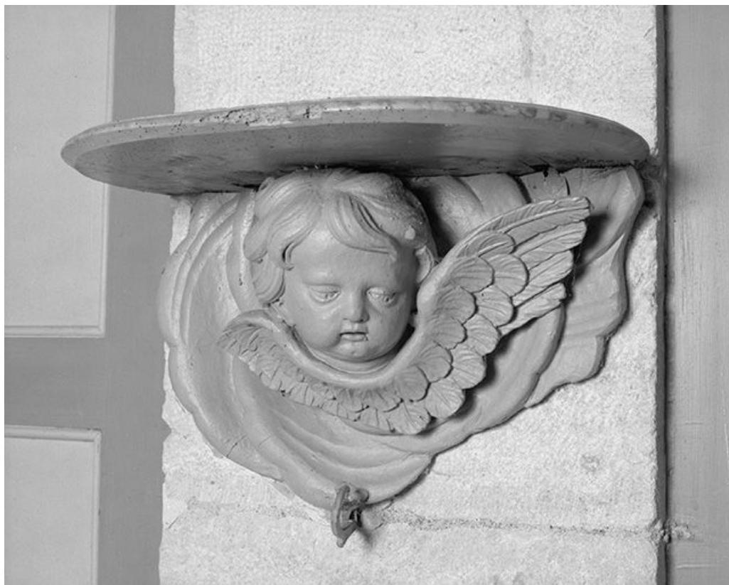
Console avec tête d'angelot ailé.