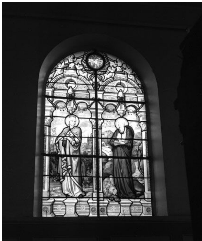
Baie 2 réalisée par A. Lusson de Paris en 1864 : personnages debout dans un paysage sous un encadrement d'architecture de style Renaissance orné de 6 anges et de motifs floraux (sainte Elisabeth (?) à gauche, saint jérôme à droite.