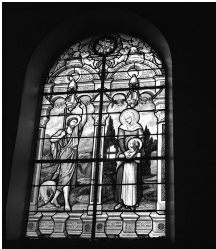
Baie 1 réalisée par A. Lusson de Paris en 1864 : personnages debout dans un paysage sous un encadrement d'architecture de style Renaissance orné de 6 anges et de motifs floraux (saint Jean-Baptiste à gauche, sainte Anne et la Vierge à droite. 70, Gézier-et-Fontenelay