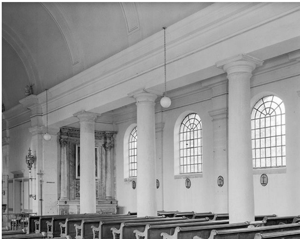
Intérieur : collatéral droit.