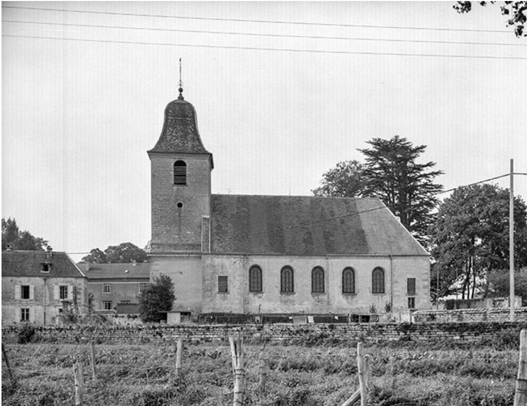
Face latérale droite.