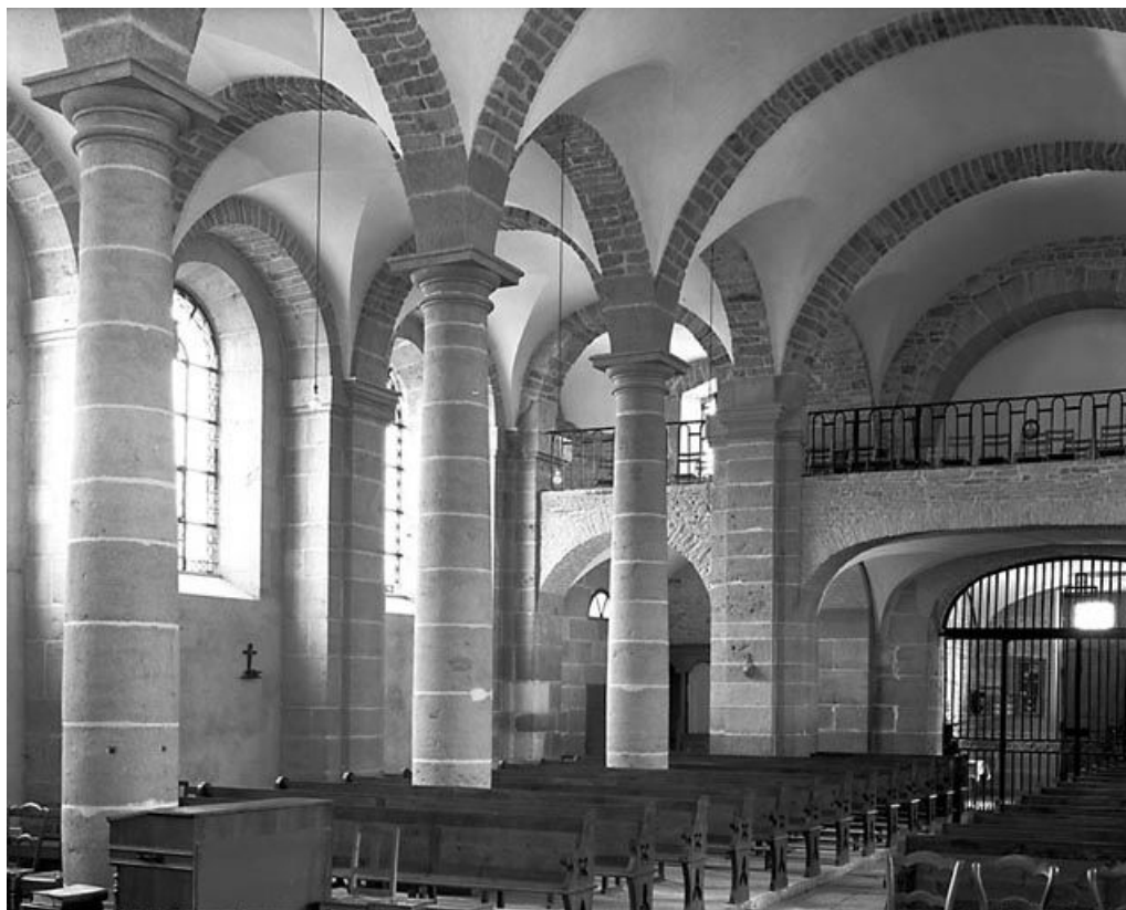
Vaisseau central et bas-côté droit vus du choeur.