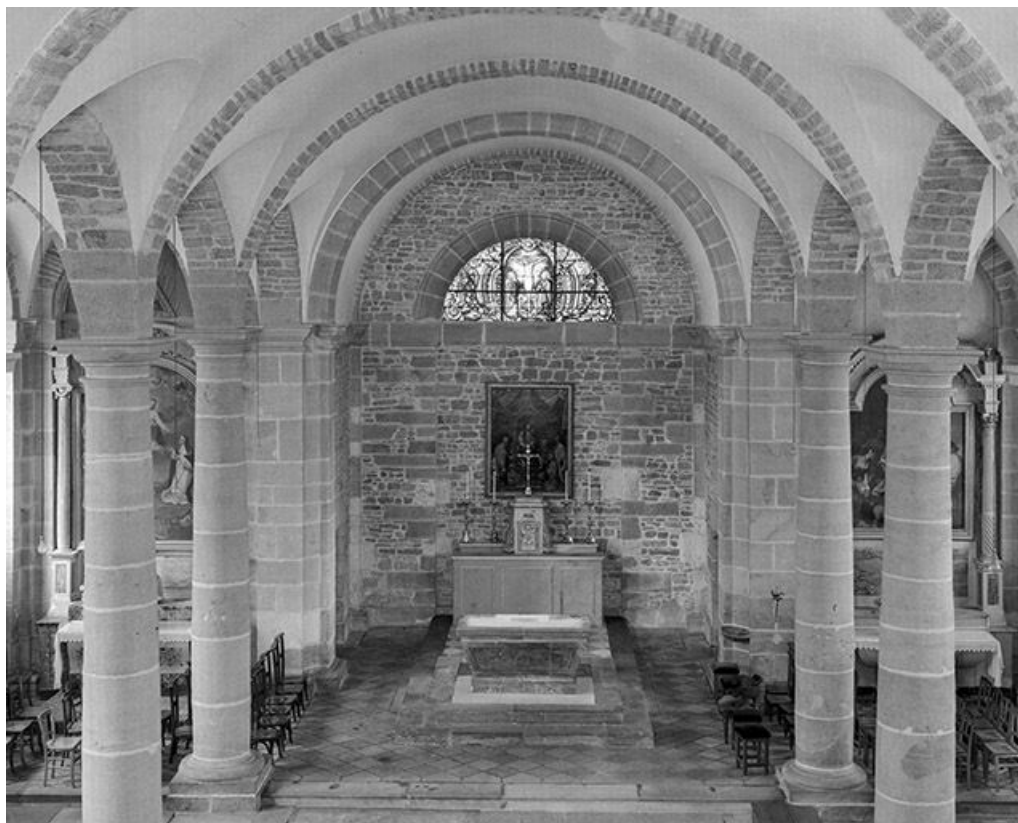
Choeur vu de la tribune.