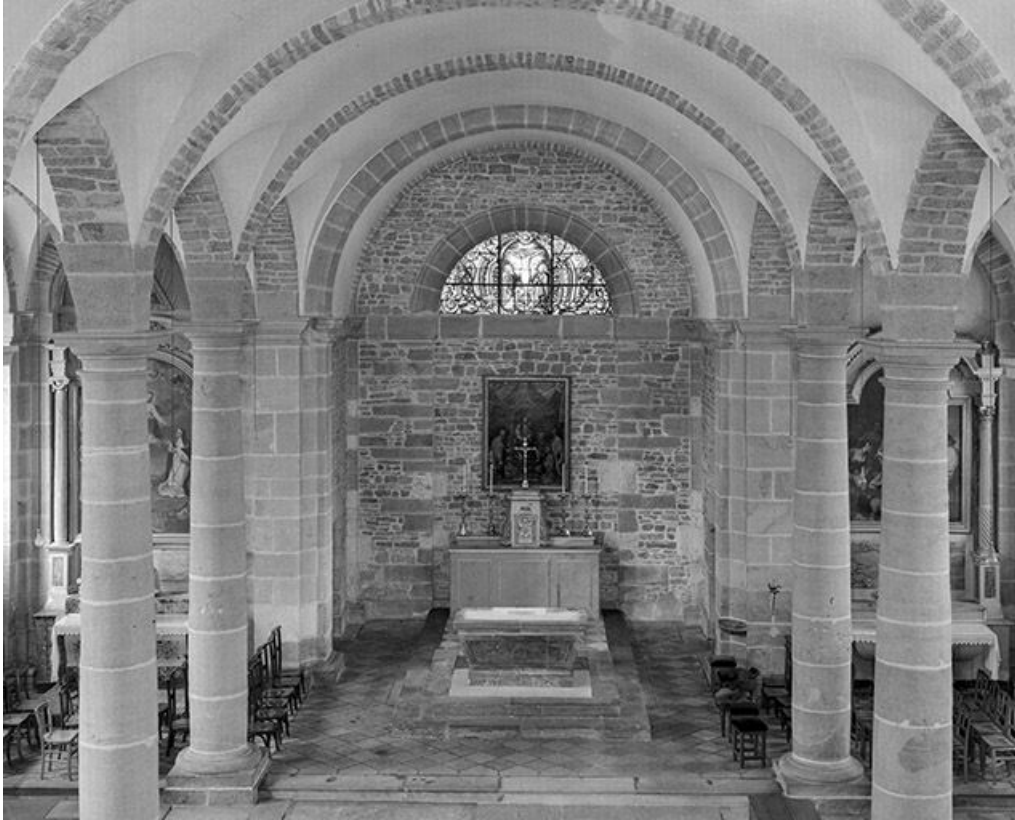
Choeur vu de la tribune.