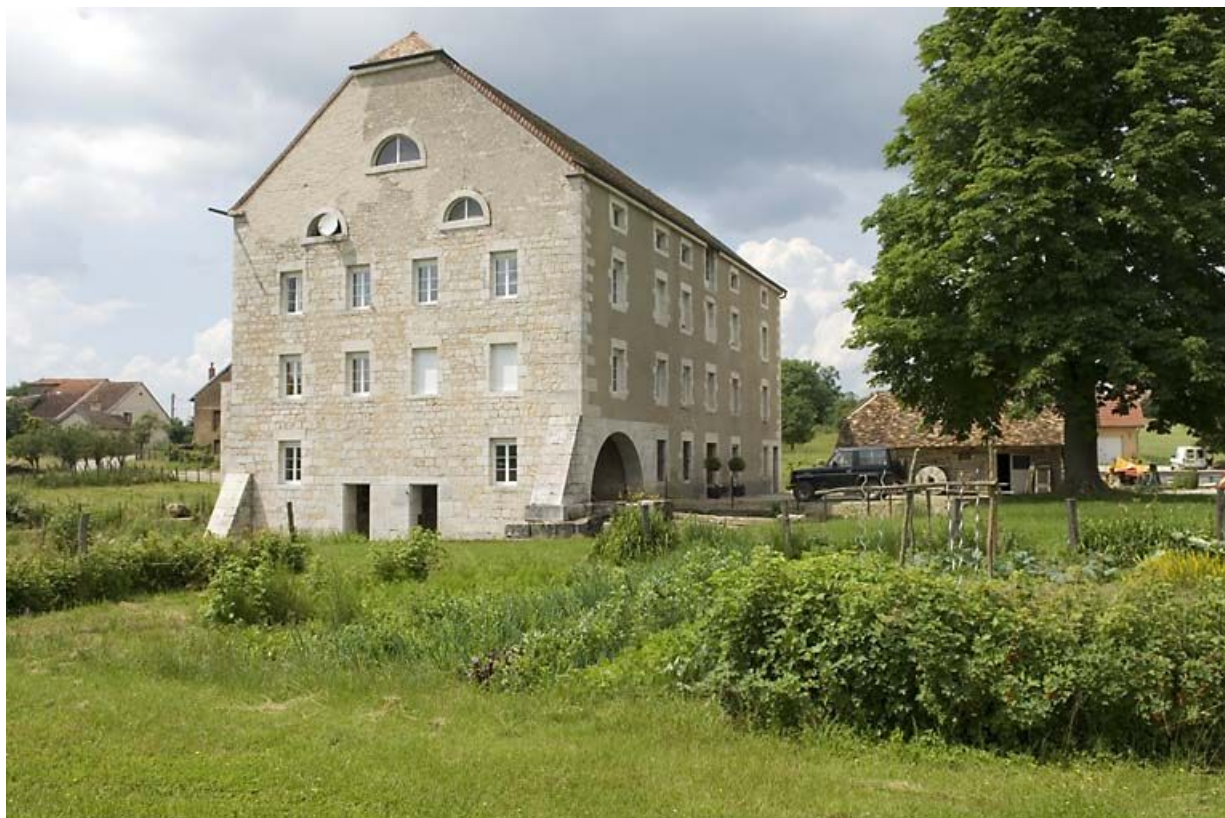
Vue rapprochée depuis le sud-est.