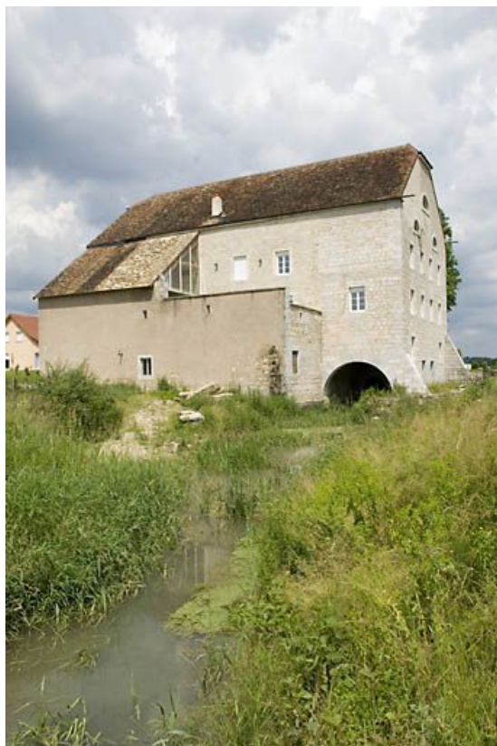
Vue d'ensemble depuis le bief d'aval.