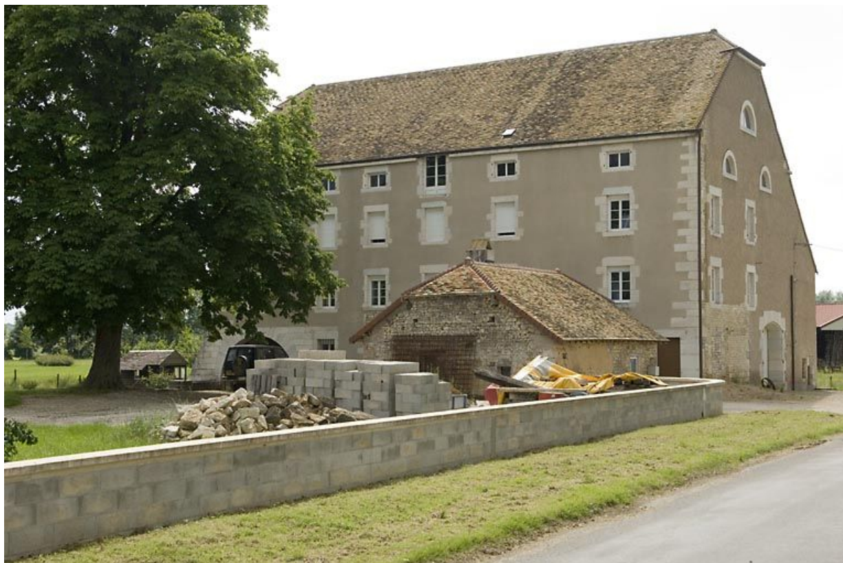
Vue du moulin depuis le nord-est.