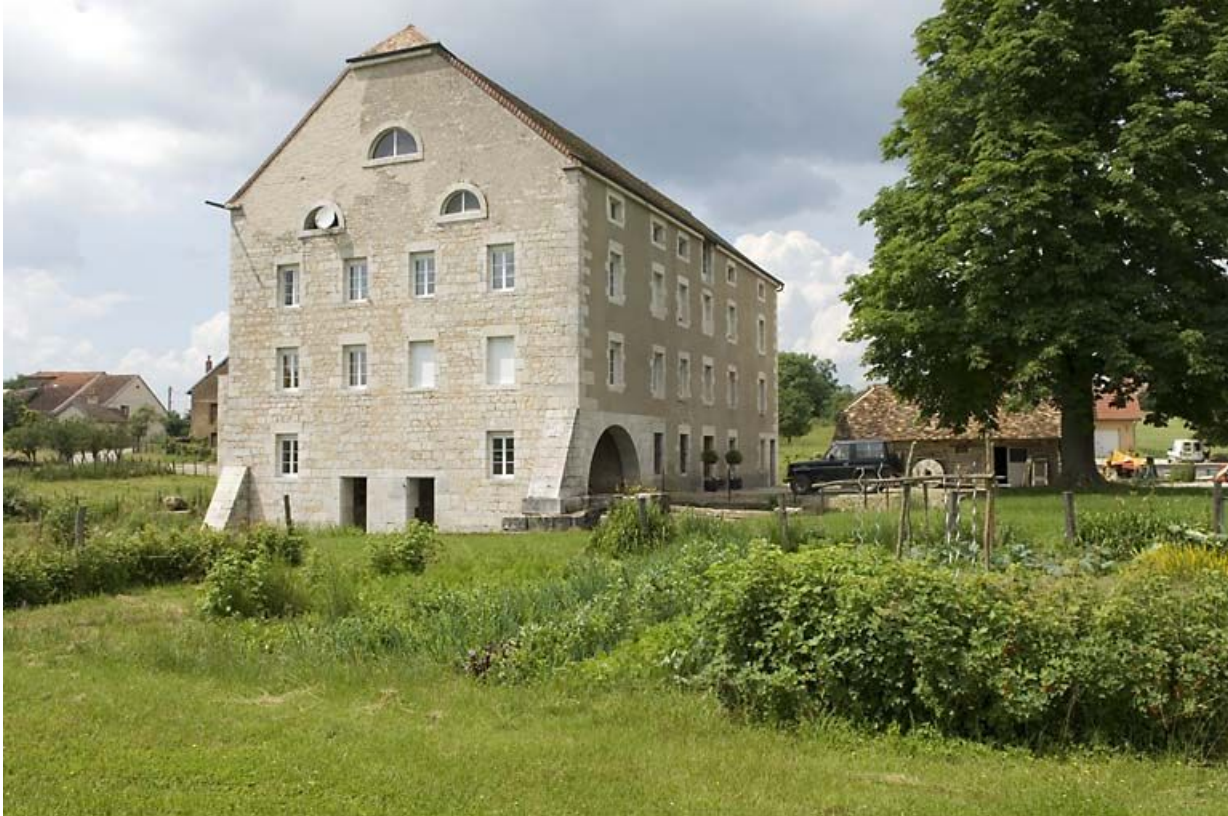
Vue rapprochée depuis le sud-est.