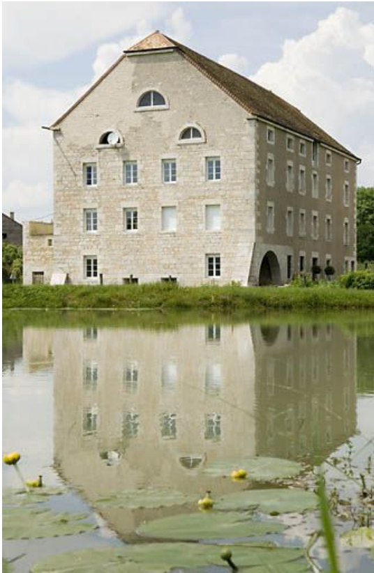
Le moulin vu de trois quarts.