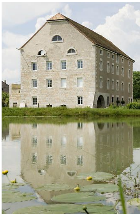
Le moulin vu de trois quarts.