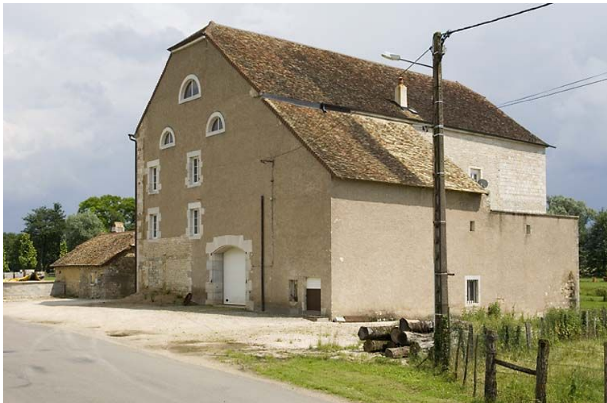
Le moulin vu de trois quarts arrière.