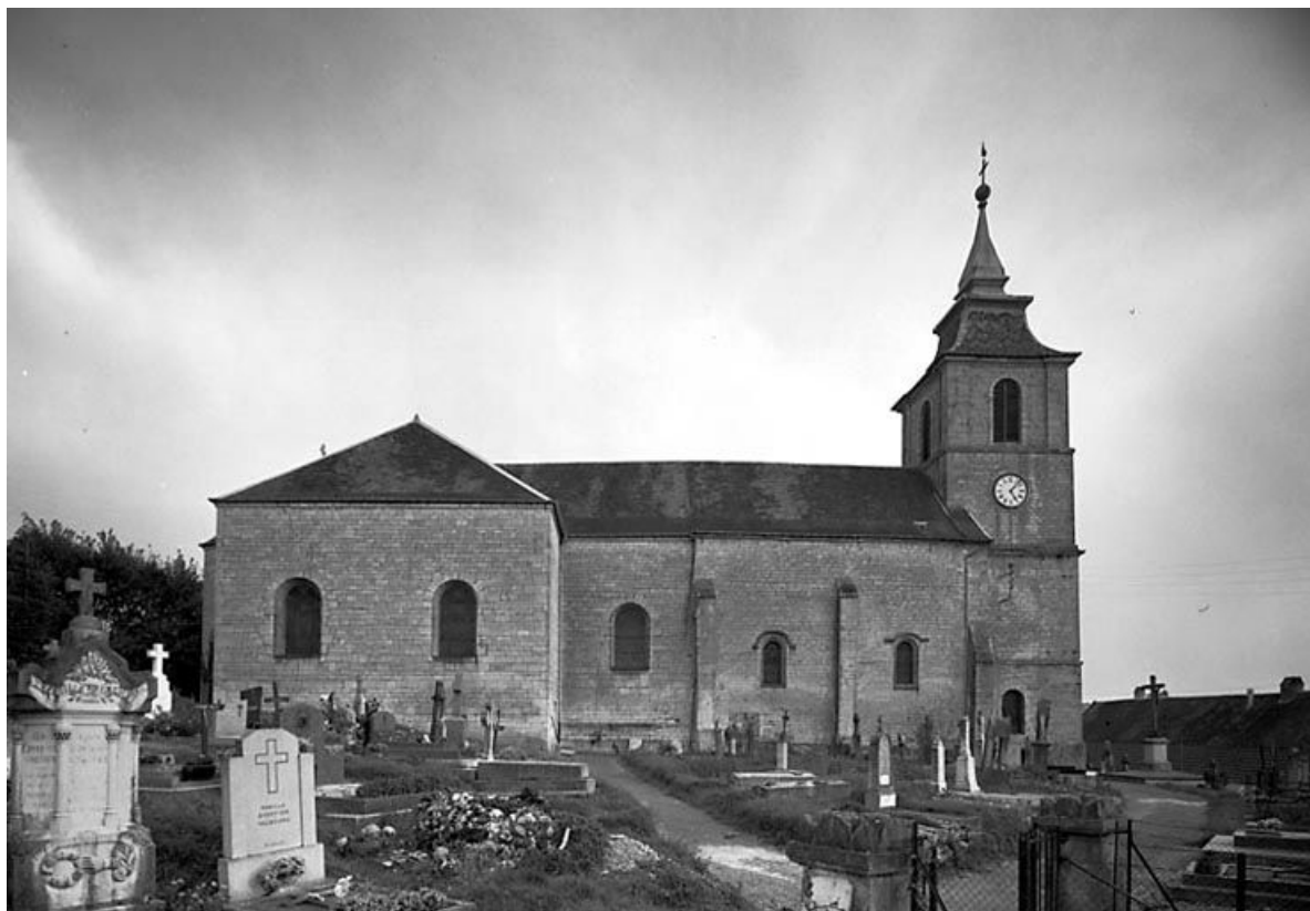
Façade latérale gauche. 70, Choye rue de l' Église