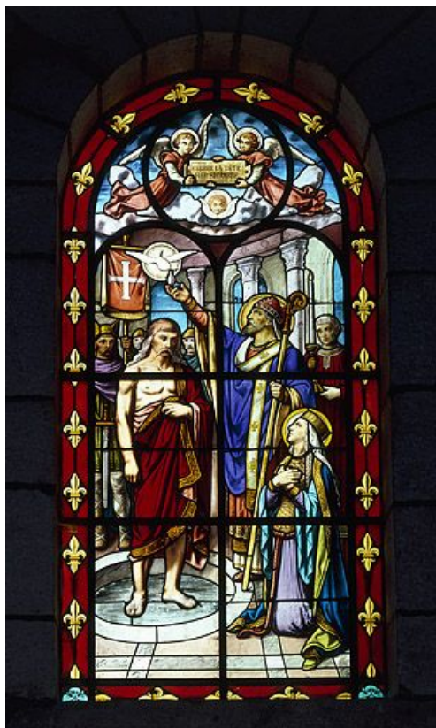
Baptême de Clovis : baie 1 réalisée à la fin du 19e siècle ou au début du 20e par l'atelier Vve J. Beyer (grande composition, bordure de fleur de lys et inscription sur banderole tenue par deux anges au tympan). 70, Choye