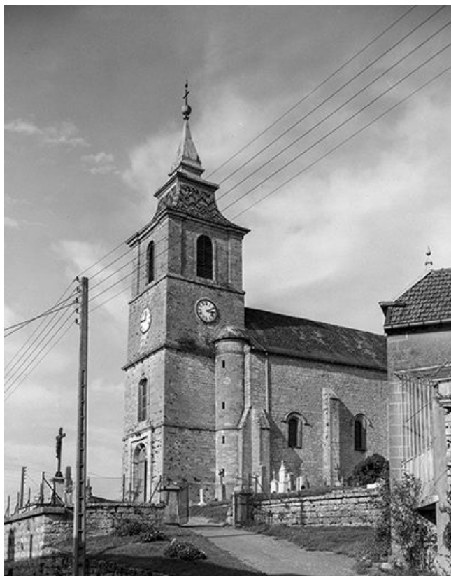
Tour-clocher et façade latérale droite.