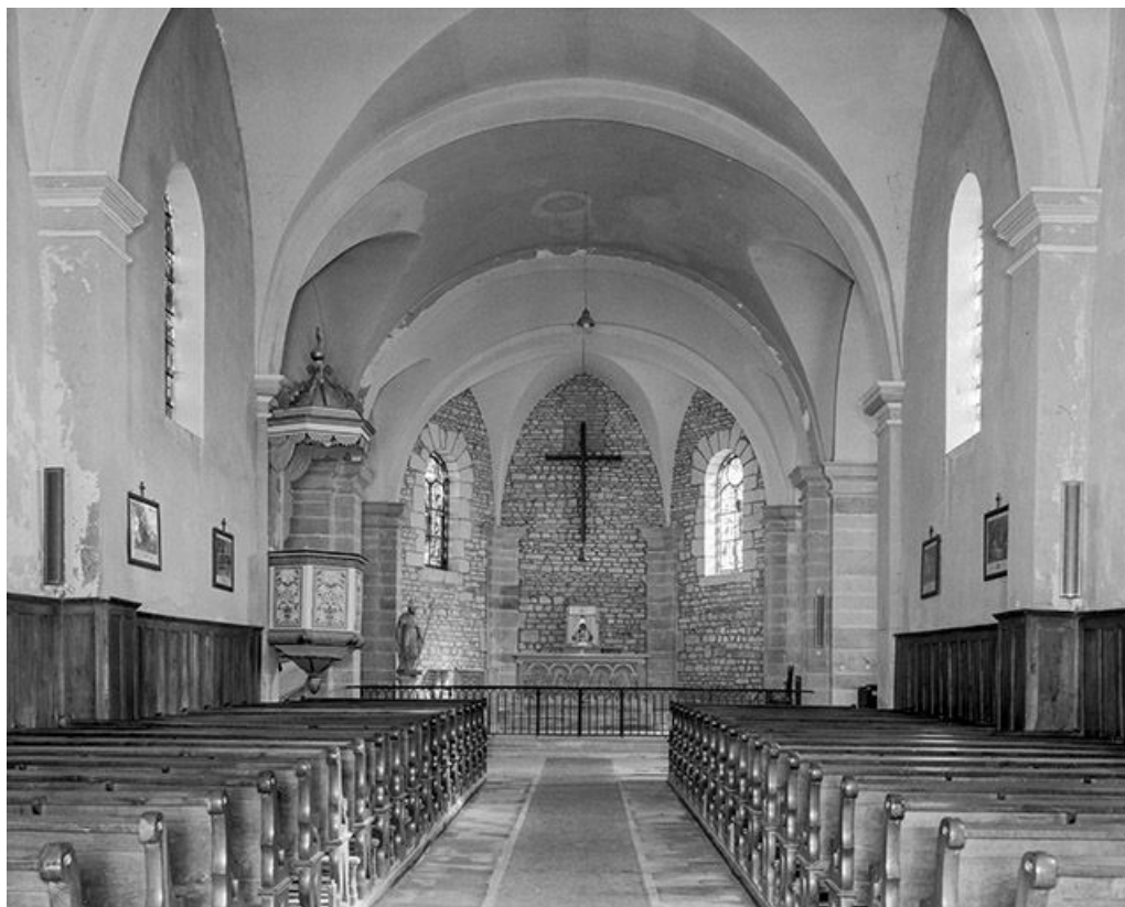
Vue de la nef et du chœur.