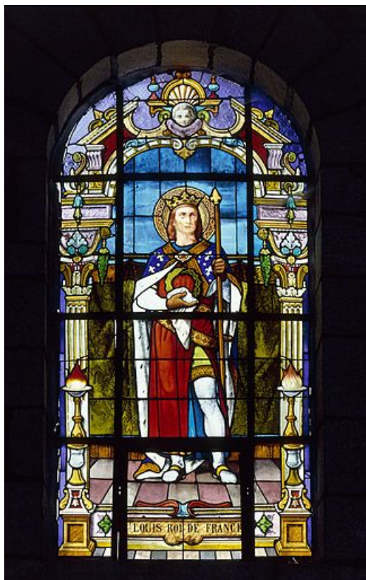
Saint Louis, roi de France : baie 3 réalisée par l'atelier Vve J. Beyer et fils aîné à la fin du 19e siècle ou au début du 20e (grand personnage debout dans un encadrement d'architecture de style Renaissance).