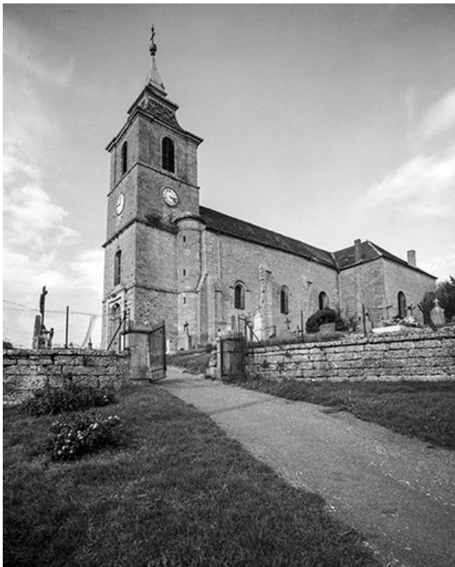
Tour-clocher et façade latérale droite.