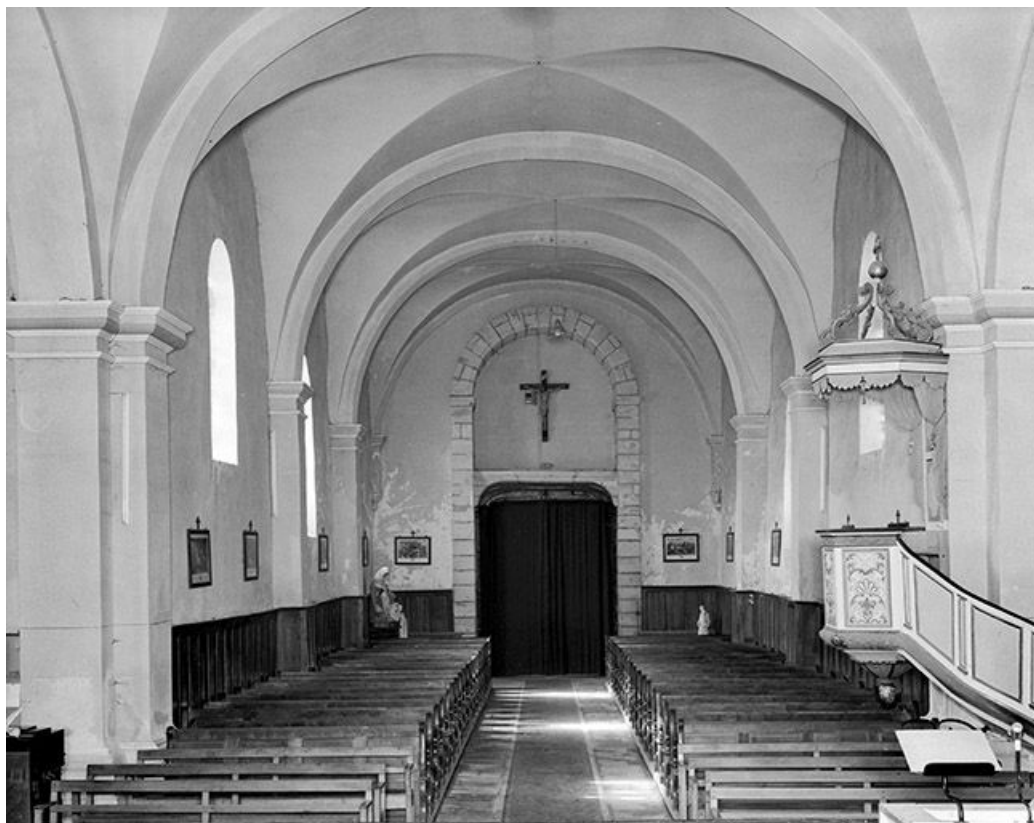
La nef vue du chœur.