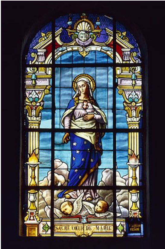
Sacré Coeur de Marie : baie 6 réalisée par l'atelier Vve J. Beyer et fils aîné à la fin du 19e siècle (grand personnage debout dans un encadrement d'architecture de style Renaissance).