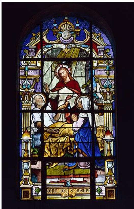
Mort de saint Joseph : baie 5 réalisée par l'atelier Vve J. Beyer et fils aîné à la fin du 19e siècle ou au début du 20e (grand personnage debout dans un encadrement d'architecture de style Renaissance).