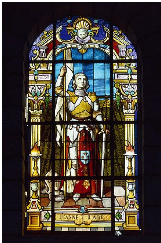
Sainte Jeanne d'Arc : baie 4 réalisée par l'atelier Vve J. Beyer et fils aîné à la fin du 19e siècle ou au début du 20e (grand personnage debout dans un encadrement d'architecture de style Renaissance).